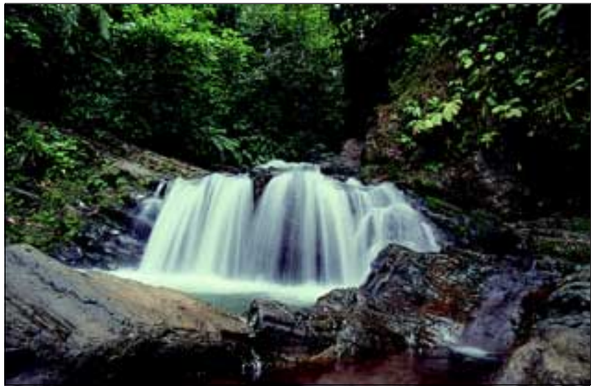
Abb. 12: Infolge der reichlichen Niederschläge findet man im „Regenwald der Österreicher“ eine Vielzahl kleiner Bäche und Wasserfälle vor (Rio Sardinal).

Im Unterwuchs fällt sofort eine Pflanze mit riesigen Blättern auf, die an eine Fächerpalme erinnert. Diese zu den Scheinpalmen gehörende Pflanze wird im Volksmund auch Panamahutpflanze ( Carludovica - Abb. 16) genannt, da die frisch ausgetriebenen Blätter für die Herstellung der bekannten Panamahüte verwendet werden. Obwohl es sich um eine prächtige und auffällige Pflanze handelt, war lange Zeit über ihre Biologie wenig bekannt und erst seit kurzem kennt man den sehr komplexen Bestäubungsmechanismus. Kleine männliche und weibliche Rüsselkä-