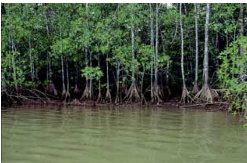
Abb. 30: Das Teegewächs Pelliziera rhizophorae bildet im Unterlauf des Rio Esquinas großflächige Bestände.