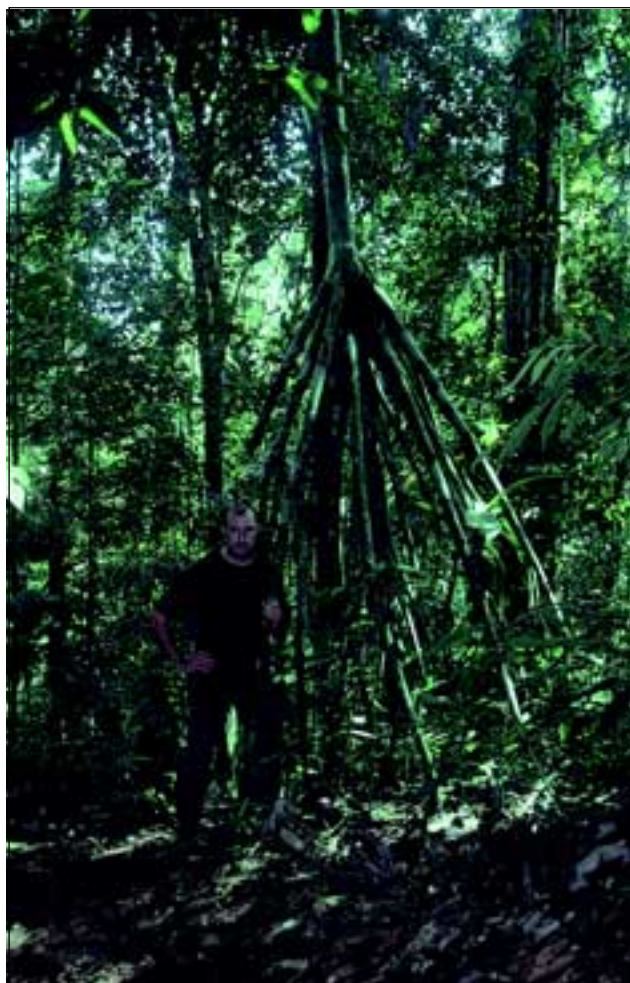
Abb. 22: Die Palme Socratea exorrhiza bewegt sich mit Hilfe ihrer Stelzwurzeln in Richtung Licht und wird des- wegen auch als „Wanderpalme“ bezeichnet.

Kurios sind auch die so genannten Humus sammelnden Pflanzen, die im „Regenwald der Österreicher“ im Schlucht- wie auch im Hangwald vorkommen. Diese Wuchsform ist kaum untersucht und kommt nur in den feuchtesten Regenwäldern der Erde vor. Im „Regenwald der Österreicher“ gibt es eine Vielzahl davon, von denen hier die Art Clavija costaricana (Abb. 23) aus der Familie der Theophrastaceae behandelt werden soll. Als kleiner Unterwuchsbaum mit trichterförmiger Krone wird