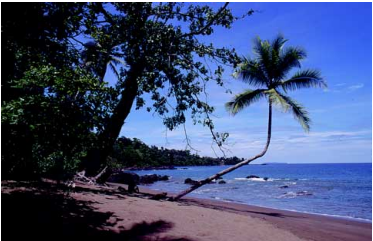
Abb. 28: Die häufigste Pflanze entlang der ausgedehnten Sandstrände ist die Kokospalme, deren schwimmfähige und salzresistente Früchte über Ozeane hinweg verbreitet werden können.

Die bekannteste Baumart ist die Rote Mangrove ( Rhizophora mangle - Rhizophoraceae - Abb. 29, 31). Sie