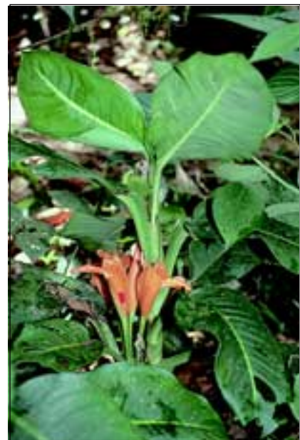
Abb. 9: An sehr feuchten Standorten bildet das Aronstabgewächs Dieffenbachia concinna dichte Bestände. Die auffällig orangefarbene Früchte sind von bodenlebenden Vögeln sehr begehrt.

(Araceae), Pfeilwurzgewächsen (Marantaceae), Costus -Arten (Costaceae), Helikonien (Heliconiaceae), Ingwergewächsen (Zingiberaceae) und Scheinpalmern (Cyclanthaceae) gebildet. Es sind vor allem diese Pflanzen, die dem Besucher einen ersten Eindruck des ungeheuren Artenreichtums vermitteln. Viele davon werden bei uns als Zimmerpflanzen gehalten, wie die mit mehreren Arten vorkommende Gattung Dieffenbachia (Abb. 9). Diese Pflanzen sind für den Pfeilgiftfrosch Dendrobates granuliferus (Abb. 10) überlebenswichtig. Die weiblichen Tiere bringen ihre Larven in die Stengel umfassenden,