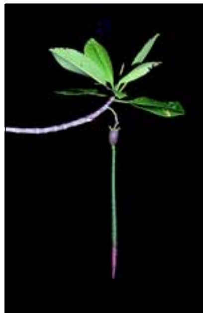
Abb. 31: Viele Mangrovenpflanzen bilden „lebend gebärende“ Früchte aus. Bei der Roten Mangrove ist die eigentliche Frucht im Vergleich zur verlängerten und schwimmfähigen Primärwurzel sehr klein.