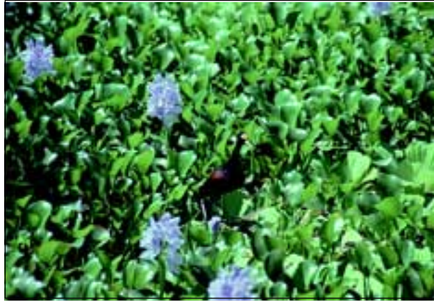
Abb. 33: Der Gelbstrinjacana lebt auf schwimmenden Wiesen, die im Gebiet vorwiegend von der Wasserhyazinthe und dem Wassersalat gebildet werden.

In den größeren und langsam fließenden Flüssen der Region findet man bekannte Wasserpflanzen wie die violett blühende Wasserhyazinthe Eichornia crassipaes (Pontederiaceae) oder den Wassersalat Pistia stratiotes (Araceae). Werden größere Flächen von diesen schwimmfähigen Pflanzen bewachsen, so spricht man auch von schwimmenden Wiesen. Ein Spezialist dieses Lebensraumes ist der auffällige Gelbstrinjacana (Abb. 33), der dort nach Kleintieren jagt und sein Gelege baut.