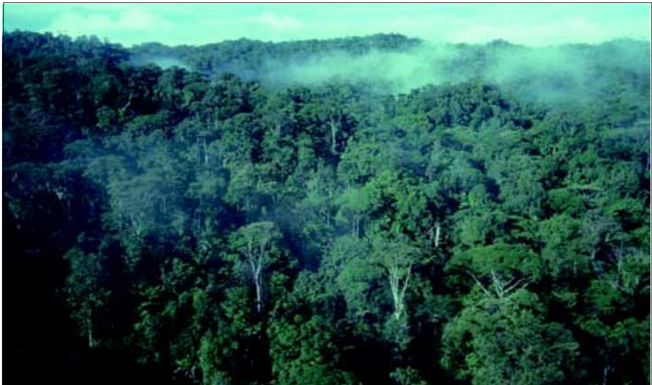
Abb. 1: Der „Regenwald der Österreicher“ aus der Luft gesehen.

Im Südosten von Costa Rica befindet sich einer der erhaltenswertesten Regenwälder der Erde, der Esquinas Wald. Aufgrund der geographischen und erdgeschichtlichen Gegebenheiten ist dieser tropische Tieflandregenwald einer der artenreichsten Wälder der Erde, mit schätzungsweise 3.000 Pflanzenarten und bis zu 190 Baumarten auf einem Hektar. Noch vor wenigen Jahren stand der