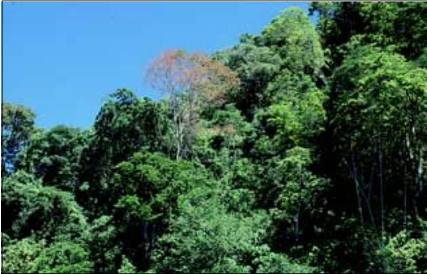
Abb. 24: Der Baum Schizolobium parahyba ist typisch für Küstenwälder und fällt durch die helle Rinde und die schirmförmige Krone sofort auf. Um für bestäubende Insekten attraktiv zu sein, blüht der Baum im Jänner, während der laublosen Zeit.

herabfallendes Laub eingefangen und - wohlgermerkt - im Kronenbereich kompostiert! Die im „Komposthaufen“ enthaltenen Mineralstoffe können so von der jeweiligen Pflanze genutzt werden, ohne dass diese mit anderen Pflanzen geteilt werden müssen. Da die meisten tropischen Böden sehr mineralstoffarm sind, ist dies ein Konkurrenzvorteil gegenüber anderen Pflanzen.