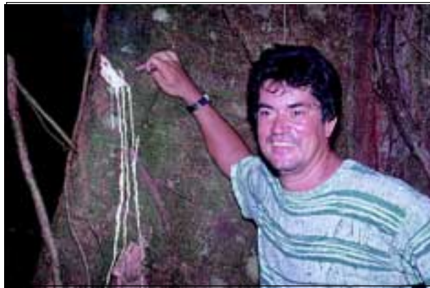
Abb. 7: Der Kuhmilchbaum „Vaca de leche“ ist eine jener Arten, die im Esquinas Wald ihr nördlichstes Verbreitungsgebiet aufweisen. Die Einheimischen nutzten den weißen, süßlich schmeckenden Saft früher als Milchersatz.

Es gibt nur wenige Regionen auf der Erde, die auf einer so geringen Fläche eine dermaßen hohe Artenvielfalt aufweisen, wie die Golfo Dulce Region (VAUGHAN 1981). Ein Grund dafür ist auch die Lage Costa Ricas, die als Korridor zwischen Nord- und Südamerika Wanderungsbewegungen von Pflanzen und Tieren ermöglichte. So kommen allein im „Regenwald der Österreicher“ auf einer Fläche von 150 km 2 an die 3.000 Pflanzenarten vor. Im Vergleich dazu sind es in Österreich auf einer Fläche von etwa 84.000 km 2 ca. 3.300 Pflanzenarten. Bemerkenswert ist auch die Tatsache, dass die Region über 700 Baumarten beherbergt. Dies ist ein Viertel aller Baumarten, die in Costa Rica vorkommen sowie die größte Baumartenvielfalt in ganz Mittelamerika (QUESADA u. a. 1997).