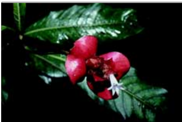
Abb. 19: Psychotria elata ist eine der auffälligsten Arten der Kaffeegewächse. Wegen der intensiv gefärbten Hochblätter wird diese Pflanze auch „Küssende Lippen“, „hot lips“ oder auf Spanisch „Jabia de mujer“ genannt. Sie dienen dazu, Bestäuber wie Kolibris oder Schmetterlinge anzulocken.