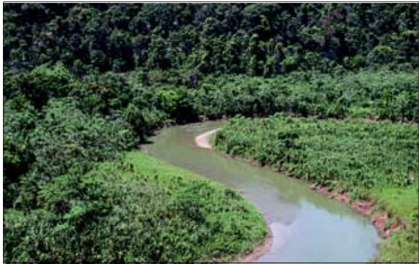
Abb. 5: Der Río Esquinas, der sich mit eindrucksvollen Mäandern durch die Landschaft zieht, bildet die nördliche und westliche Grenze des „Regenwaldes der Österreicher“.

Die natürliche Grenze des Parks wird im Norden und Westen vom Río Esquinas, benannt nach seinen Mäandern (Esquinas bedeutet auf Spanisch Ecke), gebildet. Die südliche Grenze bildet der Golfo Dulce und im Osten begrenzt eine Schotterstraße den Park. Der Río Esquinas (Abb. 5) ist der Hauptfluss des „Regenwaldes der Österreicher“. Viele kleine Bäche durchziehen den Wald, manche davon mit herrlichen Wasserfällen, die alle in den Río Esquinas münden. Im Mündungsbereich des Río Esquinas, der in den Golfo Dulce entwässert, sind ausgedehnte Mangrovenbestände zu finden. Im Süden fällt der Esquinas Wald sehr steil zum Meer hin ab. Kleinere Buchten und einige größere Sandstrände - unterbrochen von steilen Klippen - kennzeichnen die Küstenlinie.