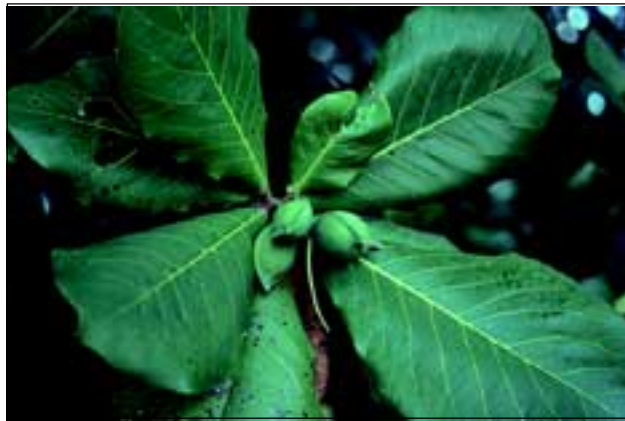
Abb. 27: Die Früchte der Strandmandel Terminalia catappa sind ein wichtiges Nahrungsmittel für den Roten Ara.

Die natürliche Küstenvegetation am Golfo Dulce ist durch agrarische Nutzung größtenteils zerstört worden, was der beeindruckenden Landschaft ihren Reiz jedoch nicht nimmt. Vorwiegend wachsen heute an den Sandstränden Kokospalmen (Abb. 28), die von den Einheimischen für viele Zwecke genutzt werden. Ein Sprichwort sagt, dass es an jedem Tag im Jahr eine andere Verwendungsmöglichkeit für Kokos gibt, so vielfältig ist diese Frucht einsetzbar. Die Früchte sind schwimmfähig und salzresistent, wodurch sie sich tausende Kilometer über das Meer ausbreiten können. Dies ist auch der Grund, warum heute weltweit an den tropischen Stränden Kokospalmen anzutreffen