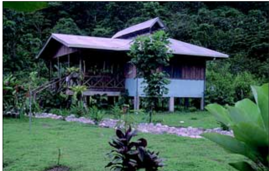
Abb. 37: Die Tropenstation La Gamba ist seit mehreren Jahren ein Fixpunkt der österreichischen und internationalen Tropenforschung.

Seit 1993 werden mehrmals pro Jahr Studentenkursen österreichischer Universitäten und naturkundlicher Vereine/Institute durchgeführt. Den Studenten wird ein Einblick in die tropischen Ökosysteme gegeben und die Wichtigkeit der Erhaltung vor Augen geführt. Seit 1995 werden auch mehrmals pro Jahr Tropenkurse und Naturstudienreisen durchgeführt. Unter fachkundiger Leitung von Biologen wird eine wissenschaftliche Einführung in das Ökosystem Regenwald gegeben und auf die Wichtigkeit und Probleme seiner Erhaltung hingewiesen.