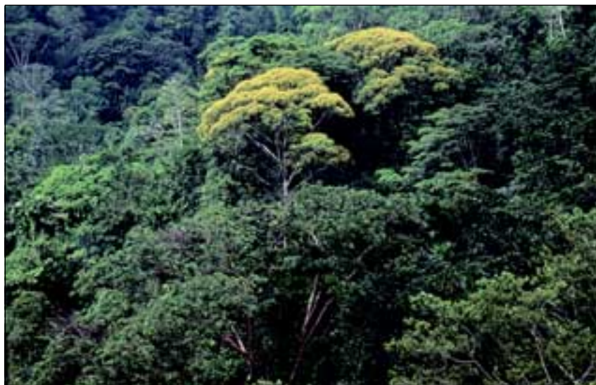
Abb. 21: Der farbenprächtige Baum Vochysia ferruginea wird von den Einheimischen als „Mayo“ bezeichnet, da seine Hauptblütezeit in den Monat Mai fällt.

Die markantesten Elemente der Hangwälder sind Palmen, von denen es eine Vielzahl an Arten gibt. Am meisten beeindruckt die mit mächtigen Stelzwurzeln ausgestattete „Wanderpalme“ Socratea exorrhiza (Abb. 22),