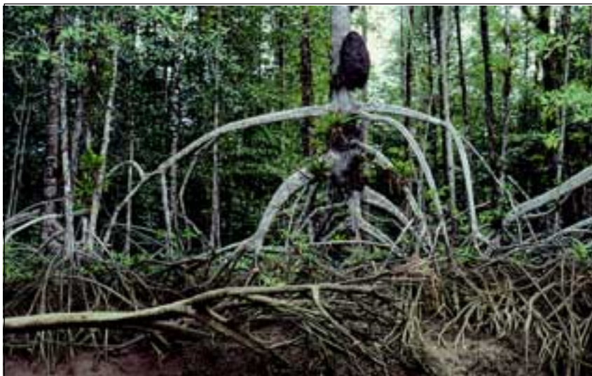
Abb. 29: Die weit ausladenden Stelzwurzeln der Roten Mangrove sind notwendig, um der ständigen mechanischen Belastung durch Ebbe und Flut standhalten zu können. Die Stamm-Ast-Gabelungen dienen oft Bromelien und Termiten als Lebensraum.