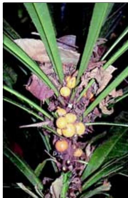
Abb. 23: Der Unterwuchsbaum Clavija costaricana sammelt mit seiner trichterförmigen Blattkrone herabfallendes Laub ein, das im Kronenraum kompostiert wird. Diese Strategie bringt der Pflanze zusätzliche Mineralstoffe. Die Art der Ausbreitung der orangefarbenen Früchte ist unbekannt.

da sie im Gegensatz zu anderen Pflanzen ihren Standort verändern kann. Je nachdem, woher das meiste Licht kommt, verlängert oder verkürzt sie ihre neu gebildeten Stelzwurzeln. Auf diese Art und Weise kann die Palme ein Stück in Richtung Licht wachsen und ihre ursprüngliche Position verändern.