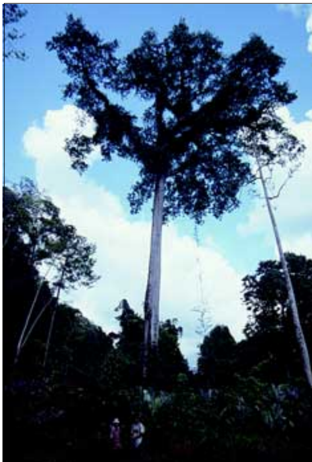
Abb. 11: Der Kapokbaum ist einer der beeindruckendsten Kronendachbäume in Wäldern an flachen Standorten. Leider sieht man den „heiligen Baum der Mayas“ meist nur mehr als Schattenspender auf Viehweiden.

Der geringere Artenreichtum an Bäumen im Schluchtwald fällt jedoch kaum auf, da man vom Epiphytenreichtum und dem dichten Unterwuchs sehr beeindruckt wird. Aufgrund des gleichmäßig feuchten Mikroklimas in den Schluchten kann sich hier eine reiche Epiphytenflora etablieren. Man findet kaum einen Baumstamm oder einen Ast, der nicht über und über mit Bromelien, Orchi-