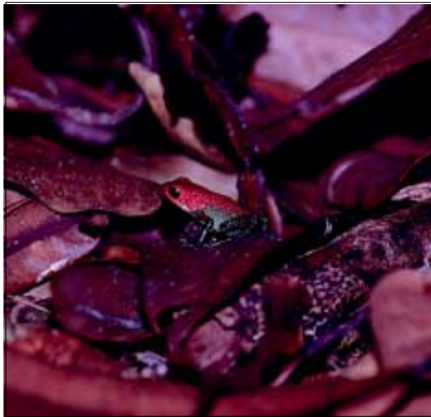
Abb. 10: Der Granulierte Baumsteiger ( Dendrobates granuliferus ) legt seine Larven in die wassergefüllten Blattscheiden von Dieffenbachia . Dieser bunt gefärbte Frosch zählt zu den Pfeilgiftfröschen. Bei Reizung produziert die drüsige Haut eine giftige Substanz, mit welcher früher die Indianer Südamerikas die Spitzen ihrer Jagdpfeile imprägnierten.

Einer der häufigsten Kronendachbäume ist Virola koschnyi (Abb. 13) aus der Familie der Muskatnussgewächse, der bereits von weitem wegen der waagrecht abstehenden Äste sehr leicht zu erkennen ist. Im März entwickeln sich die von Vögeln sehr begehrten Früchte. Sie werden vorwiegend von Tukanen (Abb. 15), einer Vogelgruppe, die ausschließlich in den Neotropen vorkommt, gefressen und verbreitet. Der lange Schnabel dieser Tiere ist