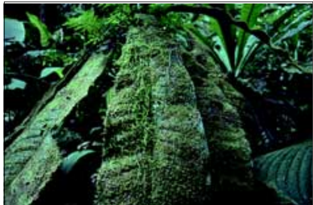
Abb. 14: An besonders feuchten Stellen des „Regenwaldes der Österreicher“ werden Blätter von anderen Pflanzen wie Lebermoosen oder Flechten überwachsen.