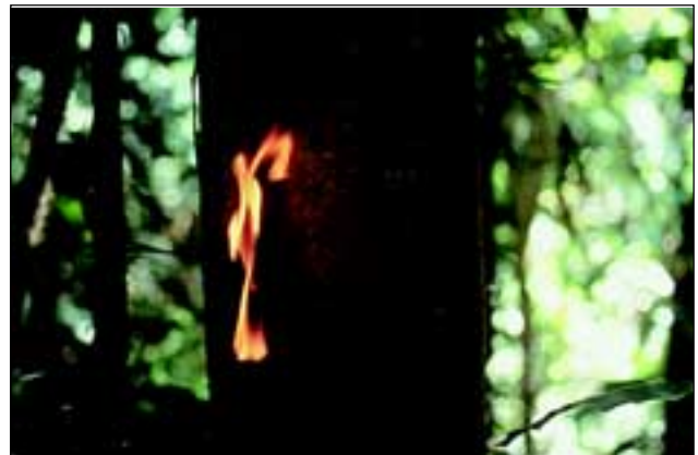
Abb. 18: Der Terpentinbaum lagert in seiner Rinde und in seinen Blättern in hoher Konzentration Terpene als Schutz gegen Fraßfeinde und Epiphytenbewuchs ein. Das austretende klare Harz entzündet sich sehr leicht.