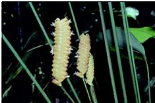
Abb. 8: Ein Viertel aller Pfeilwurzgewächse, die im „Regenwald der Österreicher“ vorkommen, sind endemisch. Eine besonders attraktive Art ist Calathea crotalifera , deren kompliziert gebauten Blüten von Bienen bestäubt werden.

Bemerkenswert ist auch der hohe Anteil an Pflanzenarten, die nur im „Regenwald der Österreicher“ und im angrenzenden Corcovado Nationalpark vorkommen (Lokalendemiten). Bei einer Untersuchung der Baumflora eines Hektars erwiesen sich 17 von den gefundenen 140 Baumarten als endemisch (HUBER 1996), bei den Pfeilwurzgewächsen waren es sogar 25 % (HERRERA-MACBRYDE u. a. 1997).