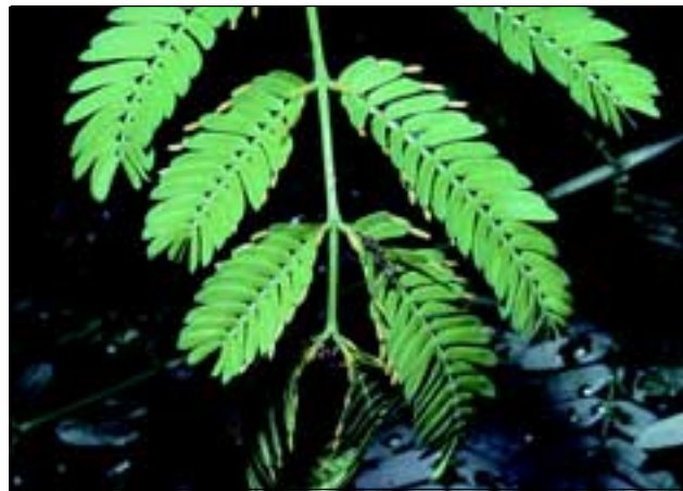
Abb. 36: Die endemische Akazie ( Acacia allenii ) lebt mit aggressiven Ameisen der Gattung Pseudomyrmex zusammen und bietet diesen als Nahrung eiweißreiche Futterkörperchen an, die an den Spitzen der Fiederblättchen gebildet werden.

Linie auf schnelles Emporwachsen setzen, um die umgebende Vegetation so schnell wie möglich zu überragen, verzichten sie aus energetischen Gründen auf eine Einlagerung von Fraß hemmenden Stoffen in ihre Blätter und Stämme. Vielmehr setzen sie auf die Verteidigung durch aggressive Ameisen. Die Ameisen sind aber nicht selbstlos und schützen den Wirtsbaum nicht ohne dadurch Vorteile zu haben. So bietet der Ameisenbaum Cecropia obtusifolia (Abb. 35) in seinen hohlen Stämmen eine Behausung, in der die Ameisen der Gattung Azteca vor Regen oder auch Fraßfeinden gut geschützt sind. Dies ist noch nicht alles! An den Blattbasen der jüngsten Blätter werden laufend die winzigen, so genannten Müllerschen Körperchen gebildet, die von den Ameisen gefressen werden. Als Inhaltsstoffe sind hier nicht wie üblich Stärke eingelagert, sondern ein tierischer Speicherstoff, das Glycogen. Dies ist bislang der einzig bekannte Fall, dass eine Pflanze tierische Substanzen als Nahrung anbietet. Als Gegenleistung für dieses „Hotel mit Vollpension“ verhalten sich die Ameisen bei geringster Berührung sehr aggressiv und greifen alles an, was in ihre Nähe kommt, wodurch Fraßfeinde sofort die Flucht ergreifen. Sogar Lianen, die versuchen, an einem Ameisenbaum emporzuwachsen werden von den angriffslustigen Ameisen sofort totgebissen.