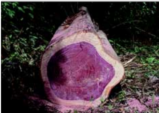
Abb. 17: Eines der schönsten und begehrtesten Hölzer der Region ist das des Purpurholzbaumes, wodurch diese Art heute stark gefährdet ist.

Verlässt man die Fila (span. = Kamm) talabwärts, so gelangt man in die et-