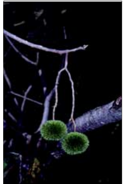
Abb. 26: Die Einheimischen nennen diese Frucht des Lindengewächses Apeiba tibourbou recht treffend Affenkamm.

Entlang von größeren Flüssen und Bächen etabliert sich ein eigener Vegetationstyp, der flussbegleitende Wald. Im Esquinas Wald kann dieser entlang der breiteren Flüsse wie Rio Gamba, Rio Bonito, Rio Oro und Rio Sardinal gefunden werden. Generell sind die Kronendachbäume etwas niedriger als in den bisher vorgestellten Waldtypen, haben aber oft auffällige Brettwurzeln ausgebildet. Besonders häufig ist das Lindengewächs Mortoniendron aniso-