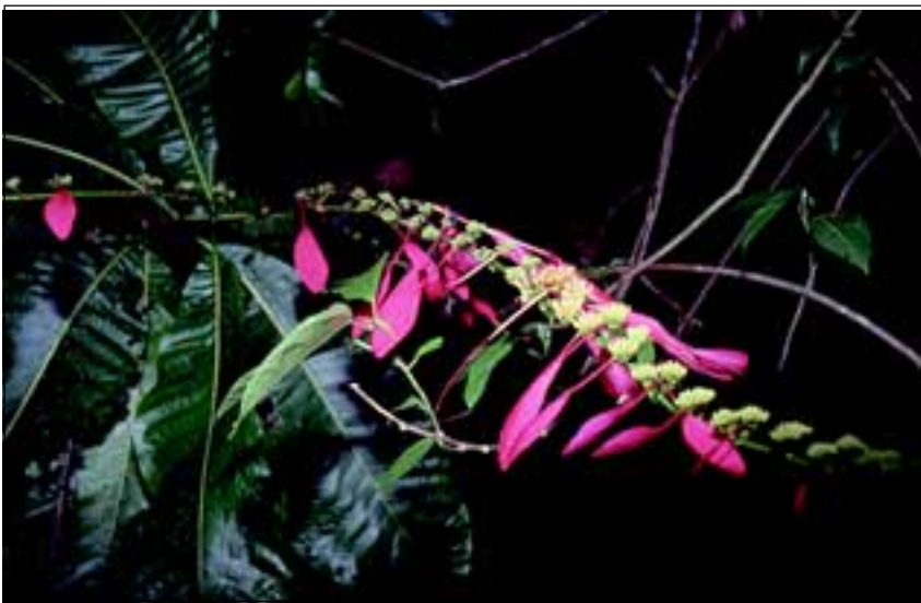
Abb. 25: Die wohl schönste Liane im Küstenwald ist das Kaffeegewächs Warszewiczia coccinea . Als Schauorgan sind bei dieser Pflanze einzelne Kelchblätter extrem vergrößert und rot gefärbt.

Fährt man mit dem Boot entlang der Küsten des Esquinas Waldes, so beeindruckt die vielen Lianen, die beinahe jeden Baum überziehen. Während der Trockenzeit sticht die rot blühende, häufige Liane Warszewiczia coccinea aus der Familie Rubiaceae (Abb. 25) sofort ins Auge. An ihren eigentlich un-