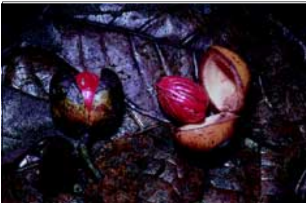
Abb. 13: Der Baum Virola koschnyi ist ein Verwandter des Muskatnussbaumes. Die einsamigen Früchte besitzen einen intensiv roten Samenmantel, der für Vögel äußerst attraktiv ist.

die Tiere von der Pflanze verköstigt, und vollziehen beim Herumkrabbeln und während der Paarung die Bestäubung der Pflanze. Erst am nächsten Morgen, gewissermaßen nach