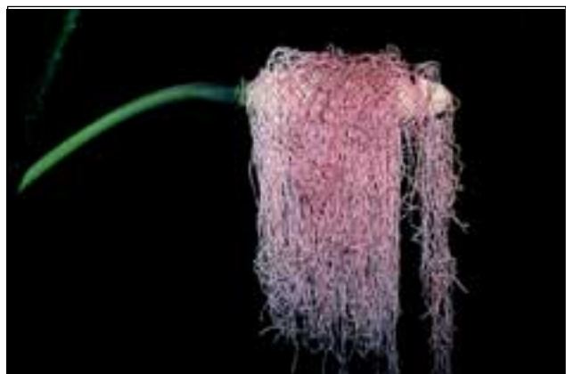
Abb. 16: Wie Spaghetti sehen die steril gewordenen Staubblätter der Panamahutpflanze Carludovica aus. Diese lang ausgezogenen Fäden locken nächtens männliche und weibliche Rüsselkäfer an, die sich im Blütenstand paaren und gleichzeitig mit mitgebrachtem Pollen die Blüten bestäuben.