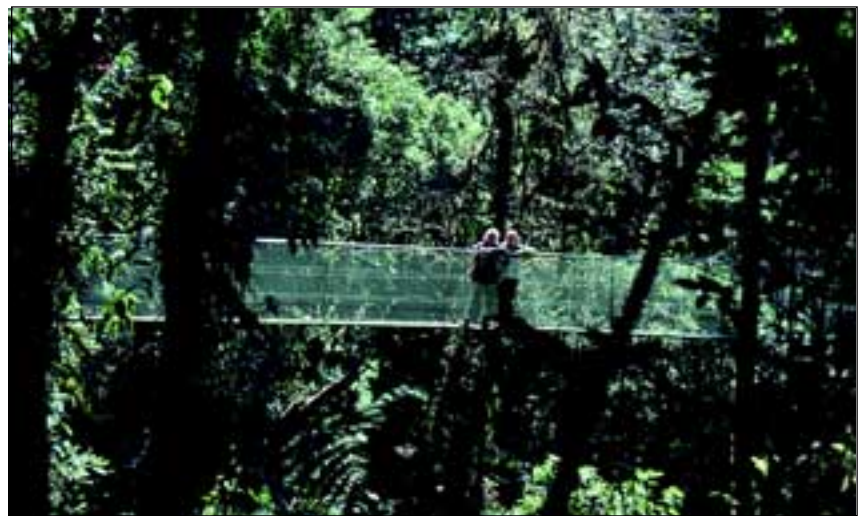
Abb. 38: Wegen der landschaftlichen Vielfalt und der guten Infrastruktur ist Costa Rica für Naturinteressierte ein ideales Reiseland. Der so genannte Skywalk von Monteverde gibt einen fantastischen Einblick in das kaum erforschte Kronendach des Regenwaldes.

Seit 1999 werden auch Reisen in das touristisch kaum bekannte Nicaragua durchgeführt. Die abwechslungsrei-