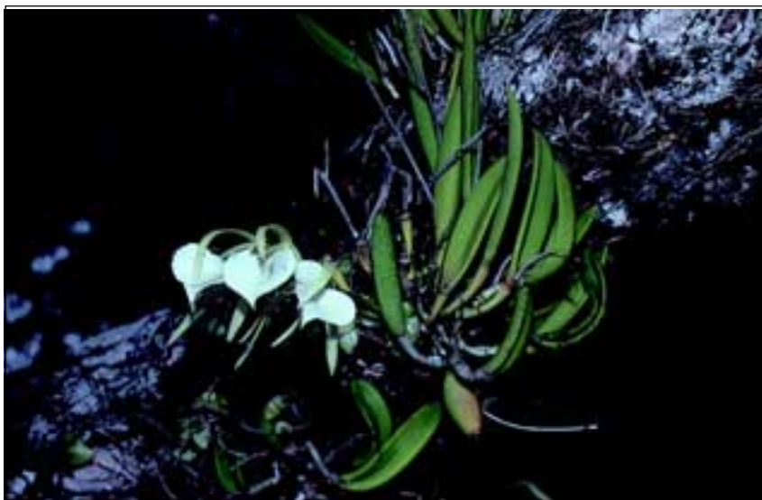
Abb. 32: Eine sehr hübsche epiphytische Orchidee der Mangrovenwälder ist Brassavola nodosa .

fällt sofort durch die extrem langen und weit ausladenden Stelzwurzeln auf, die wegen der ständigen mechanischen Beanspruchung durch Ebbe und Flut unabdingbar sind. Bemerkenswert sind auch die „lebend gebärenden“ Früchte, die bereits am Mutterbaum auskeimen und eine bis zu 40cm lange, schwimmfähige Keimwurzel bilden. Die Rote Mangrove steht immer in nächster Meeresnähe und ist für die Landgewinnung und als Erosionsschutz von immenser Bedeutung. Weiter flussaufwärts findet man das Teegewächs Pelliziera rhizophorae (Abb. 30) mit ausgeprägten, konischen Brettwurzeln und herzförmigen Früchten.