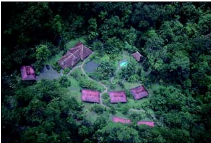
Abb. 3: Die Esquinas Rainforest Lodge liegt direkt am Rande des „Regenwaldes der Österreicher“ und bietet für den Naturtouristen ideale Möglichkeiten für Regenwalderkundungen.

Gewinne der Lodge werden an die lokale Bevölkerung La Gambas ausgeschüttet und für soziale Projekte (Arztpraxis, Schule etc.) verwendet.