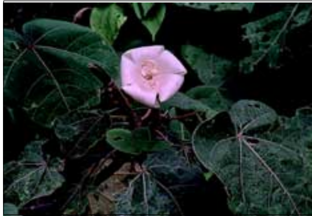
Abb. 34: Die robust gebauten Blüten des Balsaholzbaumes werden von Fledermäusen bestäubt.

Wird die eigentliche Vegetation durch Menschenhand beeinträchtigt oder zerstört, so etabliert sich alsbald eine Sekundärvegetation. In den ersten Phasen sind dies vorwiegend Gräser sowie Farne der Gattung Dicranopteris (Gleicheniaceae), die im Weiteren von robusten und Licht liebenden Riesenkräutern wie Heliconien und Calatheen abgelöst werden. Darauf folgend entwickelt sich eine artenarme Baumflora. Diese Pionierarten benötigen für ihre Keimung viel Licht und zeigen enorme Wuchsleistung. Ein auf dem Gelände der Tropenstation gepflanztes Exemplar des Ameisenbaumes Cecropia aus der Familie der Maulbeergewächse erreichte innerhalb eines Jahres eine Höhe von über 5 m.