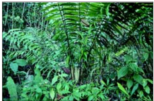
Abb. 20: Der Palmfarn Zamia fairchildiana kommt im Gebiet um den Golfo Dulce vorwiegend in Kammlagen und entlang von Wasserfällen vor. Diese Pflanze kann als „lebendes Fossil“ bezeichnet werden, da ihre nächsten Verwandten bereits im Mesozoikum existierten.