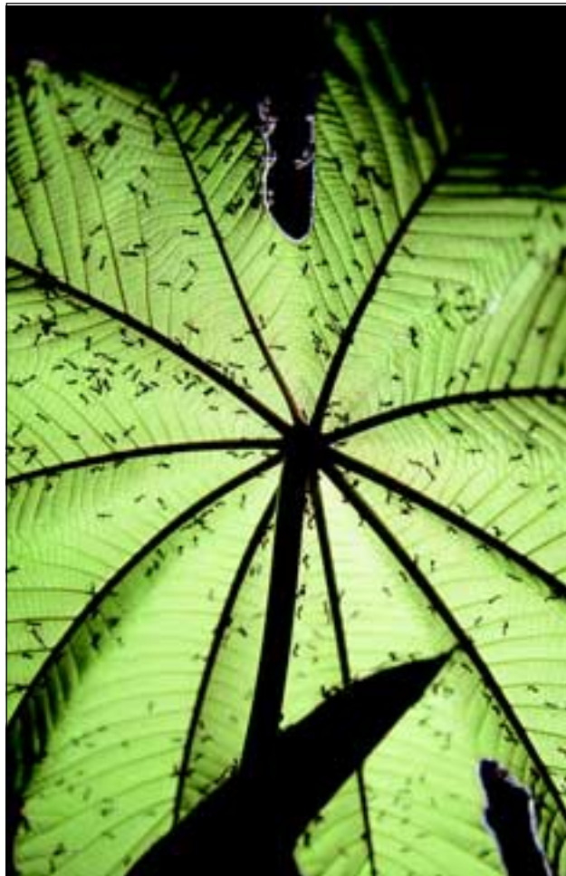
Abb. 35: Viele Pflanzen des offenen Geländes gehen enge Symbiosen mit Ameisen ein. Der Ameisenbaum Cecropia bietet den Ameisen Lebensraum und Nahrung. Als Gegenleistung verteidigen diese die Wirtspflanze und attackieren grundsätzlich alles, was der Pflanze Schaden zufügen könnte.

Befindet man sich im Sekundärwald, so stößt man immer wieder auf einen sehr markanten Baum mit gelappten bis herzförmigen Blättern und auffallend weißen, sehr robust gebauten Blüten, die von Fledermäusen besucht werden. Es handelt sich um den Balsaholzbaum aus der Familie der Bombacaceae (Abb. 34). Das Holz dieses Baumes ist, wie für Pionierarten typisch, sehr leicht und wird auf vielfache Weise genutzt (Innenschalungen, Dämmmaterial in Flugzeugen, Modellflugzeugbau). Die Einheimischen machen sich die leichte Bearbeitbarkeit ebenfalls zunutze und verwenden das Holz für kunsthandwerkliche Gegenstände oder für den Bau von Einbäumen.