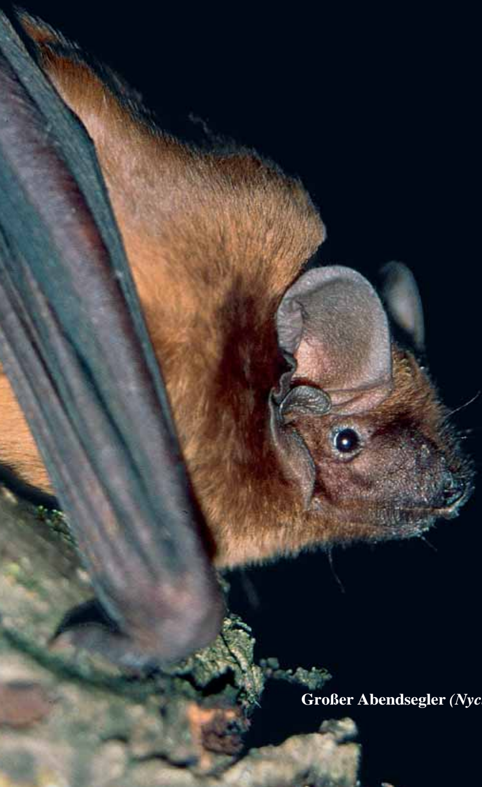
Großer Abendsegler ( Nyctalus noctula )