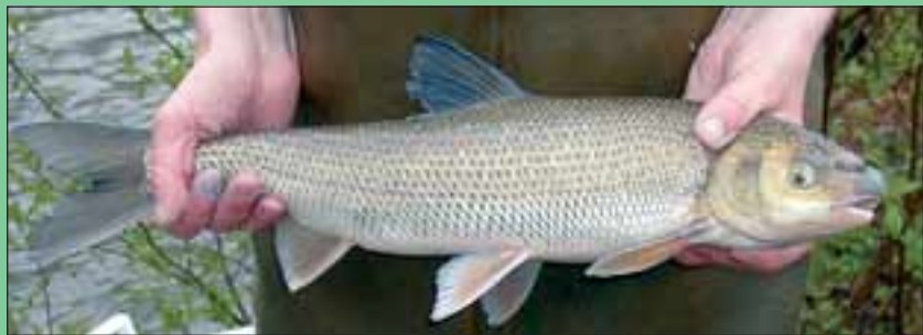
Abb. 11: Männlicher Perlfisch aus dem Attersee während der Laichzeit.

Über den bevorzugten Aufenthaltsort in den Seen fehlen gesicherte Informationen. Von den Berufsfischern auf dem Mond- und