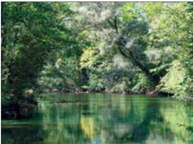
Abb. 3: Naturnah erhaltener Bereich der Seeache.