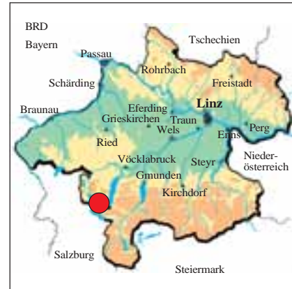
Abb. 1: Lage des Untersuchungsgebietes in Oberösterreich

Die knapp 3 km lange Seeache bildet einerseits die Verbindung zwischen dem Mondsee und dem Attersee im oberösterreichisch-salzburgischen Salzkammergut und andererseits die Grenze zwischen diesen beiden Bundesländern (Abb. 1 und 2). Auf oberösterreichischer Seite, am Nordufer, grenzt die Gemeinde Unterach am Attersee an die Seeache und auf salzburgischer Seite im Süden die Gemeinde St. Gilgen.