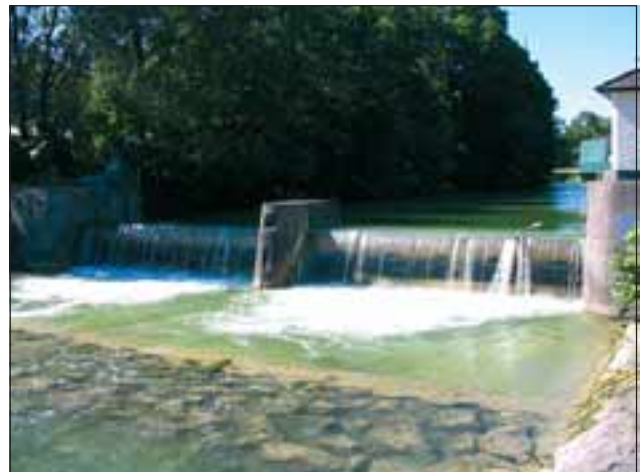
Abb. 4: Klauswehr zu Regulierung des Seespiegels des Mondsees

GRAPHISCHES ZENTRALBÜRO 2003). Die durchschnittlich kältesten Monate sind mit Temperaturen zwischen 2,8-3,5 °C Jänner, Februar und März, maximale Werte zwischen 19 °C und 20,9 °C werden im Juni, Juli und August erreicht. Der Abfluss der Seeache wird durch die Seespiegelregulierung am Klauswehr künstlich geregelt und ist von der Höhe des Wasserspiegels des Mondsees abhängig (Abb. 4).