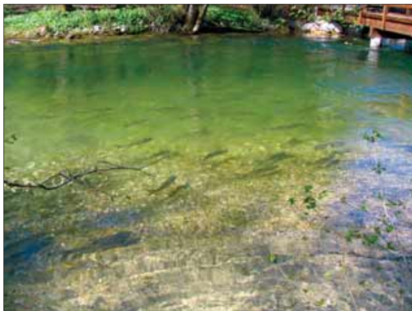
Abb. 10: In die Seeache einwandernde Perlfische.

Die Perlfische hielten sich in der gesamten Seeache mehr oder weniger gleichmäßig verteilt auf. In tieferen Strecken bis zu 1,5 m Wassertiefe und verhältnismäßig geringer Strömung fanden sich die Fische offensichtlich zur Erholung in Gruppen zusammen. Auf flachen, gut durchströmten Kiesbänken bis circa 0,5 m Wassertiefe waren hingegen Revierkämpfe der Männchen und Paarungsspiele zu beobachten (Abb. 10).