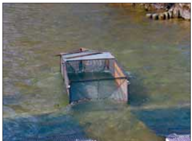
Abb. 6: In diesem Reusenkasten wurden die stromaufwärts schwimmenden Fische gefangen. Zum besseren Blick in die Konstruktion wurde der Deckel abgenommen, außerdem sind die Abweiszäune zwischen Reusenkasten und eigentlichem Fischwehr entfernt worden.