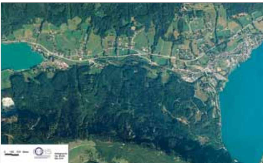
Abb. 2: Die Seeache verbindet den Mondsee (links) mit dem Attersee (rechts).

Temperatur und Wasserstand der Seeache sind sehr stark vom Mondsee beeinflusst, von dessen Oberflächenabfluss sie im Wesentlichen gebildet wird. Seit Beginn der Aufzeichnungen Ende der 70er-Jahre wurden Temperaturen zwischen minimal 0 °C und maximal 26,5 °C gemessen (HYDRO-