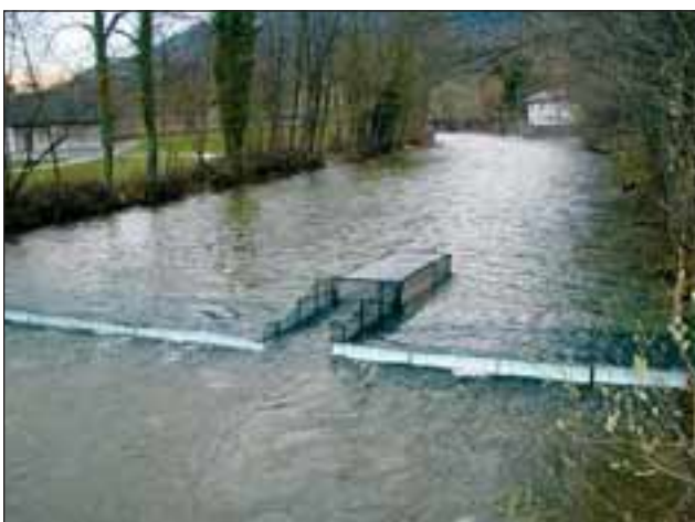
Abb. 5: Das dynamische Fischwehr mit integriertem Reusenkasten, in dem im Frühjahr 2004 in die Seeache einwandernde Perlfische gefangen wurden.

Zur Absperrung des Gewässerquerschnittes dienten im Wesentlichen aus PVC-Rohren zusammengesetzte