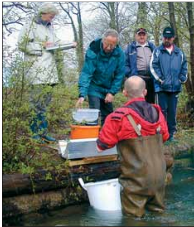
Abb. 7: Die lokale Bevölkerung und Urlauber am Campingplatz in Unterach zeigten großes Interesse für die Untersuchung und waren oft bei der Reusenleerung behilflich.

Während der neunwöchigen Reusenuntersuchung wurden neben den Perlfischen noch 17 Fischarten nachgewiesen, die sechs Familien zugeteilt werden. Auch Kreuzungen zwischen verschiedenen Cypriniden-Familien, und ein Tigerfisch, der aus der Kreuzung von Bachforelle und Bach-