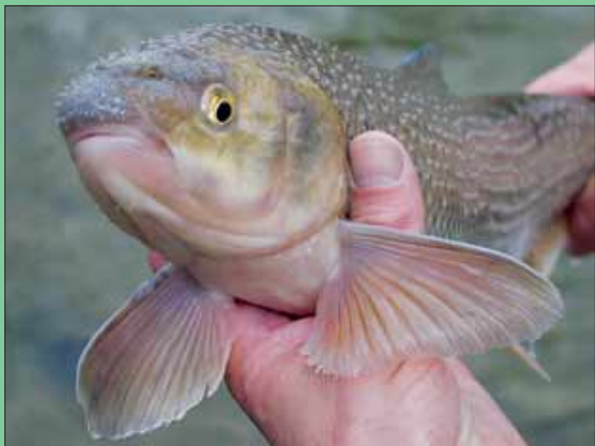
Abb. 12: Perlfischmännchen mit typischem Laichauschlag.

Über das Nahrungsspektrum des Perlfisches werden in der Literatur wenige Angaben gemacht. Die meisten Autoren nennen Mollusken, Würmer, Insektenlarven, kleine Fische und Pflanzen als Nahrung, genaue wissenschaftliche Untersuchungen fehlen jedoch.