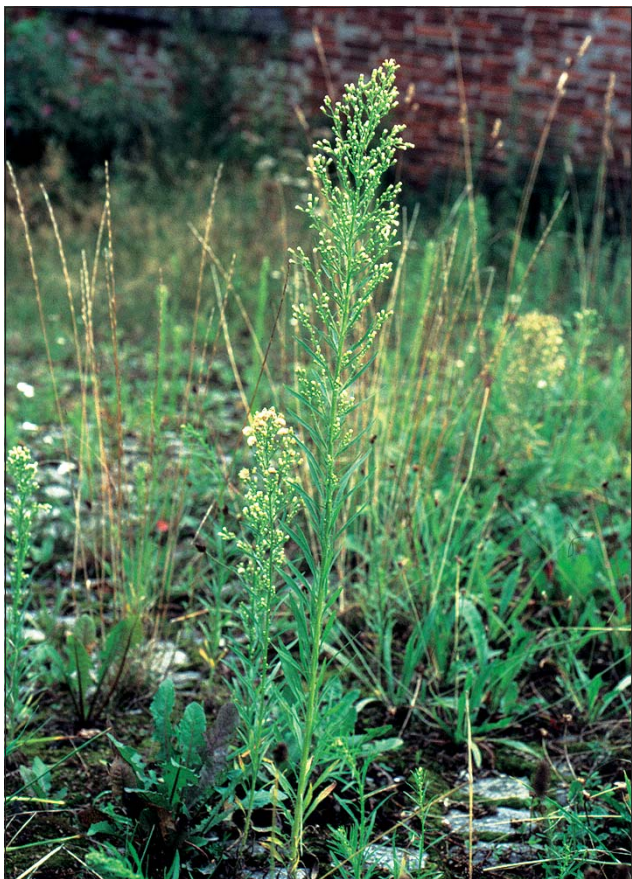
Abb. 11: Das allgegenwärtige Kanada-Berufkraut ( Conyza canadensis ).

mille ( Matricaria discoidea , Abb. 13), der Persien-Ehrenpreis ( Veronica persica , Abb. 16), das Klein-Springkraut ( Impatiens parviflora , Abb. 14) und das Kleinkorb-Franzosenkraut ( Galinsoga parviflora , Abb. 12).