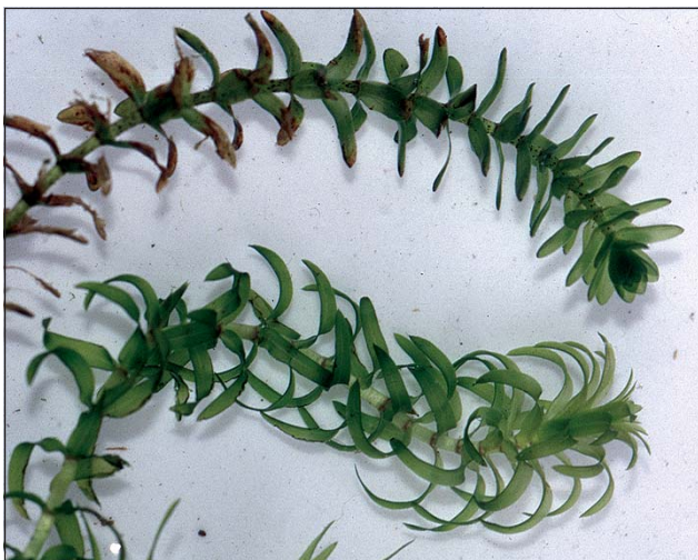
Abb. 15: Die Kanadische Wasserpest ( Elodea canadensis , oben) - im Gegensatz zur Nuttall-Wasserpest ( Elodea nuttallii , unten), die nun immer häufiger in Oberösterreich gefunden wird (vgl. z. B. HOHLA u. a. 2005).