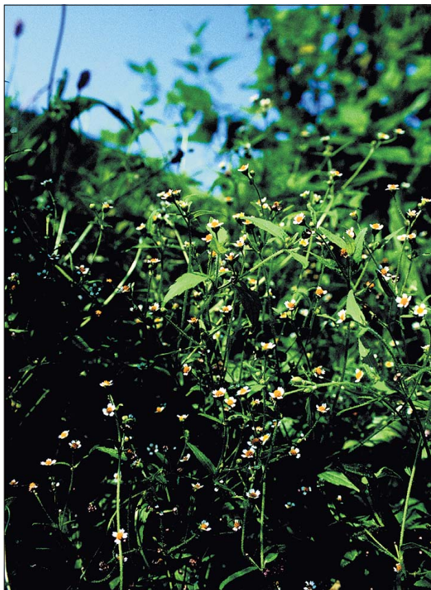
Abb. 12: Das Kleinkorb-Franzosenkraut ( Galinsoga parviflora ) - aus bisher nicht bekannten Gründen in den letzten Jahrzehnten bei uns wieder seltener geworden.

Das Kleinkorb-Franzosenkraut ( Galinsoga parviflora , Abb. 12) stammt aus den Anden Südamerikas und ist um 1800 aus dem Botanischen Garten Paris verwildert. Der unschein-