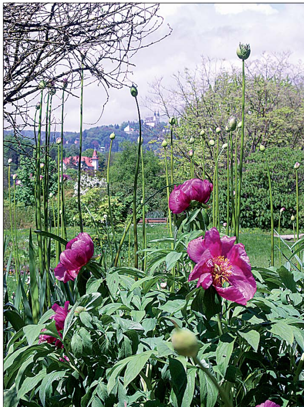
Abb. 1: Blütenpracht im Botanischen Garten - mit dem Linzer Wahrzeichen - dem Pöstlingberg - im Hintergrund.

Die Sammelleidenschaft der Betreiber früherer Botanischer Gärten war nicht immer nur Ausdruck reiner