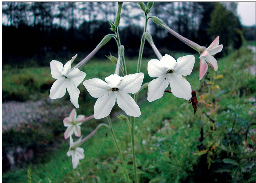
Abb 19: Der Langsdorf-Ziertabak ( Nicotiana langsdorfii ) - eine selten verwildernde Art - hier einzelne Pflanzen auf dem Hochwasserdamm bei St. Peter am Hart (Innviertel).

Nach wie vor verwildern zwar regelmäßig Pflanzen aus gärtnerischen Anlagen. Heute sind es aber die unzähligen privaten Gärten, die Ausgangspunkte dieser „Fluchten“ bilden. Sei es durch das Ausbringen von Gartenabfällen in nahe Wiesen, Wälder, Böschungen und Schottergruben, das Auflassen von Gärten