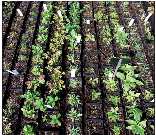
Abb. 7 und 8: Die Betreuung der Kulturen von Otto Hennerbichler bedeutet aufwändige Handarbeit!

Genbank für alte Tafelobstsorten auf dem Freinberg (F. Schwarz, E-Mail).