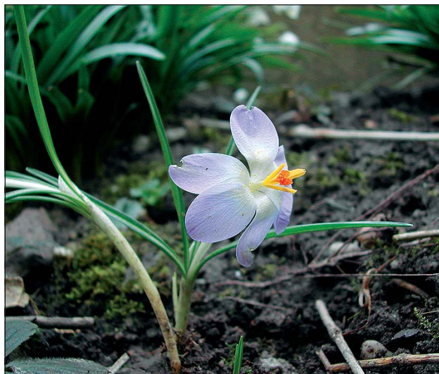
Abb. 18: Der leicht verwildernde Elfen-Krokus ( Crocus tomasianus ) - hier auf einer bewaldeten Terrassenböschung bei Suben (Innviertel).