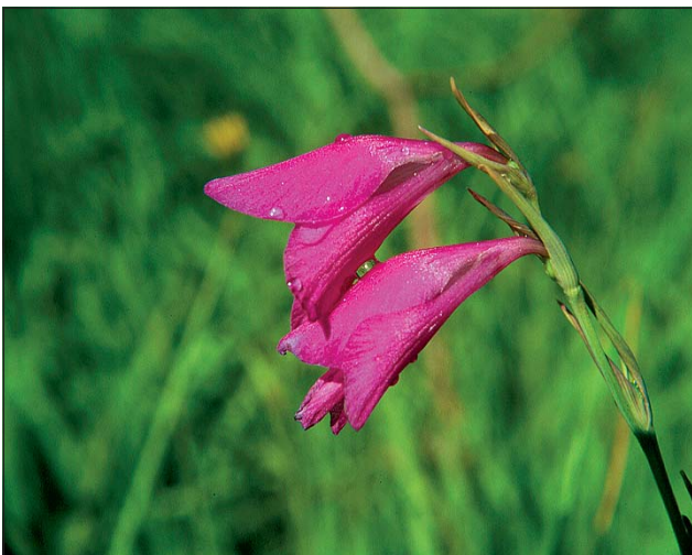
Abb. 5: Die Sumpfsiegwurz ( Gladiolus palustris ) - in Oberösterreich vom Aussterben bedroht (STRAUCH 1997)

Auch der Botanische Garten der Stadt Linz stellt seine Dienste dem Schutz der Artenvielfalt zur Verfügung (SCHWARZ 2005). Die Internationale Organisation für Sukkulentenforschung (IOS) erklärte diesen Botanischen Garten bereits 1963 zu einem Träger einer Schutz- und Typpflanzen-Sammlung für Kakteen (Abb. 3 u. 4). Zu den weiteren bedeutenden Sammlungen zählen zum Beispiel die Frauenschuh-Sammlung (eine der größten Europas), die Tillandsien (teilweise wissenschaftlich noch un bearbeitet), die Insectivoren (Fleisch fressende Pflanzen), die Kamelien (ca. 240 Sorten, vor allem alte Züchtungen), Rosen (teilweise sehr alte, kaum mehr erhältliche Sorten) und eine Obstbaumerhaltungskultur mit