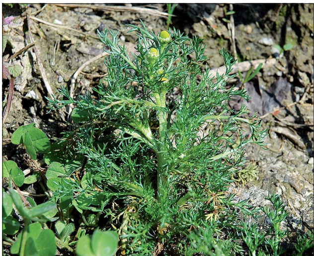
Abb. 13: Die Knopf-Kamille ( Matricaria discoidea ) aus Sibirien und Nordamerika - heute ein fixer Bestandteil unserer Flora.