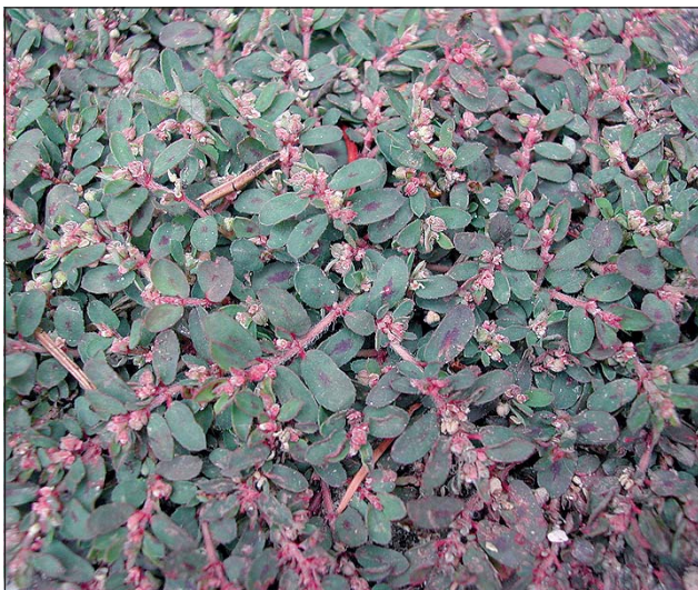
Abb. 17: Die Flecken-Wolfsmilch ( Euphorbia maculata ) - eine Amerikanerin mit Vorliebe für Friedhöfe und Gärtnereien.

Ein Beikraut auf den meisten unserer Äcker ist der Persien-Ehrenpreis ( Ve-