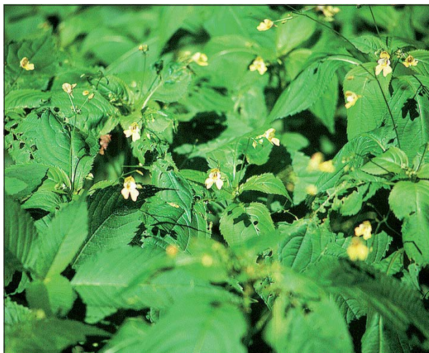
Abb. 14: Das Klein-Springkraut ( Impatiens parviflora ) - kaum zu glauben, dass diese vertraute Pflanze ein Neubürger ist.