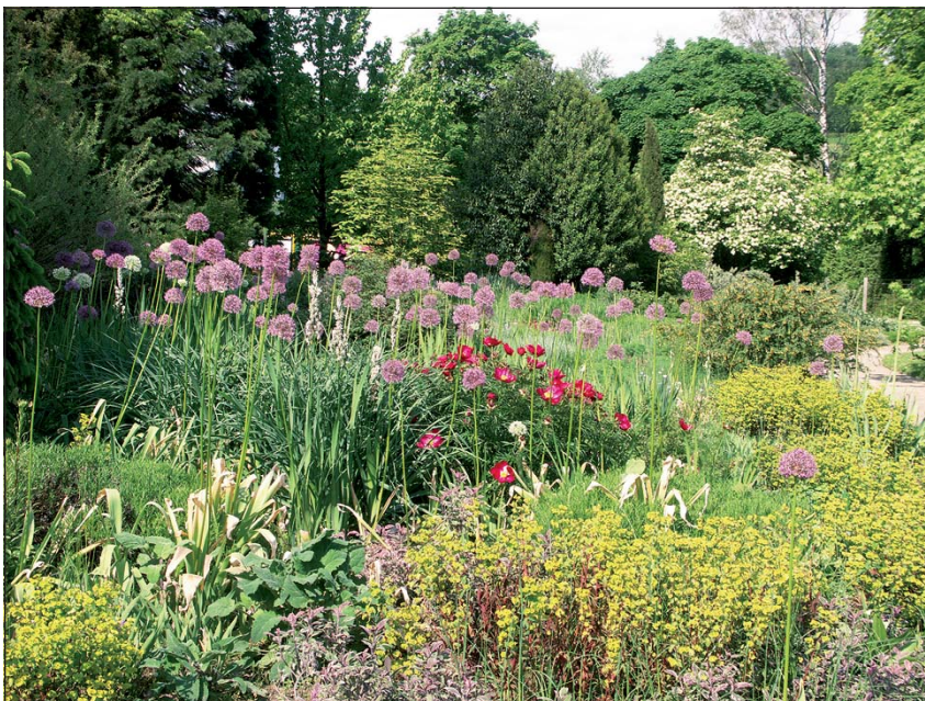
Abb. 2: Der Botanische Garten Linz - nicht nur thematisch sondern auch farblich vielfältig!

Botanische Gärten in Österreich sind sehr unterschiedlich strukturiert und finanziert. Es gibt Universitätsgärten, Gärten in der Trägerschaft von Bund, Ländern und Gemeinden sowie privat finanzierte Botanische Gärten. Die Gärten unterscheiden sich nicht nur in Struktur und Finanzierung, sondern auch in der personellen Ausstattung und ihren konkreten Zielsetzungen. Da es jedoch ein breites Feld von gemeinsamen Interessen und Aufgaben gibt, haben sich 1998 die Botanischen Gärten Österreichs in einer Arbeitsgemeinschaft zusammengeschlossen. Zu deren Aufgaben zählen zum Beispiel die Schaffung eines Forums für den Austausch von Erfahrungen und die Verbesserung der Kommunikation zwischen den Gärten, die Planung und Koordination von gemeinsam zu bewältigenden Aufgaben, die Schaffung einer gemeinsamen Vertretung der Botanischen Gärten Österreichs nach außen sowie die Mitgestaltung und Umsetzung von internationalen Programmen zu Arten- und Naturschutz usw. (KIEHN s. d.).