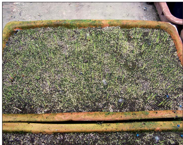
Abb. 6: Aufkeimende Hoffnung - Erhaltungskultur von Gladiolus palustris .