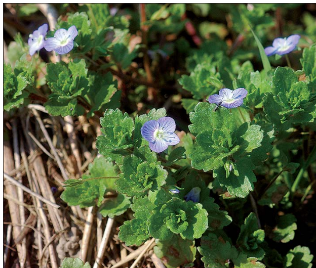
Abb. 16: Der Persien-Ehrenpreis ( Veronica persica ) - heute auf beinahe jedem Acker in unserem Bundesland zu finden.

bare Korbblütler breitete sich innerhalb weniger Jahrzehnte explosionsartig als Ackerbeikraut in ganz Europa aus: Es wurde erstmals 1798 in Bremen, 1812 in Berlin, 1821 in Erlangen und 1853 in Münster dokumentiert. Bereits 1860 war das Kleinkorb-Franzosenkraut in ganz Norddeutschland ein „lästiges Unkraut“, sodass 1890 in Braunschweig sogar eine Polizeiverordnung zur Bekämpfung des „Fremdlings“ erlassen wurde. Der Name Franzosenkraut soll sich auf den Vormarsch der französischen Truppen unter Napoleon von Paris nach Osten zu Beginn des 19. Jahrhunderts beziehen, der lediglich zeitgleich mit der Ostwanderung der Pflanze stattfand (LAUERER 2004). ROHRHOFER (1942) nennt diese und die zuvor genannte Art unter den