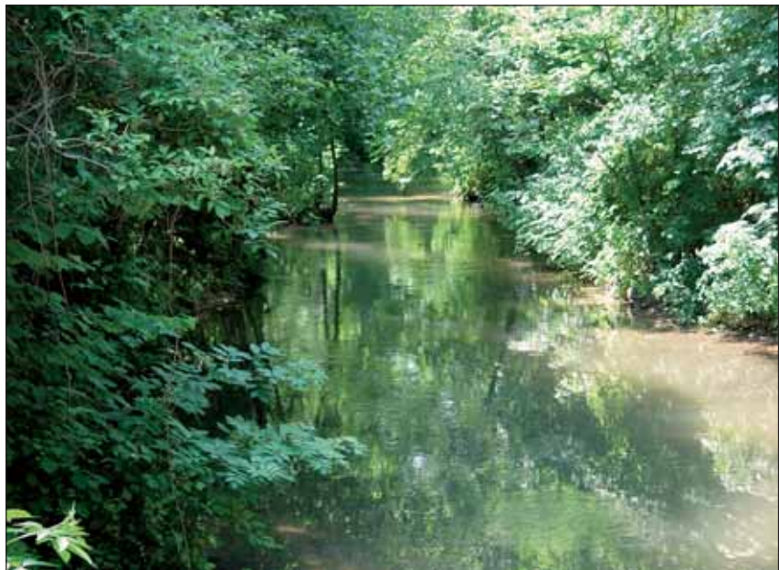
Abb. 16: Idyllisch fließt der Weidingerbach auf einer Länge von 4,5 km zwischen den Stadtteilen Kleinmünchen im Norden und Auwiesen im Süden. Ein dichter Saum aus Auwaldgehölzen macht ihn zu einem hochwertigen Grünelement im dicht verbauten Süden der Stadt.

schon frühzeitig als Mühlbach genutzt, später auch als Energielieferant für Industriebetriebe. Die Linzer Tuchfabrik „Himmelreich & Zwicker“, die 1672 als „Wollzeugfabrik“ gegründet wurde oder die Textilfabrik (heute Linz Textil) sind herausragende Beispiele. Um die Nutzbarkeit zu