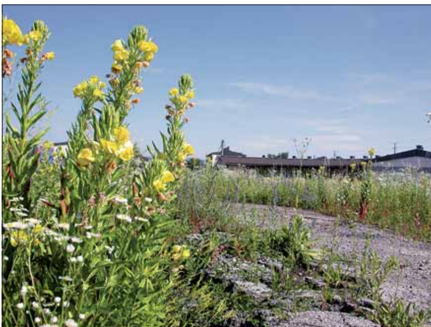
Abb. 2: Auf den Schotter- und Schlackeböden des ehemaligen Verschubgeländes der ÖBB (Österreichische Bundesbahnen) existiert eine beachtliche Artenvielfalt, darunter viele Neophyten und auch botanische Raritäten. Im Bild die Nachtkerze (gelb) und das Berufkraut (weiß), beide aus Nordamerika stammend.