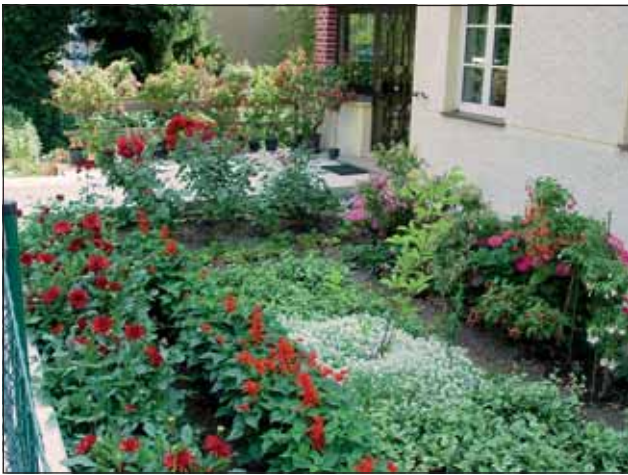
Abb. 8: Die Häuser am Hausleitnerweg sind von netten Gärten umgeben, wie zum Beispiel dieser liebevoll mit Dahlien, Fuchsien und Rosen gestaltete Vorgarten.

nannte „Hochterrasse“ aus der Riß-Eiszeit, der zweitältesten Kaltzeit, die vor rund 130 000 Jahren endete. Riesige Schottermassen müssen da durch die Traun antransportiert worden sein! Durchschnittlich 14 m ist das Schotterpaket dick, das überlagert wird von einer bis zu 10 Meter mächtigen Lössauflage. Die Riß-Hochterrasse wird auch als „Harter Plateau“ bezeichnet (benannt nach der Ortschaft Hart in der Gemeinde Leonding), eine weitläufige, ebene bis leicht wellige reliefierte Landschaft, die großteils verbaut ist (Stadtteil Bindermichl, Spallerhof, Oed) und im Linzer Stadtgebiet bei diesem Steilabfall endet. 8 bis 10 m beträgt der Höhenunterschied zur darunter liegenden „Niederterrasse“, die von der letzten Eiszeit, der Würm-Kaltzeit, stammt.