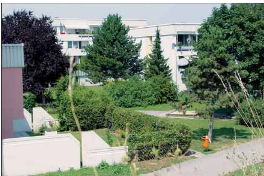
Abb. 18: Der Stadtteil Auwiesen, eines der größten Stadterweiterungsprojekte der 1980er- und 90er-Jahre. Die Bepflanzung der Gärten und öffentlichen Flächen hat sich entsprechend entwickelt. Der hohe Anteil an Koniferen (Fichten und Föhren) spiegelt den damaligen Trend wider.