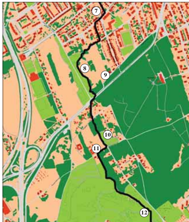
Abb. 7: Wanderung vom ehemaligen Frachtenbahnhof über den Wasserwald Scharlinz nach Auwiesen. 7 - „Eisenbahnersiedlung“ an der Spaunstraße, 8 - Wasserwald Scharlinz, 9 - Gasthaus „Bratwurstglöcklerl“ im Wasserwald, 10 - Seniorengarten im Wasserwald, 11 - Bauernhof an der Brunnenfeldstraße, 12 - naturnaher Laubmischwald im Wasserwald,