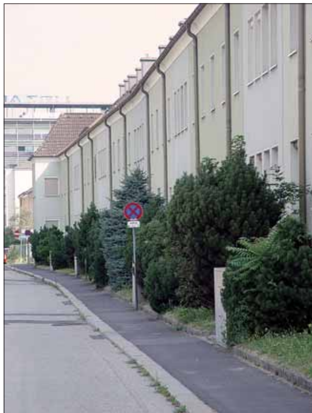
Abb. 4: Vorgärten in der Strachgasse. Zwar gut gemeint, aber ökologisch wenig sinnvoll: Für den schmalen Bepflanzungsstreifen werden diese Koniferen zu groß, sie beschatten das ganze Jahr über die Wohnungen und bieten wenig Tierarten Nahrung. Besser wären Blütenstauden oder kleinbleibende Sträucher.

Gleich am Ende der Häuserreihe bemerken wir eine künstlich bepflanzte Gehölzfläche (3 - Abb. 5) mit Birken, Föhren und Eschen. Im Frühling und Sommer können wir dem Gesang von Kohlmeise, Mönchsgrasmücke, Kleiber und Amsel lauschen. Wir rätseln über den Zweck dieser Bepflanzung. Als Parkanlage kann sie wohl nicht dienen, dazu fehlt ihr die Ausstattung. Als Wald würden wir sie auch nicht betrachten, weil der Unterwuchs regelmäßig gemäht wird. Sei es wie es sei, wir lassen sie „links liegen“ und gelangen nun zur Turmstraße, wo wir rechts abzweigen. Wenige Schritte