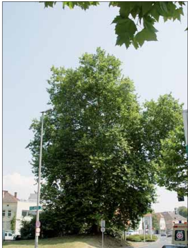
Abb. 15: Diese unter Naturschutz stehende Platanengruppe steht direkt an der Dauphinestraße und war früher Teil eines ehemaligen Herrschaftsgartens.

Wir biegen rechts in die grüne, von Bäumen gesäumte Karl-Steiger-Straße ein und spazieren zwischen Eschen und Bergahornen. Nach der ASKÖ-Sportanlage dreht unsere Route nach links. Uns fällt zuerst eine Parkan-