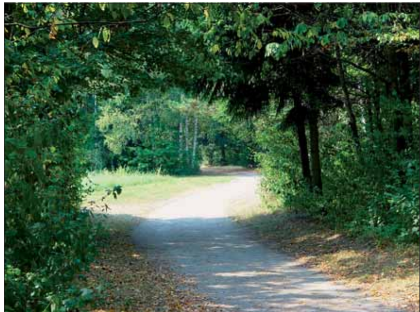
Abb. 10: Der Wasserwald Scharlinz gehört zu den größten zusammenhängenden innerstädtischen Grünflächen und ist ein beliebtes Naherholungsgebiet für die Bevölkerung des Linzer Südens. Mit seiner naturnahen Zusammensetzung bietet er auch Lebensraum für viele Pflanzen- und Tierarten, darunter auch einige seltene.

große Wasserschutzgebiet bereits kennengelernt. Es umfasst Waldbestände und ausgedehnte Wiesenflächen, die zu einem großen Teil als Erholungsgebiet öffentlich zugänglich sind. Mit naturnaher Begrünung des Parks erreicht man eine gute Durchwurzelung des Schotterbodens. So können Stickstoffverbindungen und andere Schadstoffe, die für die Wasserqualität abträglich wären, aus dem Boden gefiltert werden, bevor sie ins Grundwasser gelangen. Zwar werden Gehölzflächen, Wiesen und Felder des Wasserwaldes landwirtschaftlich genutzt, aber nur auf extensive Weise. Unter anderem verbieten Auflagen des Wasserschutzes die Verwendung von Düngemitteln.