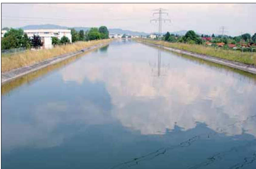
Abb. 19: Der Oberwasserkanal des Kraftwerks Kleinmünchen, auch genannt Jaukerbach, ist ein abschreckendes Beispiel des technokratischen Wasserbaustils der 1970er-Jahre: Eine aus der Landschaft herausgehobene, betonierte Wasserrinne, völlig struktur- und gesichtslos, die lediglich dazu dient, das Traunwasser der Turbine zuzuleiten.