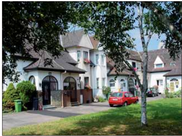
Abb. 9: Die so genannte Eisenbahnersiedlung, erbaut in den 1920er-Jahren, ist ein architektonisches Juwel, das sich mitten im Siedlungsgebiet verbirgt.

Nach diesem erdgeschichtlichen Ausflug wenden wir uns wieder der Jetztzeit zu. Zwischen der Gluckstraße und der Senefelderstraße fallen uns lauschige Gärten (6 - Abb. 8) mit einem hohen Durchgrünungsgrad auf, wo Linden und Platanen gedeihen. Beim Pfaffingerweg verlassen wir den Hausleitnerweg und gehen links zur Spaunstraße hinunter. Dort entdecken wir ein architektonisches Kleinod: Die 1922 erbaute Eisenbahnersiedlung (7 - Abb. 9) . Die kleinräumig ineinander verschachtelten Häuser mit Erkern, Gaupen und Vorbauten umgeben einen U-förmigen, begrünten Platz. Diese Art von Sozialwohnbauten ist für die 20er-Jahre typisch. Damals, in der Zeit nach dem Ersten Weltkrieg, herrschte große Wohnknappheit. Sie wurde dadurch verstärkt, dass immer mehr Menschen in die Stadt strömten, weil sie dort Arbeit fanden. In den 30er-Jahren wurde der Bau von Stadtrandsiedlungen erheblich einge-