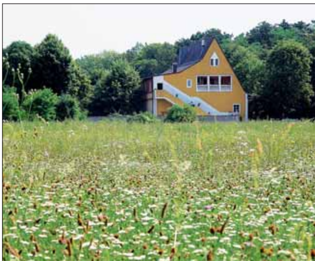
Abb. 11: Umgeben von Wiesen und Wald liegt das Traditionsgasthaus „Bratwurstglöcklerl“ mitten im Wasserwald.

Die kleinräumige Verzahnung von Wäldern und Wiesen wirkt sich sehr positiv für viele Pflanzen und Tiere aus. Unter den 326 Blütenpflanzen, Nadelgehölzen und Farnen, die hier vorkommen, befinden sich 14 Spezies, die österreichweit vom Aussterben bedroht sind.