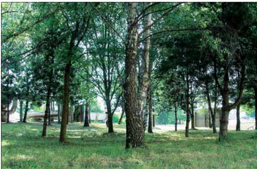
Abb. 5: Gehölzfläche an der Turmstraße. Birken, Schwarzföhren und einige Eschen bilden den Bestand, der zwar zur Auflockerung des Stadtbildes beiträgt, sonst aber nicht viel hergibt. Mit liebevollere Gestaltung und artenreicherer Bepflanzung wäre wesentlich mehr für die Natur und die Erholungseignung für die Menschen herauszuholen.

(auch Chicorée oder Radicchio) findet immer mehr Verbreitung als Wintergemüse. Hier zeigt sich auch die enge Verwandtschaft der Wegwarte mit der Endivie ( Cichorium endivia ). Allerdings sind die grünen Blätter sehr bitter, weshalb man sie unter Lichtabschluss wachsen lässt, was ihnen die Bitterkeit nimmt. Auch der Scharfe Mauerpfeffer kommt hier