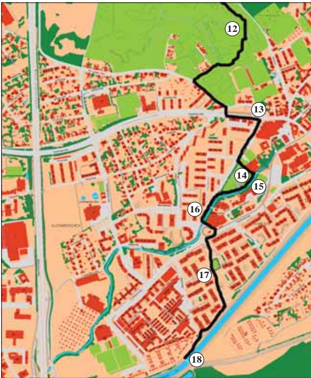
Abb. 14: Wanderung vom ehemaligen Frachtenbahnhof über den Wasserwald Scharlinz nach Auwiesen. 12 - naturnaher Laubmischwald im Wasserwald, 13 - Naturdenkmal Platane an der Dauphinestraße, 14 - Parkanlage an der Karl-Steiger-Straße, 15 - Weidingerbach, 16 - Nisthilfen für Gebäudebrüter, 17 - Auwiesen, 18 - Oberwasserkanal des Kraftwerkes Kleinmünchen.

von der Naturkundlichen Station regelmäßig ein Krötenzaun aufgestellt, der den Straßentod der wandernden Erdkröten verhindern soll. An ihrem Ende wenden wir uns nach rechts und überqueren die stark befahrene Dauphinestraße mit ihrer langen Platanenallee.