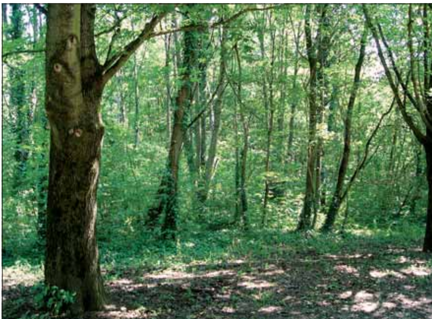
Abb. 13: Sehr naturnah zusammengesetzte Bereiche sind charakteristisch für den Wasserwald. Das dichte Unterholz bietet Nahrung und Versteck für viele Wildtiere, vor allem Vögel, aber auch Rehe, Hasen und Fasane.

Der Weg schlängelt sich sehr abwechslungsreich durch den Park. Bänke laden zur Rast ein, herrlich bunte Blumenwiesen säumen den Weg, naturnahe Waldbestände (12 - Abb. 13) dominieren das Landschaftsbild. Kurz vor einigen Häusern, die sich im südlichen Teil des Parkes direkt im Wald befinden (unmittelbar nach einer blauen Säule) lenken wir unsere Schritte nach links, passieren einige ältere Einfamilienhäuser und gelangen schließlich zur Straße „Am langen Zaun“, der wir linker Hand folgen. Sie führt direkt am südseitigen Rand des Wasserwaldes entlang. Im Frühling wird hier