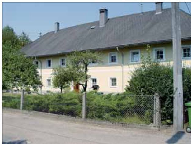
Abb. 12: Auch überraschend: Mitten im Wasserwald gibt es typische Traunviertler Vierkanthöfe. Die landwirtschaftlichen Gründe, vorwiegend Wiesen, werden von den Bauern extensiv bewirtschaftet.

Wir wandern geradeaus auf der Purschkastraße weiter in den Wasserwald, vorbei an einem Seniengarten (10) . Hier sind Ballspielen