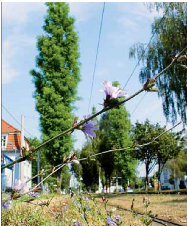
Abb. 6: Die Straßenbahngleisanlage an der Wienerstraße ist nicht asphaltiert, sondern mit nährstoffarmer Erde versehen - und deswegen nicht uninteressant. Im zeitigen Frühling kann man hier in Massen den gar nicht so häufigen Dreifinger-Steinbrech sehen, im Hochsommer - wie hier auf dem Foto - die Wegwarte.

Nun gabelt sich die Straße und wir wählen den links abzweigenden Hausleitnerweg. Hier befinden wir uns auf der Oberkante einer markanten Terrasse, die gegen Süden hin abfällt. Dabei handelt sich um eine so ge-