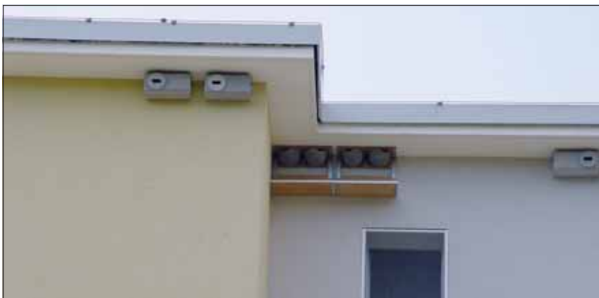
Abb. 17: Unter den Dachvorsprüngen der Wohnbauten an der Karl-Steiger-Straße sind Nisthilfen für Mehlschwalben und Mauersegler angebracht, ein Kooperationsprojekt der Wohnungsgenossenschaft mit der Naturkundlichen Station.