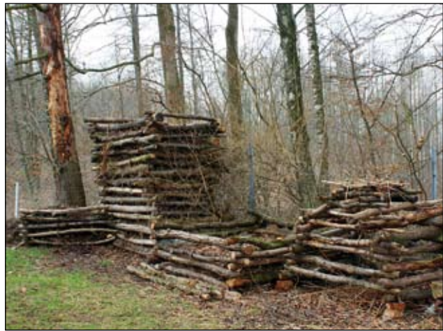
Abb. 30: Käferburgen in verschiedenen Formen und Stadien. Die höchste im Hintergrund darf ruhen, während die vordere befüllt wird und wächst.

Laub und Reisig fallen, vor allem in älteren Gärten, in erheblichen Mengen an. Die weit verbreiteten Alternativen, das organische Material entweder zu einer öffentlichen Sammelstelle zu bringen oder mit einem Häcksler zu zerkleinern, erfordern unnötig viel Energie und Zeit. Schlimmer noch: Sie berauben den Gartenbesitzer wertvoller „Rohstoffe“, mit denen er Nützlinge in den Garten locken und vielen interessanten Gästen aus dem Tierreich einen Wohnort bieten kann (Abb. 29).