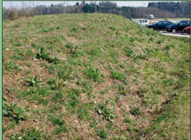
Abb. 23: Im Spätwinter nach der Mahd präsentiert sich der Hügel noch kahl. Aber nicht lange.