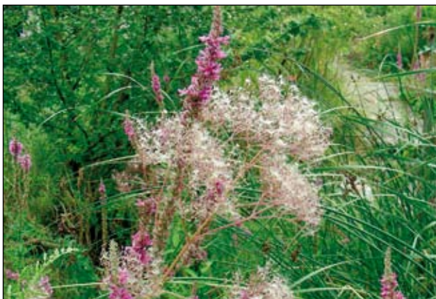
Abb. 27: Blutweiderich ( Lythrum salicaria ) und Baldrian ( Valeriana officinalis ) - hier die Samenstände - sind attraktive Hochstauden für den Wasserwechselbereich.

Wo immer es die Gartengröße zulässt, sollte dieses Element nicht fehlen.