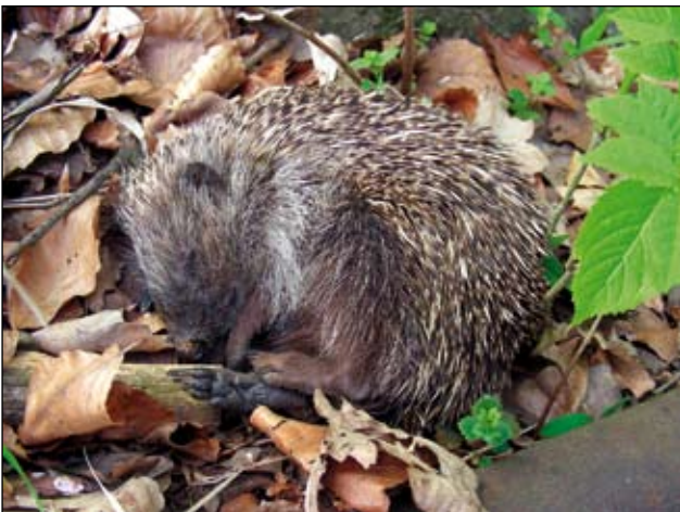
Abb. 36: Noch immer nicht ausgeschlafen? Igel genießt die ersten Sonnenstrahlen nach seinem Winterschlaf.

Mit dem deutschen Verein Naturgarten e.V. bestehen enge Kontakte und ein intensiver Erfahrungsaustausch