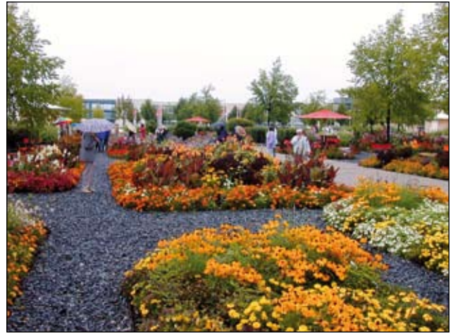
Abb. 4: Blühreichtum um jeden Preis, zu jedem Zeitpunkt und in allen Farbzusammenstellungen. BUGA München 2005.

Was Hard vor mehr als zehn Jahren über die deutschen Städte schrieb, muss heute auch für viele österreichische Städte und zunehmend auch Dörfer im ländlichen Raum konstatiert werden (Abb. 5 und 6). Kugelbuchs aus Norddeutschland neben Schirmplatanen aus der Poebene, Fertigrasen aus dem Tullnerfeld neben