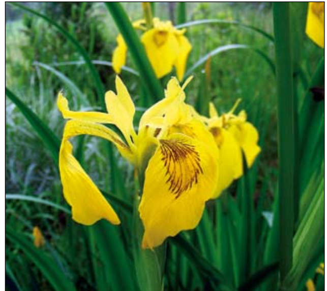
Abb. 26: Sumpf-Schwertlilien ( Iris pseudacorus ) vertragen bis zu 40 cm Wasserstand, gedeihen aber auch am Gewässerrand.

steht. Zu den oben genannten 40 bis 60 Zentimetern für die Wasserretention ist dabei die gewünschte Wassertiefe für den Speicherteich hinzuzurechnen (Abb. 25). Bei einer Grundfläche von 3x3 Metern und 50 Zentimetern Wassertiefe steht ein Speichervolumen von 4,5 Kubikmeter, 4500 Liter oder 450 Gießkannen zur Verfügung.