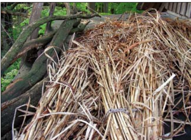
Abb. 31: Material für die Käferburg: Grashalme und Totholz.

In weiterer Folge nützen auch Kleinsäuger wie Igel und Mäuse derartige Strukturen als Zufluchtsort und Jagdrevier (Abb. 35). Für Frösche und Kröten, aber auch für Reptilien sind die kombinierten Strukturen aus Laub und Totholz ein wichtiger Überwinterungsort. Jedes Frühjahr ist die Begegnung mit den ersten Blindschleichen ein beglückendes und immer wieder aufregendes Naturerlebnis (Abb. 35). Nach einigen Jahren kommen auch Vögel an den reichgedeckten Tisch. Kleiber und Zaunkönige sind gerngesehene Gäste, und der Buntspecht leistet ganze