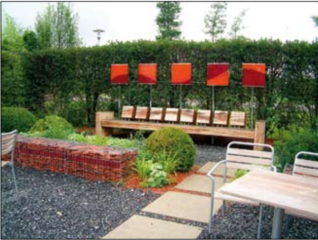
Abb. 3: Eine Vielzahl von Materialien und Formen soll den „moderneren“ Garten beleben. BUGA München 2005