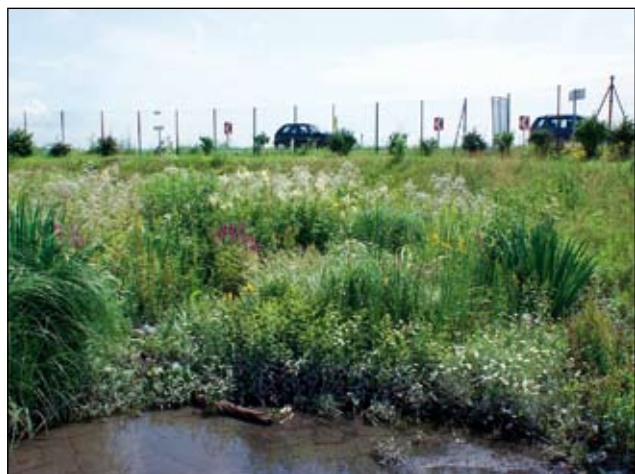
Abb. 9: Dieselbe Mulde, vier Jahre nach der Umgestaltung. Die Hochstaudenflur wird einmal im Jahr gemäht, das Mähgut abtransportiert.