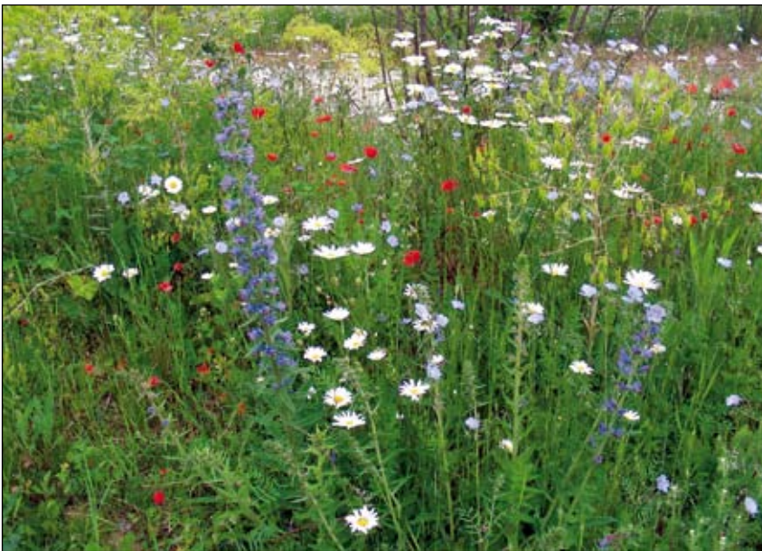
Abb. 17: Stadtgut Steyr 2008. Zweijähriger Natternkopf, daneben Reste des Einjährigen-Aspekts von Lein und Klatschmohn. Margerite und Färberwaid weisen in die Zukunft.