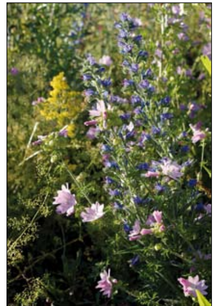
Abb. 18: Platz für zarte und wilde Schönheiten: Malve und Natternkopf, Stadtgut Steyr

und behalten ihre dekorative Wirkung und ihre Funktion als Aufenthalts- und Futterplätze für verschiedene Tierarten bis ins Frühjahr hinein (Abb. 20-23).