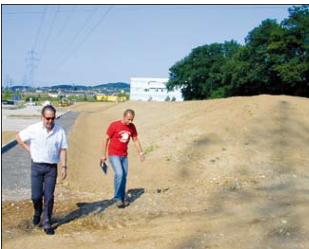
Abb. 15: Stadtgut Steyr 2006: Böschung mit magerem Substrat als Ausgangsmaterial.

Der beste Zeitpunkt für die Ansaat ist der Frühherbst. Die Vegetation macht eine kontinuierliche Entwicklung durch: Sie wird im ersten Jahr von Einjährigen wie Kornrade, Kultur-Lein, Klatschmohn, Kornblume, im zweiten von Zweijährigen, in den Folgejahren von ausdauernden Wildkräutern und Gräsern dominiert (Abb. 16-19). Nach vier bis sechs Jahren geht die Entwicklungsdynamik zurück, das Erscheinungsbild pendelt sich auf eine dem Standort und der Pflege entsprechende Vegetationszusammensetzung ein. Was bleibt, ist ein starker Wechsel des Erscheinungsbildes im Jahresverlauf und in Abhängigkeit von der Witterung. Von April bis August wechselt der Blühaspekt kontinuierlich, ab September entwickelt sich ein Herbstaspekt, der von Gelb- und Brauntönen mit teilweise höchst attraktiven Samenständen geprägt ist (Wilde Karotte, Karde, Flockenblume). Auch bei Frost und Schnee bleiben viele der Fruchtstände stehen