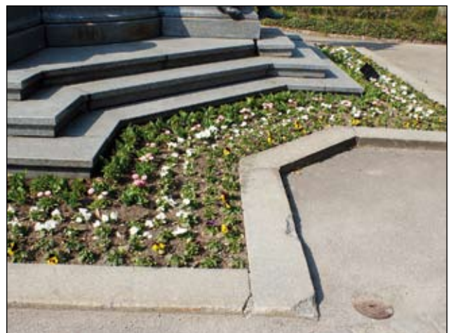
Abb. 6: Wechselflor im öffentlichen Raum verlangt einen hohen Aufwand bei Herstellung und Pflege.