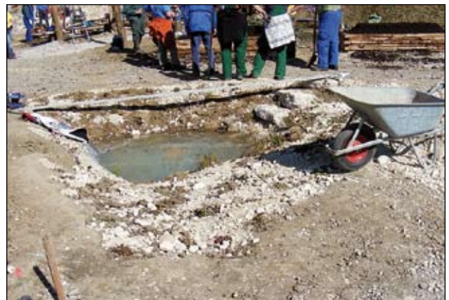
Abb. 28: Bau eines Sicker-Speicher-Teiches bei einer Praxiswerkstätte der Akademie für Umwelt und Natur im Garten des Siedlervereins auf der Landesgartenschau 2011 in Ritzlhof.