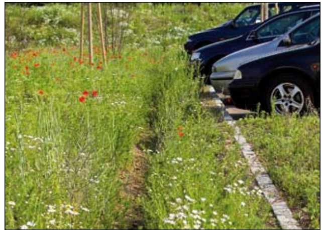
Abb. 11: Ansaat einer Wildblumenmischung in den Sickermulden eines neu errichteten Parkplatzes.