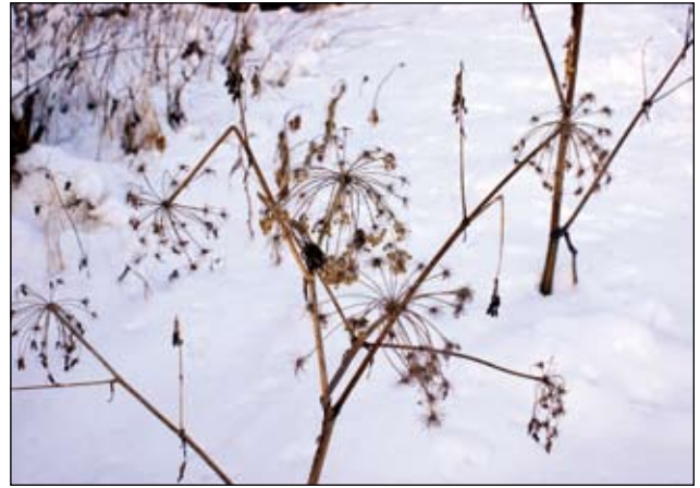
Abb. 34: Die Engelwurz ( Angelica sylvestris )- auch im Spätwinter noch eine Zier des Gartens.

Arbeit, wenn erst einmal das Holz angerottet ist.