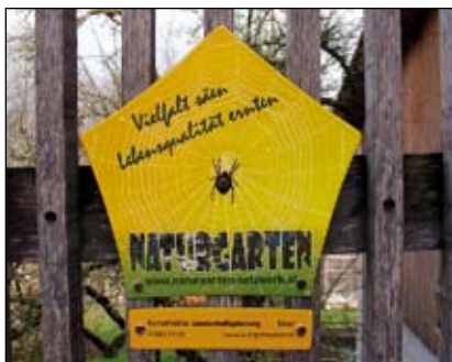
Abb. 39: Plakette „Vielfalt säen - Lebensqualität ernten“ für naturnah gestaltete Lebensräume.

* Mit der Plakette „Vielfalt säen - Lebensqualität ernten“ können Gartenanlagen ausgezeichnet werden, die unter Berücksichtigung der natürlichen Gegebenheiten, aus heimischen natürlichen Materialien und überwiegend mit regionalen Wildpflanzen gestaltet wurden und mit Rücksicht auf Wasser, Klima, Pflanzen, Tiere und Menschen gepflegt werden (Abb. 39).