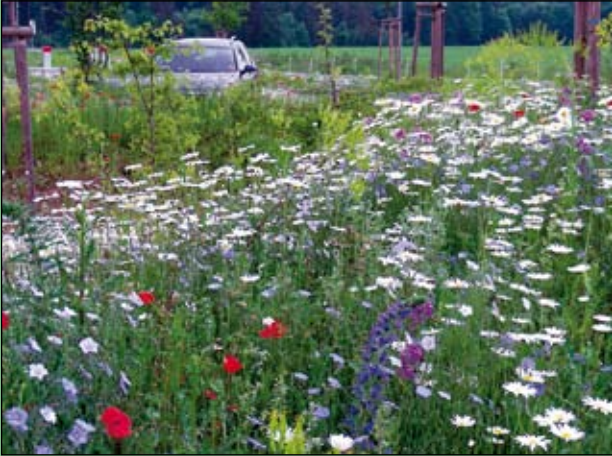
Abb. 20: Im Frühling macht der „Bunte Saum“ seinem Namen alle Ehre: Margeriten, Kornblumen, Lein, Mondviolen, Natternkopf und Färber-Waid drängen sich dicht aneinander.