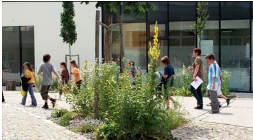
Abb. 7: Heimische Wildpflanzen auf dem Weg zur Schule - eine pflegeleichte und attraktive Alternative. Bunte Mitte Hagenberg

Auf den folgenden Seiten stelle ich exemplarisch einige Gestaltungselemente für verschiedene Einsatzbereiche vor, die in den letzten Jahrzehnten entwickelt wurden und von denen wir überzeugt sind, dass sie Bestandteile der Freiräume von heute und morgen sein können und müssen, wenn wir die Trendwende