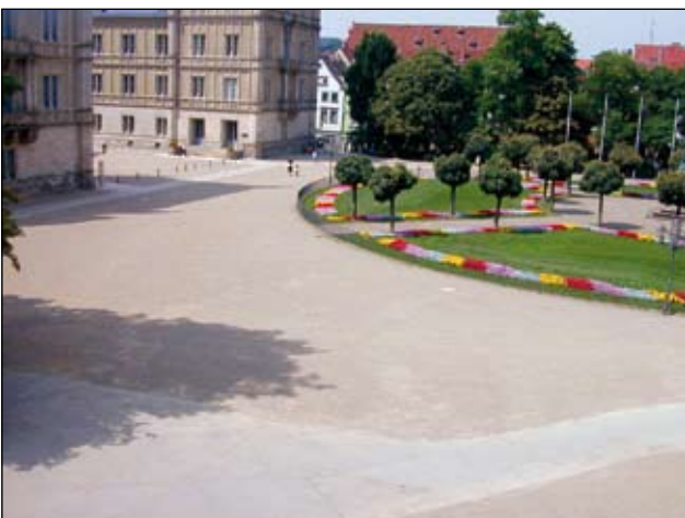
Abb. 5: Kugelrobinien, bunte Blumenbeete und Scherrasen auf einer sonst kahlen Fläche. Ist dieser Platz wirklich einladend?

In der Schweiz, in Deutschland, Holland und Österreich bemüht sich eine Minderheit von Planern, Gestaltungsbetrieben und Pflanzenproduzenten seit mehr als zwanzig Jahren darum, die naturnahe Gestaltung in privaten Gärten und öffentlichen Freiräumen zu etablieren. Was unterscheidet