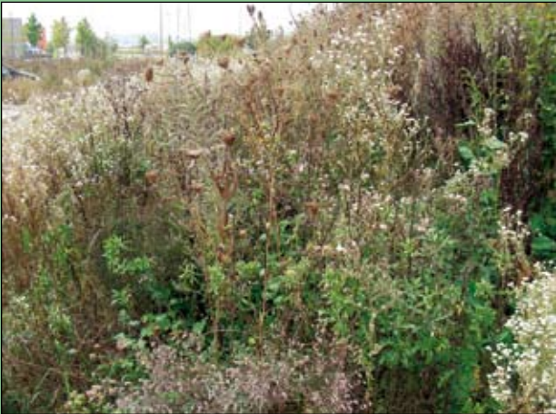
Abb. 22: Im Herbst bieten die hohen Samenstände Rückzugsraum und Futter für viele Tiere. Der Anblick ist für ordnungsliebende Menschen gewöhnungsbedürftig.