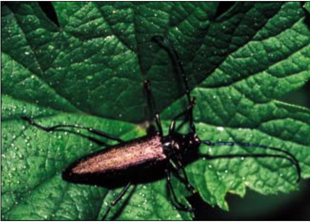
Abb. 33: Der Moschusbock ( Aromia moschata ) bevorzugt große Blütendolden.