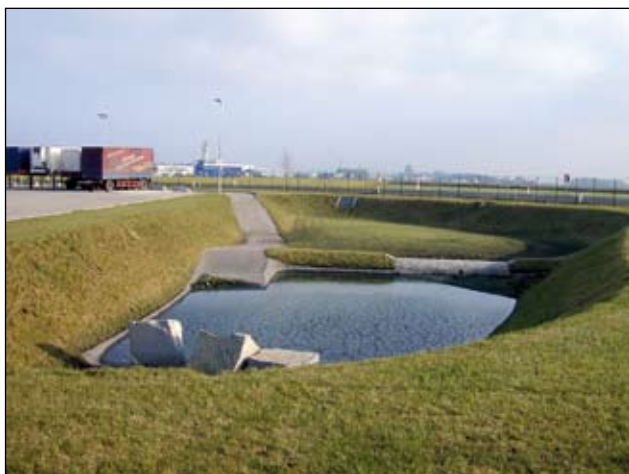
Abb. 8: Sterile Retentionsmulde, die mit beträchtlichem Aufwand immer wieder gemäht werden musste, vor der Umgestaltung.

Als naturnahe, mit den Auflagen konforme Alternative haben wir bei mehreren Objekten mit Erfolg bunte einmündige Blühstreifen und Hochstaudenfluren aus heimischen Kräutern etabliert (Abb. 8 und 9). Dafür eignen sich Polykulturen aus zahlreichen einjährigen, zweijährigen und ausdauernden Gräsern und Kräutern. Als besonders attraktive Arten seien exemplarisch aufgezählt: Klatschmohn, Kornblume, Wilde