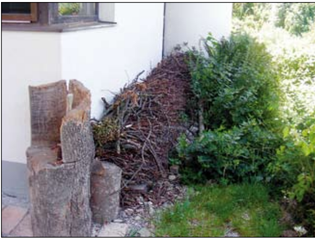
Abb. 29: Auch im kleinen Garten möglich: Astschnitt an der Mauer entlang aufgeschichtet bietet vielen Tieren einen Unterschlupf. Privatgarten Pitschmann