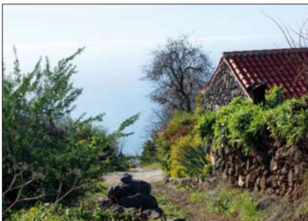
Abb. 1: Gartenidylle im Urlaubsparadies La Palma auf den Kanarischen Inseln.

Wie sieht eine „normale“ Freiraumgestaltung heute aus? Die vorhandene Vegetations- und Bodendecke wird großflächig abgeschoben und durch fetten Humus oder künstliche Kultursubstrate ersetzt, auf denen Einheitsrasen angelegt und exotische, züchterisch veränderte Gehölze und Stauden gepflanzt und mit Rindenmulch abgedeckt werden. Baustoffe und Materialien aus allen Erdteilen werden zusammengetragen, in Schaubeeten exotische Pflanzen und genetisch manipulierte Zuchtformen aus verschiedensten geografischen und naturräumlichen Herkünften