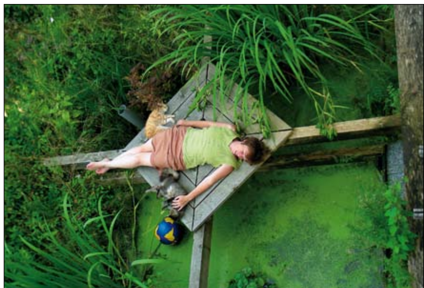
Abb. 24: Zwanzig Quadratmeter Paradies im Hochsommer. Wasserspeicher, Lebensraum für Pflanzen, Tiere und Menschen. Die Wasserlinsendecke sorgt für klares Wasser.

Jeder verantwortungsbewusste Gartenbesitzer kann für die Rückhaltung und Versickerung des Regenwassers auf seinem eigenen Grundstück sorgen. Bei einer Muldentiefe von 40 bis 60 Zentimetern sind für die Rückhaltung des Wassers, das bei einem Starkregenereignis zu erwarten ist, rund 10 bis 20 Prozent der versiegelten Fläche zu veranschlagen. Bei einem Neubau mit 100 m 2 Dachfläche über dem Wohnhaus, 30 m 2 über dem Carport und 50 m 2 Wegen und Plätzen sind das rund 18 bis 36 m 2 . Anstatt einer Sickermulde dieser Größe kann gleich ein kleiner Teich angelegt werden, der im tiefsten Bereich das Wasser hält und damit für Bewässerungszwecke zur Verfügung