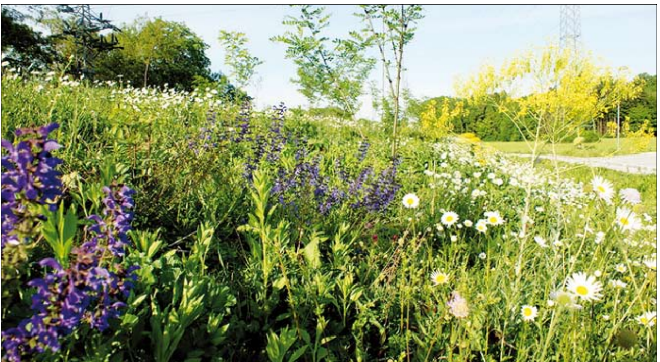
Abb. 19: Stadtgut Steyr 2009. Wiesensalbei, Margerite und Färberwaid haben sich als ausdauernde Pflanzen etabliert.

Der Sicker-Speicher-Teich kommt gleich drei Bedürfnissen entgegen: Er hält Niederschlagswasser im Garten zurück und entlastet so die Kanalisation bzw. die Vorfluter. Er ersetzt die wenig dekorativen grünen Kunststoff-Regentonnen und die kostspieligen