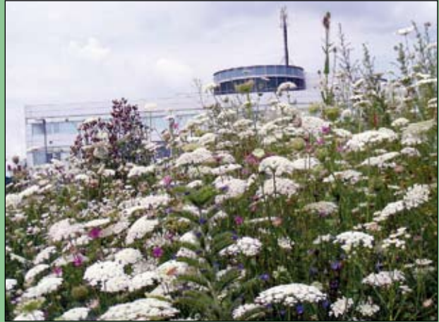
Abb. 21: Im Sommer übernehmen dann Karotten und Malven, Karden und Kugeldisteln wachsen ihnen über den Kopf.