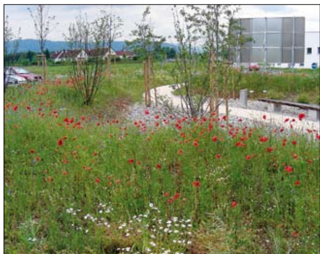
Abb. 16: Stadtgut Steyr 2007: Im ersten Jahr bestimmen Einjährige wie Mohn und Kamille das Bild.