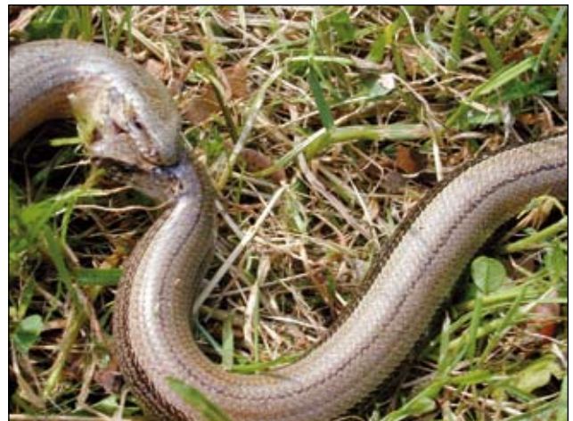
Abb. 37: Blindschleichen - faszinierende Begegnung zum Frühlingsanfang.