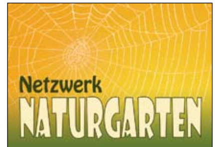
Abb. 35: Zwölf Betriebe und Organisationen in Österreich haben sich zum Naturgarten-Netzwerk zusammengeschlossen.

und Größe der Aufgabenstellung arbeiten sie einzeln oder „Hand in Hand“.