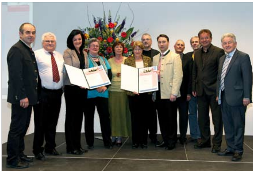
Abb. 40: Verleihung des Umweltschutzpreises für die Projekte „Bunte Mitte Hagenberg“ und „Naturnahe Gewerbeflächen tisp“. Planung DI Kumpfmüller KG.

* Umweltschutzpreis des Landes Oberösterreich 2010 , Sonderpreis in der Kategorie Gemeinden an „Bunte Mitte Hagenberg“ und „Naturnahe Gewerbeflächen tisp“ im Softwarepark Hagenberg (Abb. 40).