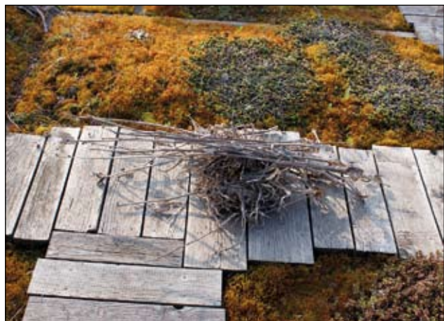
Abb. 32: Bei Pflegearbeiten fällt reichlich „Futter“ für die Käfer an - sogar im Dachgarten.