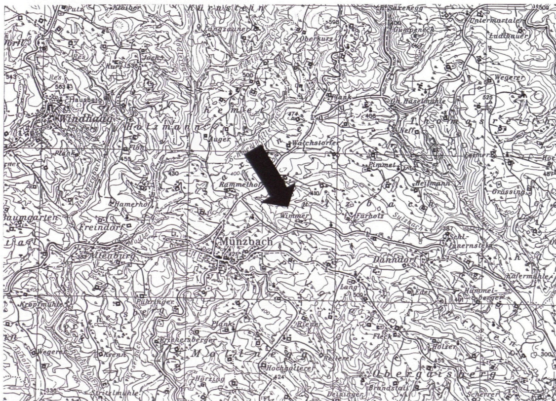
ÖK 1: 50.000, Blatt 34 Perg

Die Wasserversorgung der Gemeinde Münzbach basierte bis zum Jahr 1995 auf einem Schachtbrunnen ( Baujahr 1956/57 ) mit 18 Metern Tiefe und zwei Bohrbrunnen ( Baujahr 1992 und 1995 ) mit einer Tiefe von 13 Meter und 88 Meter. Diese stellten ein Gesamtwasserdarbot von 235 Kubikmeter pro Tag zur Verfügung. Da diese Menge in Trockenwetterzeiten nicht ausreichte, wurden weitere Bohrungen auf gemeindeeigenem Grund niedergebracht, die durchaus respektable Ergebnisse hinsichtlich Qualität und Quantität erbrachten (SPENDLINGWIMMER 1997 ).