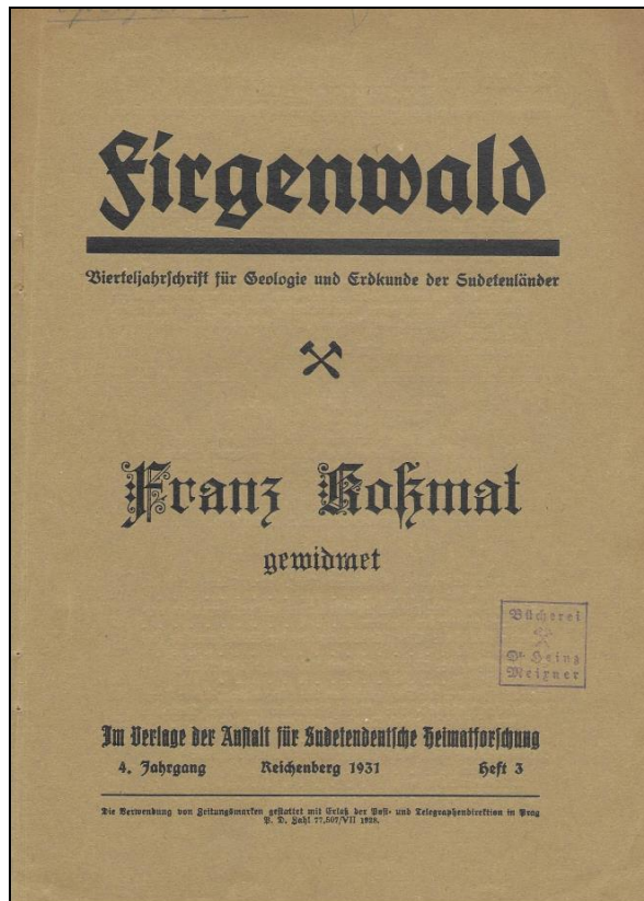
Abb. 1: Zum 60. Geburtstag von Prof. Dr. Kossmat widmete ihm die Vierteljahrschrift für Geologie und Erdkunde der Sudetenländer das Heft Nr. 3

Als Folge einer überaus strapaziösen geologischen Reise nach Turkestan im Jahr 1928 erkrankte er schwer und konnte sich eigentlich nie mehr richtig erholen. Trotzdem arbeitete er wissenschaftlich weiter, wiewohl seit 1934 im sog. „Ruhestand“, bis ihm der Tod am 1. Dezember der Tod die Feder aus der Hand nahm. Immerhin war es ihm vergönnt, im Jahr 1936 eines seiner wichtigsten Werke „Paläogeographie und Tektonik“ fertigstellen zu können.