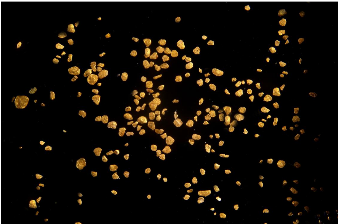
Gold, Rederinsel, Steyr