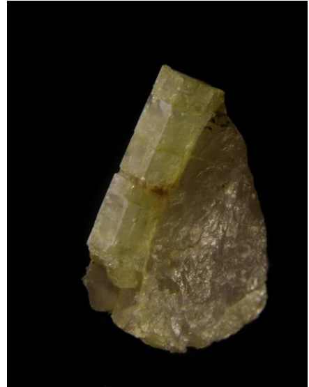
Beryll, Luftenberg bei Linz