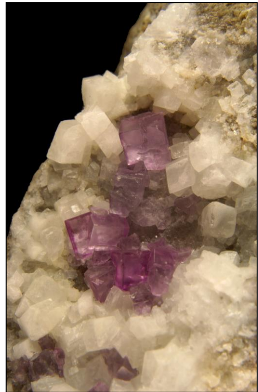
Fluorit, Fuchsalp, Spital am Pyhrn