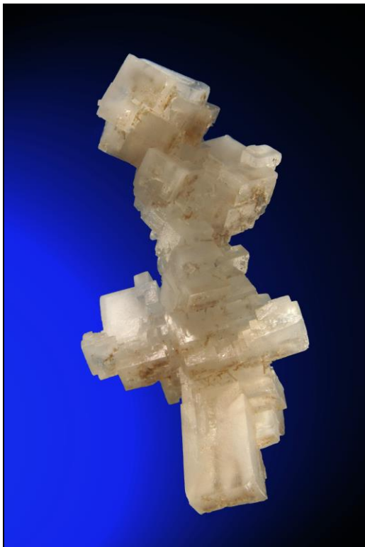
Halit, Bad Ischl