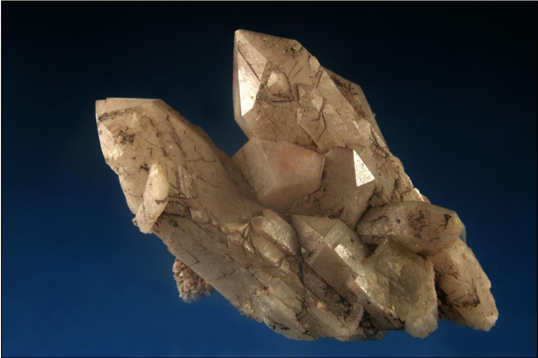
Quarz, Natschlag bei Aigen Schlägl