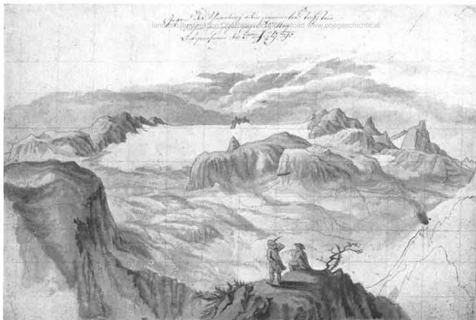
„Gegend des Schneeberg oder sogenannten Tachstein Goldher gegen Mittag Aufgenommen den 27ten July 1790.“ Aquarellierte Tuschpinselzeichnung im o.-ö. Landesmuseum