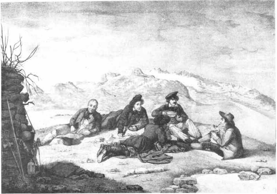
Die Maler auf dem Hallstätter Gletscher im österreichischen Salzkammergut. Lithographie des königlichen lithographischen Institutes Berlin (1823). D.-Ö. Landesmuseum