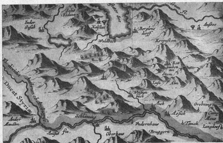
Ausschnitt aus der Karte von Oberösterreich von Holzworm (1662). Originalgröße