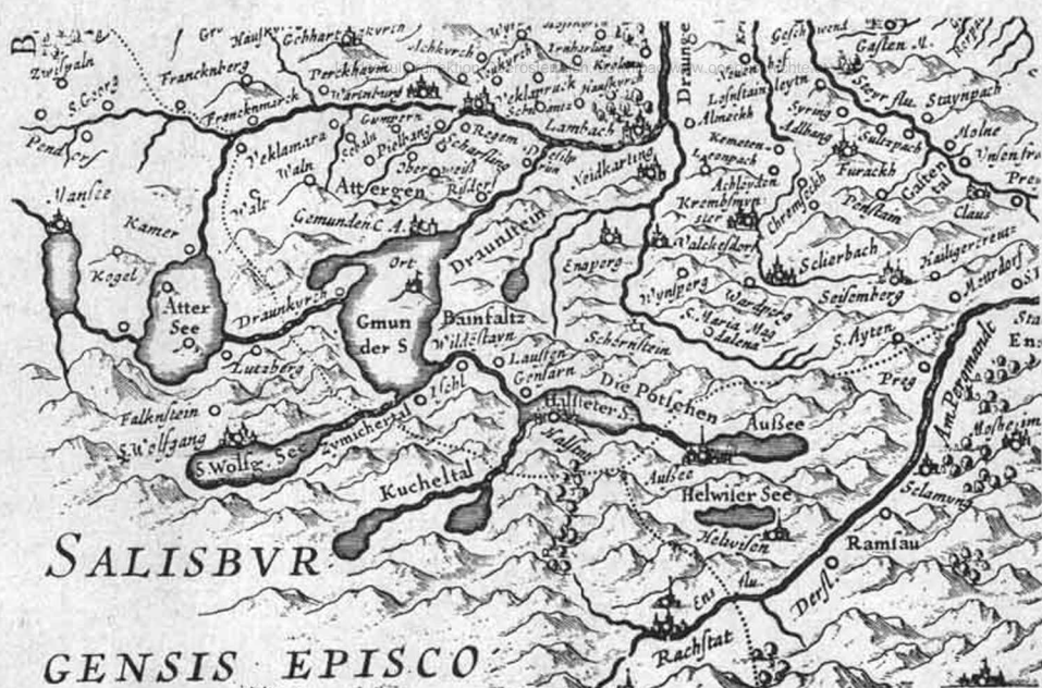
Ausschnitt aus der Karte von Ober- und Niederösterreich von Wolfgang Lazius 1545, späterer Nachstich von Johannes Janßen. Originalgröße