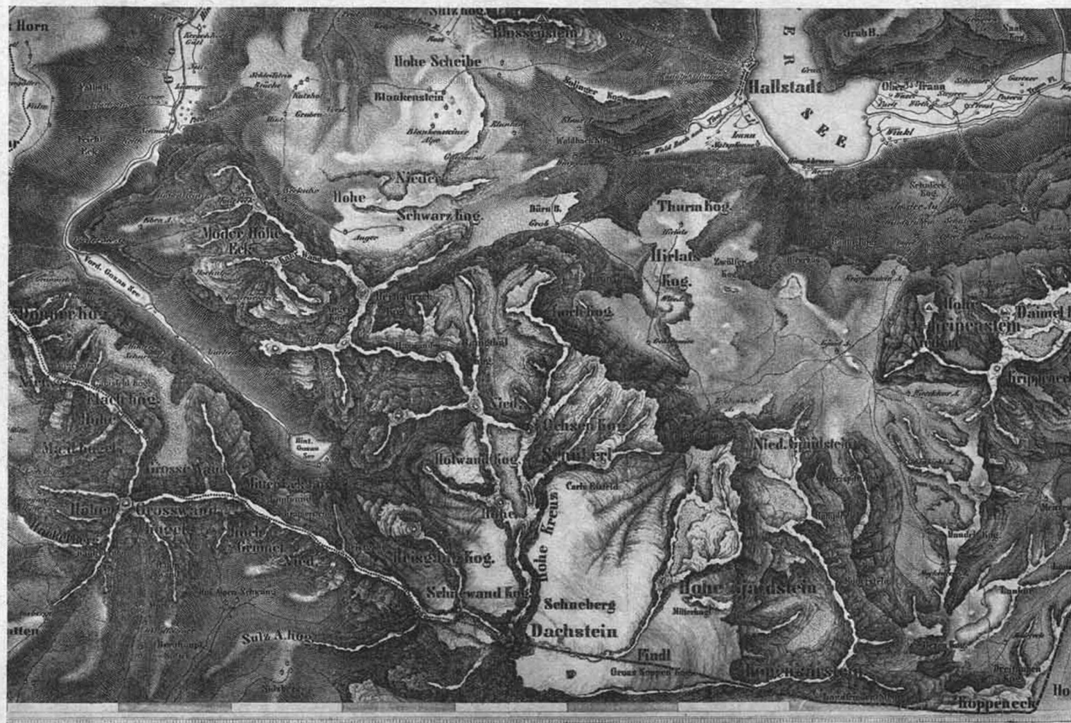
Ausschnitt aus der Karte „Das Salzkammergut in Ober Oesterreich“ von Alois Souvent (1840). Originalgröße