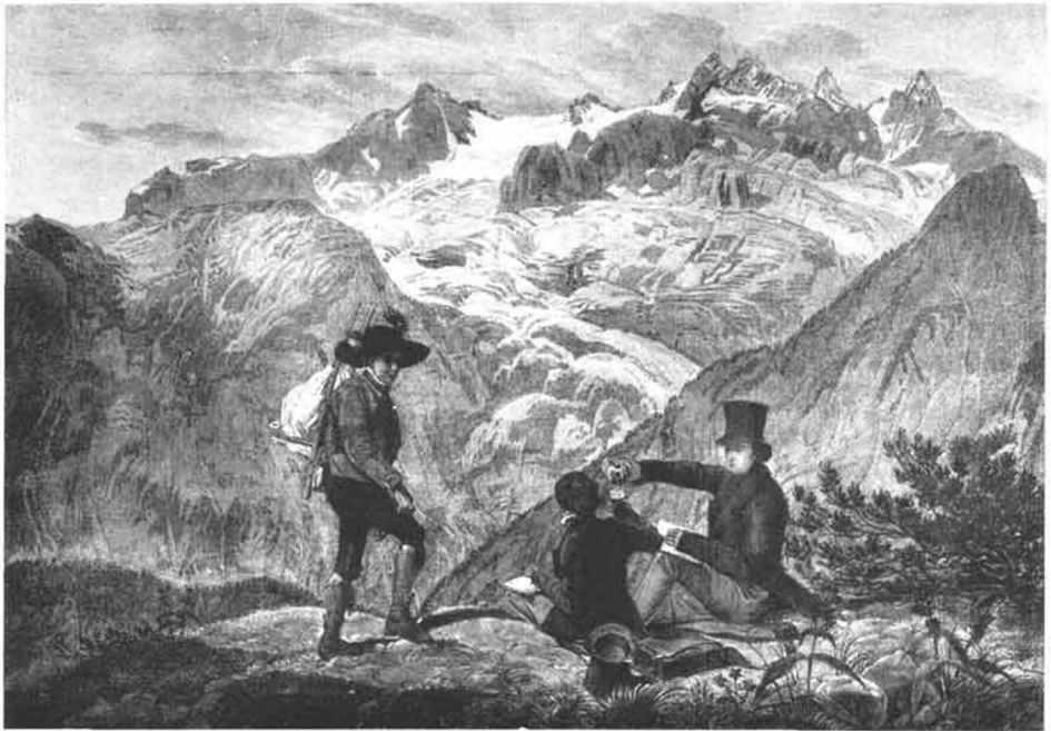
Der Dachstein vom Plassen. Lithographie von J. Alt (1825)