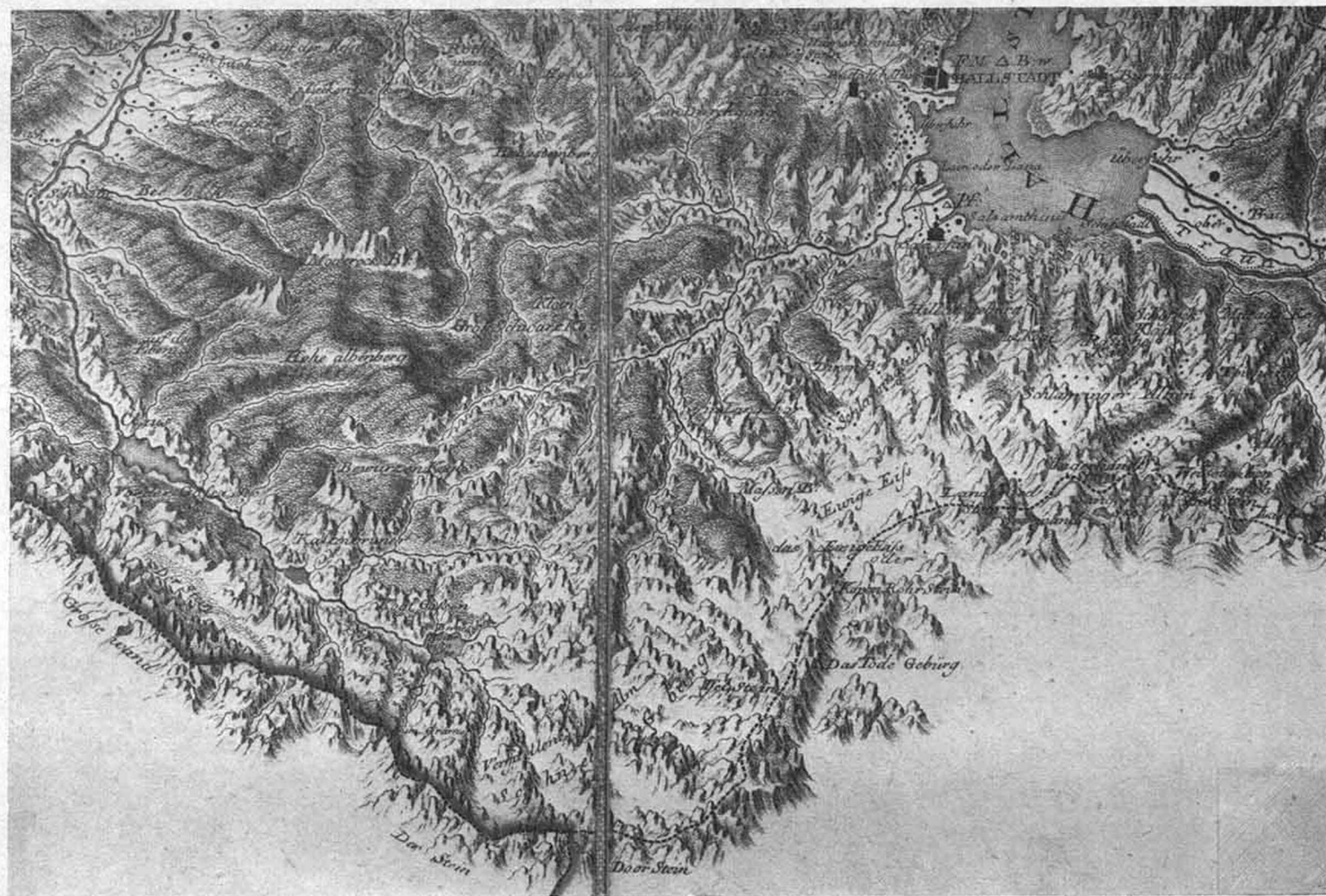
Das Dachsteingebiet auf der Karte von Oberösterreich von C. Schütz (1787). Originalgröße