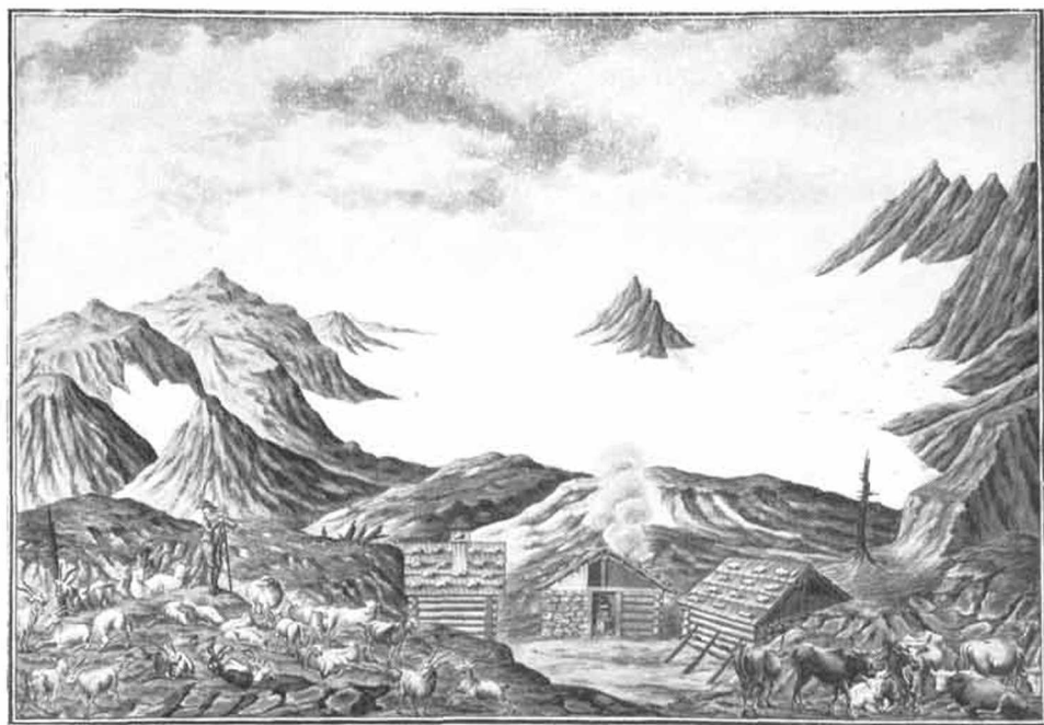
„Ansicht des Schneegebirges bei Hallstadt“. Aquarell nach einer Federzeichnung von Joseph Laimer (1825). Museum Bad Ischl