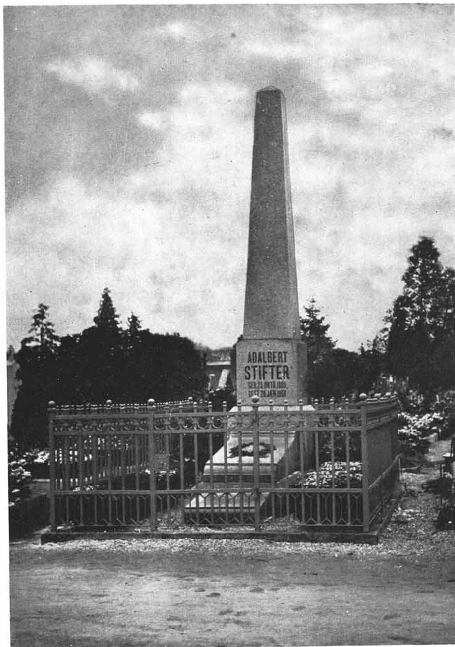
Grab Adalbert Stifters (auf dem Friedhofs in Linz)