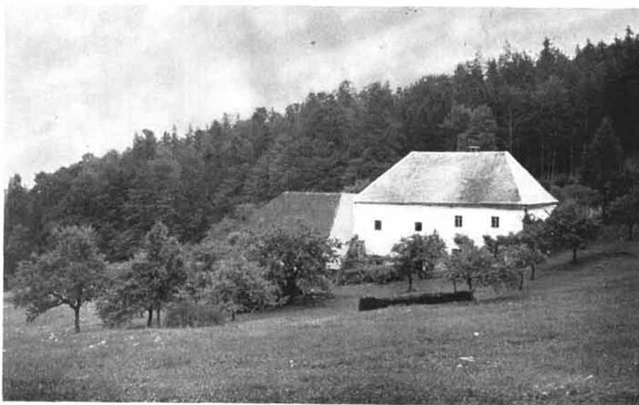
Bild 3: Das „Hochhaus“ bei Schlägl. Der Altbau ist an den kleineren Fenstern gut zu erkennen