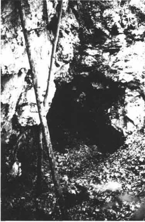
Grubenportal am steilen Südfuß des markanten Felsgrates im Westhang des Revieres