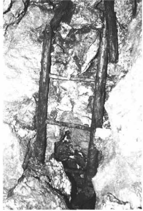
Holzleiter, in einen verstürzten Vertikalabschnitt führend

die Spannungsverteilung im Gebirge nur wenig; im Gegenteil, bei der Befahrung der unverstürzten Teile erwiesen sich die in den Bau einbezogenen Naturhöhlen als die dauerhaftesten Grubenabschnitte. Fast alle heute noch befahrbaren Stollenabschnitte sind künstlich erweiterte Naturhöhlen. Zum baulichen Zustand 1949 schreibt Frey: „Nach der Anlage der Stollen und dem Bewuchs der Halden zu schließen, ist der Bergbau am Osthang des Tales jünger; für diese Annahme sprechen auch einzelne spärliche Erinnerungen der Einheimischen, unter anderen die Bezeichnung ‚Knappenweg‘ für einen alten, vom Talboden zu den Stollen führenden Fußsteig. Ein gut erhaltener, etwa 50 m langer Suchstollen endigt dort im Taubgestein; andere Stollen haben erzführende Klüfte und Höhlungen angefahren. Die bereits zuvor erwähnte Hochofenanlage stand etwa 2 km talabwärts im Weiler Wendbach. Mächtige Grundmauern, unmittelbar neben dem Bachbett, einen Platz von ungefähr 100 m im Geviert einschließend, weisen den Standort der letzten Eisenhütte im Lande Oberösterreich.“ 49