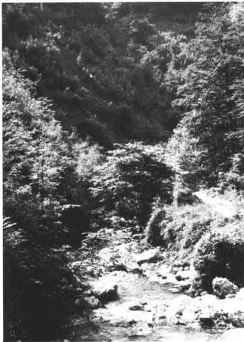
Im Wendbachgraben; etwa 1.200 m bachaufwärts der Mündung

Die heute noch auffindbaren Stollen und Halden des Revieres liegen etwa 3 km bachaufwärts der Mündung des Wendbaches in die Enns. Das Tal gehört zur Gemeinde Ternberg; Grundeigentümer sind die Österreichischen Bundesforste.