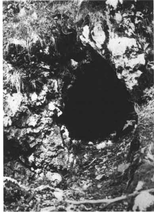
Portal im Osthangrevier (Länge der Trauflinie ca. 1,5 m)