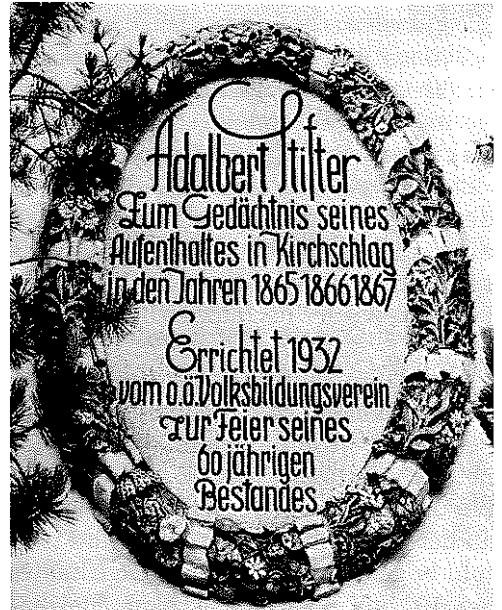
Gedenktafel an der Südwand der Pfarrkirche von Kirchschatz – Entwurf Leopold Forstner, Ausführung Willy Bormann.

An der südlichen Außenseite der Anna-Kirche erinnert eine vom Bildhauer Leopold Forstner geschaffene Gedenktafel, die am 4. September 1932 enthüllt wurde, an die Aufenthalte Stifters in Kirchschatz.