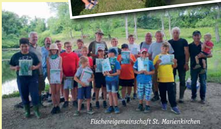
Fischereigemeinschaft St. Marienkirchen