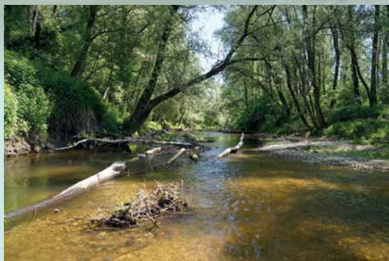
Strukturreiche, kiesgeprägte Renaturierungsstrecke

Im Zuge dieser Arbeiten wurde ein artenreicher Fischbestand mit dichtem Jungfischaufkommen festgestellt. Darunter waren auch einige typische Donauarten wie Zingel, Schied, Nerfling oder Weißflossengründling.