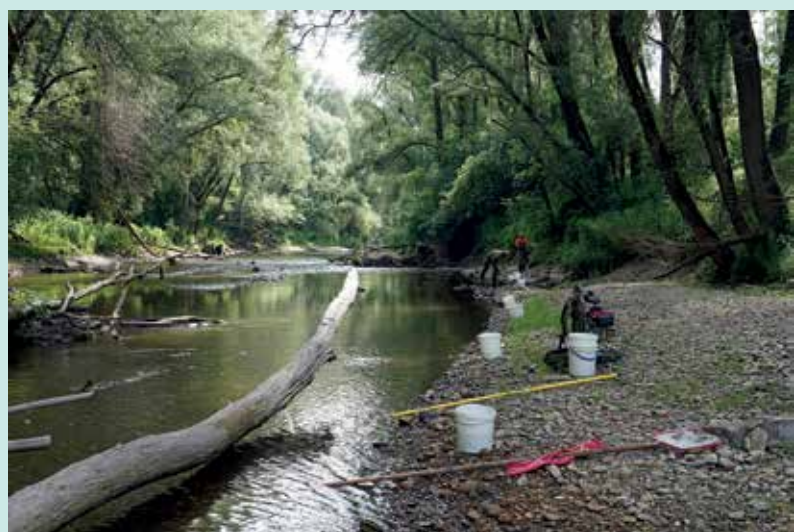
Jungfischererhebung mittels "Point Abundance"

Jungfische der Barbe gehörten zu den häufigsten der gefangenen Arten, sie traten insbeson-