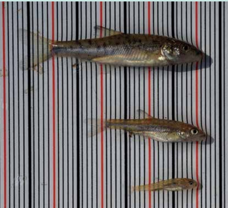
Jungbarben eines Jahrganges mit ganz unterschiedlicher Größe im August

der Jungbarben, was gut mit der Reproduktionsbiologie-Art in Zusammenhang gebracht werden kann, die als so genannter „Portionslaicher“ gilt. Bei Ereignissen wie Kaltweteinbrüchen kann das Laichgeschehen unterbrochen und erst Wochen später wieder aufgenommen werden, was zu unterschiedlichen Längenklassen („Kohorten“) innerhalb eines Jahrganges führt (sh. Foto).