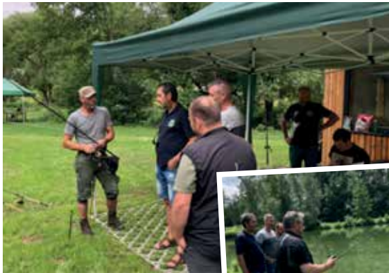
Verschiedene Stationen beim Praxis-Modul

Das Modul 4 wurde heuer im Sommer vom Verein „Fischerbund Steinschild“ beim Märchenteich in Schenkenfelden abgehalten. Herzlichen Dank für die gute Organisation und die perfekte Umsetzung an alle Mitwirkende!