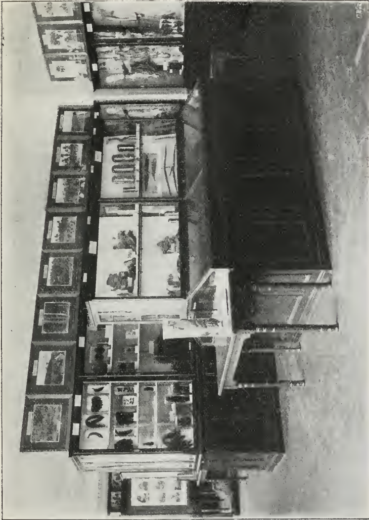
Abb. 2. Ansicht einiger Schränke aus der Kolonialabteilung: Ostafrika.

teils trocken, teils in Alkohol aufbewahrt, die das Studium im Museum in der wertvollsten Weise unterstützen. Dem Museum sind weiter recht umfangreiche Räume für den Unterricht an-