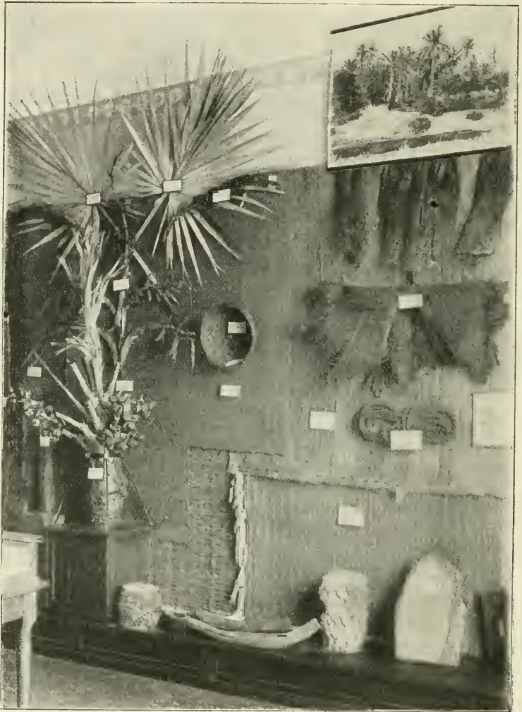
Abb. 1. Pflanzengeographische Abteilung: Ägypten.

koloniale Flora vorführt. Endlich ist noch die systematische Abteilung zu erwähnen, die uns das Pflanzenreich nach dem Engler'schen System in 13 Abteilungen erläutert. Daß das