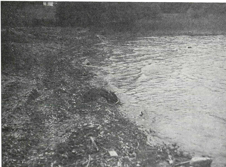
Abb. 2 und 3: So beginnt die Zerstörung der Seeufer:

Mittels Schubraupen werden die Schilfbestände der seichten Buchten zerstört, später dann noch Ufermauern gebaut. Uferpartie in Parschallen am Attersee.