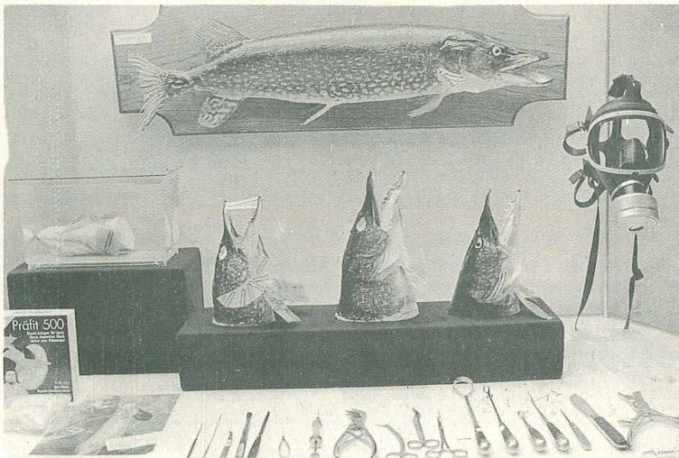
Ein Blick hinter die Kulissen der Fischpräparation

Auch Fernsehen und Rundfunk hatten größtes Interesse an der Ausstellung und produzierten einige Sendungen. Ja.