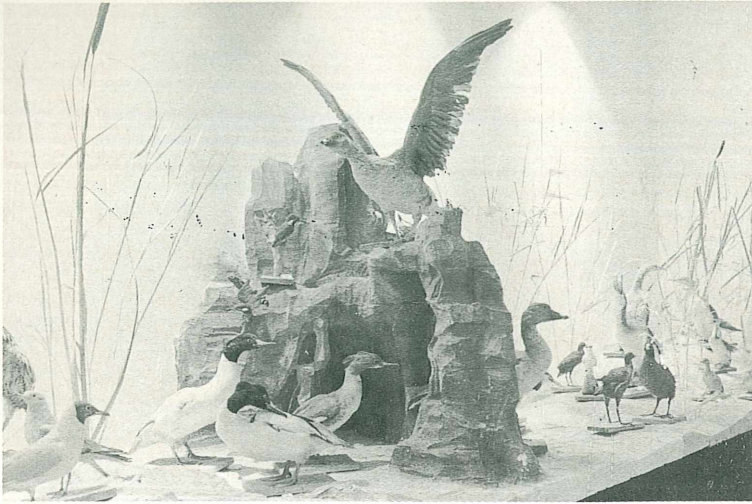
Blick auf einen Teil der großen Wasservogelschau bei der Linzer Fischereiausstellung