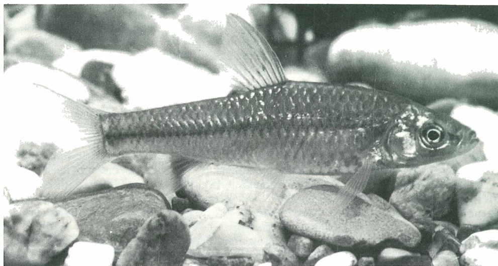
Abb. 1: ( Pseudorasbora parva , Aquarienaufnahme