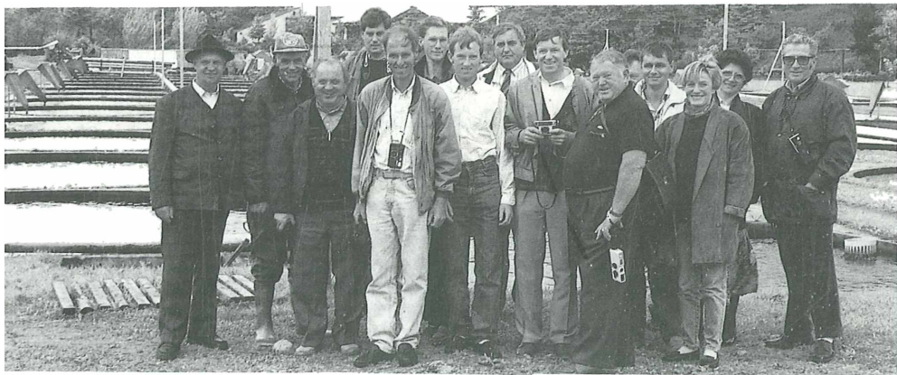
Exkursionsteilnehmer des Verbandes der Forellenzüchter

Die wohl größte Herausforderung für die dänischen Forellenzüchter ist die äußerst strenge Gesetzgebung im Hinblick auf die Reinhaltung der Gewässer. Über Fischbestand und verabreichte Futtermengen wird praktisch der gesamte Produktionsablauf in den Anlagen behördlich beobachtet, kontrolliert und allenfalls beeinflusst. Um die Produktion im bestehenden Umfang aufrecht erhalten zu können, wird laufend an der Effizienzsteigerung der Reinigungssysteme in den Fischzuchtanlagen gearbeitet. Derzeit versucht man Bio- und Trommelfilteranlagen in hydraulischer Hinsicht praxistauglich zu machen. Dem Problem unregelmäßiger Wassertemperaturen und damit einhergehender Sauerstoffschwankungen in den Zuflüssen