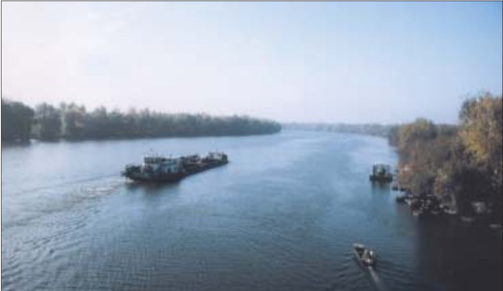
Die Theiß bei Tiszafüred