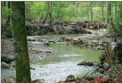
Renaturiertes Teilstück – niedriger Wasserstand durch geschlossene Toplitzsee-Wehranlage

bezirksleitung Liezen wurde am 22. September 2003 mit den Rückbauarbeiten begonnen. In drei Wochen wurde eine Gewässerslänge von etwa 1,1 km restrukturiert. Da der Wasserstand des Toplitzbaches durch eine Wehranlage beim Seeausfluß gesteuert werden kann, lassen sich ideale Arbeitsbedingungen schaffen. Ein Löffelbagger (Forsttechnik Steinkogl/ÖBf AG) kam zum Einsatz. Die Rückbauphasen II und III (Umbau Wehranlage Toplitzsee [derzeit Migrationshindernis] und Umbau Toplitzbachmündung in den Grundlsee, Aufweitung in ein Delta) werden im Spätwinter umgesetzt. Aufgrund der Laichzeiten von Bach- und Seeforelle bzw. Seesaibling wurden die Rückbauarbeiten ausgesetzt. Die ersten Seeforellen bzw. Seesaiblinge konnten im neuen Abschnitt des Toplitzbaches schon gesichtet werden. Bei dieser Gelegenheit möchte ich mich schon jetzt bei allen, die dieses Projekt möglich gemacht haben bzw. mithelfen, es umzusetzen, recht herzlich bedanken! Der »neue« Toplitzbach hat nunmehr wieder seinen »Freiraum« mit Mäandern, mehrere Seitenarme, Uferabbrüche, über hundert Wurzelstöcke und Raubbäume, hunderte von größeren Steinen, die ehemals das Triftgewässer sicherten. Die Holzeinbauten wurden mit Stahlseilen und Holzpiloten so gesichert, daß diese so gut wie möglich nicht gesehen werden können.