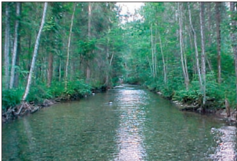
Blick auf den begradigten, ausgeräumten Bachverlauf vor dem Rückbau