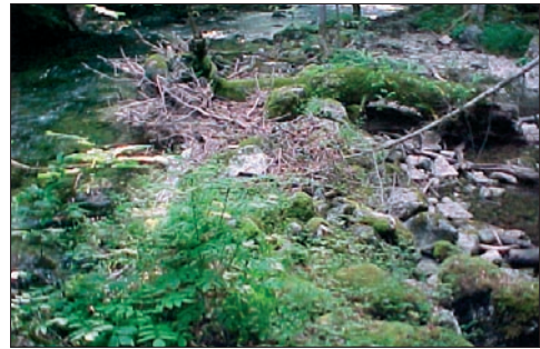
Für die Holztrift eingezwängter Bachbereich vor dem Rückbau