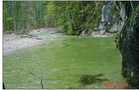
... nach dem Rückbau – der Bachverlauf wurde komplett nach rechts zum Felsen verlegt.

Ein künstlich erzeugtes »kleines« Hochwasser (Aufstauen bzw. Ablassen des Toplitzsees) hat gezeigt, daß der Bach nunmehr langsamer in mäandrierender Form fließt und die Spuren des künstlichen Eingriffes schon zum überwiegenden Teil verschwunden sind. Für allfällige Fragen über das Projekt stehe ich Ihnen gerne zur Verfügung. Bei Bedarf einer Besichtigung bitte ich um Kontaktaufnahme unter der Telefonnummer 0664/133 79 38.