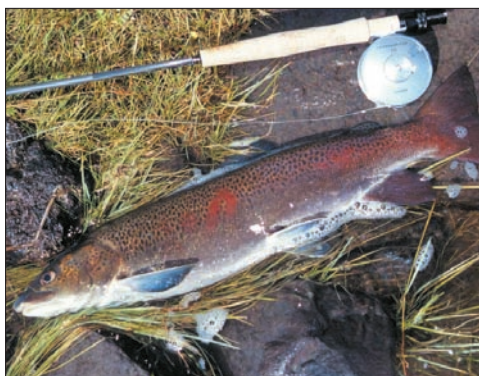
Herrlich gefärbter Lenok