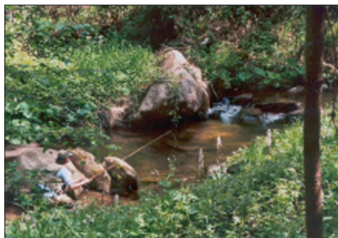
Teigitsch, kleiner Nebenbach der Kainach, von der Langmannsperre (in Privatbesitz)