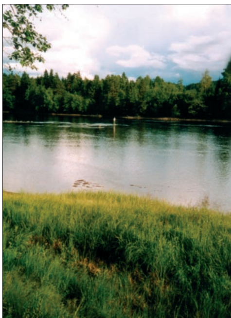
An der Klarälv in Dalarna, Mittelschweden: ein ex-zellentes Fliegenrevier für wilde Äschen und Bach-forellen

Dann fährt man weiter über Göteborg zum Vänersee und entlang des Klarälv nach Nord-schweden. Der Klarälv ist im Unterlauf ein ausgezeichnetes Hechtwasser, auch mit kapitalen Flussbarschen. Im Mittellauf ist der Klarälv ein hervorragendes Äschenwasser für Fliegenangler, zum Waten geeignet. Im Ober-lauf ist der Fluss dann Bachforellenregion mit kapitalen nordischen Bachforellen und Aal-rutten – ein Paradies für Fliegenangler! Der Fluss setzt sich nach Norwegen fort, er heißt dort dann Trysilälv.