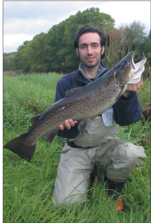
Starke Meerforelle aus Pool 17

Ein Pflichttermin in Mörrum ist der Besuch des Laxens-Hus. Dort kann man im Lachsmuseum neben eindrucksvollen Präparaten von Lachsen, Meerforellen und anderen Fi-