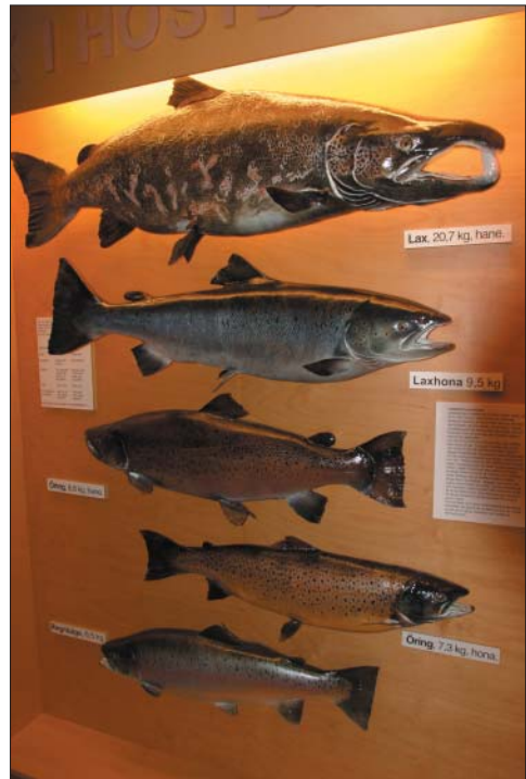
Sehenswertes Lachsmuseum in Schweden an der Mörrum

FISCHEREIGUTACHTEN · ELEKTROBEFISCHUNGEN · BESATZEMPFEHLUNGEN