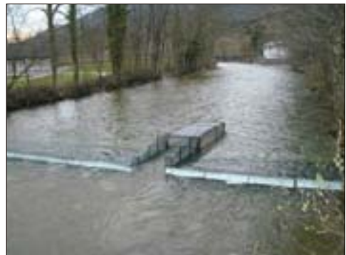
Abb. 2: Dynamisches Fischwehr mit integriertem Reusenkasten zum Fang stromaufwärts wandernder Fische in der Seeache

Während der neunwöchigen Reusenuntersuchung wurden neben Perlfischen und Seelauben weitere 16 Fischarten nachgewiesen, die sechs Familien zugeordnet werden. Auch