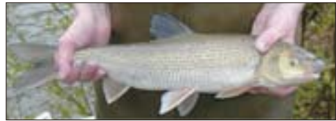
Abb. 1: Perlfischmännchen ( Rutilus meidingeri )

Der Schwanzstiel erscheint vergleichsweise lang und schlank. Das Schuppenkleid ist gleichmäßig silbrig glänzend, auf der Rückenpartie gräulich bis bräunlichgrün. Die Flossen sind blassgrau, nur die Bauch- und Afterflosse sind blassrot gefärbt. Die relativ kleine Mundspalte wird von der Schnauzenspitze nur leicht überragt, sodass das Maul end- bis unterständig erscheint. Während der Laichzeit bilden die Männchen auf Kopf und Rücken einen starken Laichausschlag aus, von dem sich auch der deutsche Name dieses Fisches ableitet.