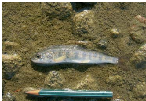
0+ Lenok im September (11 cm)

Die Taimen hier sind wohl auch vergleichsweise langsamwüchsig, doch mongolische Taimen gleichen dies mit Langlebigkeit aus. Wie Altersanalysen an Wirbeln von Totfunden gezeigt haben, können sie bis zu 40 Jahre alt werden, und dann beachtliche Endlängen erreichen. Das ist ein geradezu biblisches Alter, wenn man bedenkt, dass der europäische Huchen kaum 20 Jahre lebt! Das Wasser des Delgermoron gefriert im Herbst für 128 bis 175 Tage im Jahr, über weite Strecken bis zum Grund. Nach dem Eisbruch suchen Taimen ihre Fress- und Laichgründe auf und verrichten ihr Laichgeschäft. Zum Fressen und Wachsen bleiben nur wenige Monate, bis oft viele Kilometer lange Wanderungen zu Tiefstellen im Fluss als Wintererstand beginnen. Als symptomatisch für stark befischte Strecken gilt, dass kaum mehr große, alte Fische