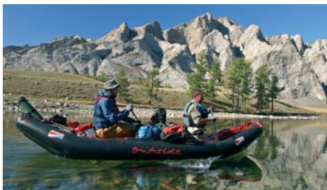
Mit dem Boot am Oberlauf

zu verfärben, am Talrand Felsformationen aus weißem Kalkgestein in bizarren Formen – es fällt schwer, sich eine idyllischere Landschaft vorzustellen als die märchenhafte herbstliche Nordmongolei. Wir beschließen, bereits mittags Halt zu machen und den schönen Tag zu genießen. Ich gehe zum Lenokfischen, um für das Mittagessen zu sorgen. Nach einer halben Stunde ohne nennenswerten Erfolg bleibt mein Silberstreamer Größe 2 in der Flussmitte stehen. Ein harter Ruck in der Rute lässt mir die Alarmglocken schrillen. Schon kann ich hinter der Fliege ein riesiges dunkles Etwas erkennen! Huchentypisch kommt der Taimen an die Oberfläche, spreizt und schüttelt sein riesiges Maul, versucht die lächerlich kleine Fliege abzuschütteln. Diesen Fisch zu kriegen, wäre mein Traum! Doch realistischerweise hoffe ich kaum, den Kapitalen mit dem feinen Fliegenzeug landen zu können. Ein paar Fluchten mit Urgewalt – es ist nicht mal dran zu denken, den Fisch aufzuhalten. Doch schon werden die Fluchten kürzer, der Große Rote zeigt Flanke und lässt sich schlussendlich wirklich stranden. Ich bin überglücklich. Der wunderschöne Taimen misst 1,22 m und zeigt bei Paradeportionen noch keinerlei Alterserscheinungen.