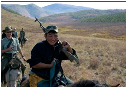
Zu Pferd mit der Grenzpolizei durch die herbstliche Ulaan-Taiga

Die Lösung sind die Genehmigungen für unseren wissenschaftlichen Auftrag – schließlich wollen wir auch aus dem Delgermoron Äschenproben sammeln (siehe Teil 1, voriges Heft). Der Plan ist, mit Pferden über die Berge zu reiten, um Boote, Ausrüstung und Proviant an den Fluss zu bringen, so weit stromauf, wie eine Bootsbefahrung nur irgend möglich ist. Mit den offiziellen Papieren in Händen steuern wir direkt das Quartier der Grenzpolizei an. Der Kommandant der Truppe macht zuerst eine finstere Mine, doch unser Fahrer schafft es, ihn umzustimmen. Der Befehlshaber der Grenzpolizei unterstützt unser Vorhaben, erlaubt das Betreten der Sperrzone und wird uns gleich am nächsten Tag Pack- und Reitpferde zur Verfügung stellen! Doch eines bläut er uns mit Nachdruck ein: Wir müssen immer am linken (mongolischen) Ufer bleiben, die linken Nebenarme befahren, am linken Ufer fischen, Lager und Pipi machen. Denn auf der rechten (tuwenischen) Seite des Flusses könnten wir von den Russen verhaftet werden!