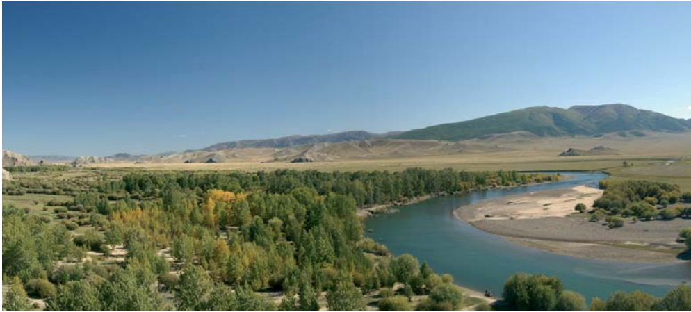
Der Unterlauf des Delgermoron

in die Heimat zu fliegen. Um viele Eindrücke bereichert, freuen wir uns nach vier Wochen Wildnis auf Selbstverständlichkeiten wie Dusche, Bett, ein kühles Bier. Groß ist die Freude und Erleichterung, diese abwechslungsreiche Tour so erfolgreich gemeistert zu haben!