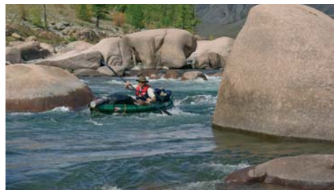
Verblockte Wildwasserstrecke im Mittellauf