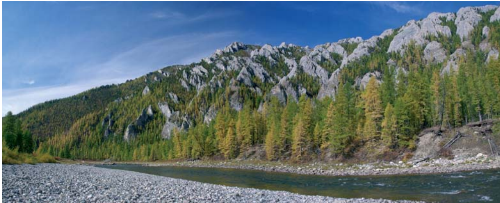
Blick auf das rechte russische Ufer des Delgermoron

einzel Taimen auszumachen – zu fangen dürften sie jedoch hier eher schwierig sein. Wir hoffen, dass der Fangerfolg in den nächsten Tagen so weiter geht, doch leider kommt es anders. Sehr viel Zeit bleibt auch nicht zum Fischen – wir müssen Strecke machen, um unseren Endpunkt (die Provinzstadt Mörön) rechtzeitig erreichen zu können. Auch das tägliche Kochen, Auf- und Abbauen des Lagers und Beladen des Boots nimmt viel Zeit in Anspruch. Am folgenden Tag stellt sich wolkenloses herbstliches Schönwetter ein, das für die restlichen zwei Wochen anhalten sollte. Ob das dafür verantwortlich ist, dass wir beim Taimenfischen meist erfolglos bleiben, oder die Tatsache, dass wir aus dem Grenzgebiet und daher unbefischten Gefilden heraus gefahren sind, ist schwer zu sagen. Fakt ist: In den folgenden drei Tagen schwingen wir fleißig unser Fliegenruten weiter, können aber trotz optimaler Bedingungen nur einen kleinen Taimen fangen und als bisherigen Höhepunkt ein 95-cm-Exemplar, das sich auf die schwimmende Hirschhaarmaus stürzt.