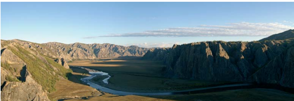
Morgenstimmung am Mittellauf des Delgermoron

in zugängliches Gebiet, eine Seilfähre bietet für Fahrzeuge die einzige Möglichkeit, den Fluss zu queren. Hier hat ein kleiner Goldrausch eingesetzt. Ein paar Dutzende Familien schürfen mit primitiven Werkzeugen im Uferschotter nach dem Edelmetall – die Szenerie sieht genau so aus, wie man sich's im 19. Jahrhundert im Yukon ausmalen würde. Tags darauf passieren wir ein Fischercamp. Hier bestätigen uns italienische Fischergäste mäßige Erfolge: 8 Taimen für 5 Fischer in einer Woche, alle bis auf einen Metrigen unter 80 cm, so das magere Ergebnis. Man kann sich's schon vorstellen, dass die Fischbestände hier sehr unproduktiv und anfällig gegen Überfischung oder andere Schadeinflüsse sind. Das Klima ist extrem rau, die Winter lang und hart, der Gebirgsfluss Delgermoron nahrungsarm. Dass die Fische hier langsam wachsen, darauf weist die Größen der gefangenen Lenok im Vergleich beispielsweise zum produktiven Chuluut hin (siehe Diagramm). Die Lenok, welche wir am Delgermoron fangen, sind meist zwischen 40 und 55 cm lang und damit deutlich kleiner als die des Chuluut, welche meist zwischen 50