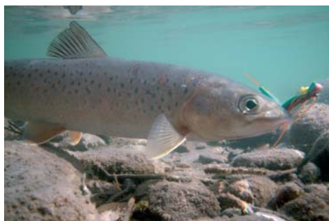
Ein Lenok hat das Heuschrecken-Muster geschnappt

Noch knapp 70 Flusskilometer verbleiben bis zur Mündung des Delgermoron in die Selenge, aber für diese Strecke bleibt uns keine Zeit mehr. Wir lassen an der ersten und einzigen Brücke des gesamten Flusses die Luft aus unseren Booten, um von Mörön nach Ulaanbaatar und weiter über Moskau zurück