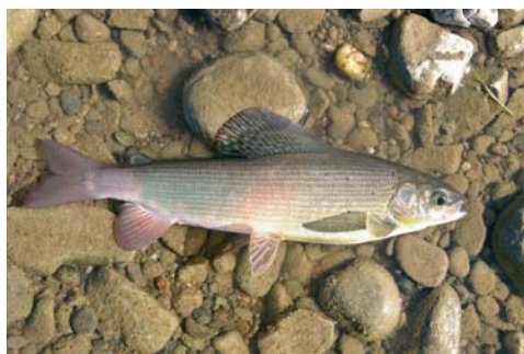
Äschen-Rogner (35,5 cm) aus dem Delgermoron