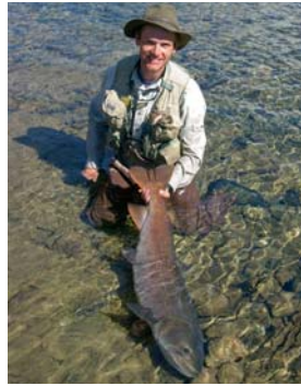
Wunderschöner Großtaimen (1,22 Meter)