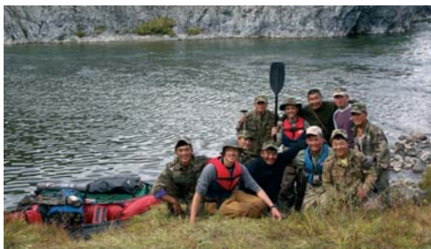
Abschied am Beginn der Bootstour

Am dritten Bootstag geht die Rechnung dann so richtig auf: Das Wetter ist trüb und regnerisch, doch das dürfte die Beißlaune der Taimen so richtig in Fahrt bringen. Viele unserer Bootsstopps für eine Stunde Fliegenfischen werden mit einem Taimen belohnt; leider bleiben sie aber alle unter der magischen Grenze von einem Meter. Als beste Fangplätze kristallisieren sich tiefere Rinnen in rasch fließenden, seichteren Strecken heraus. Besonders »heiß« sind auch Einläufe von Kolken, vor allem bei anstehendem Fels oder wenn Felsblöcke an der Sohle liegen (siehe Panoramafoto am Beginn, Pfeil). In großflächig tiefen, mäßig strömenden Kolken und Zügen sind beim Drüberfahren mit dem Boot zwar ver-