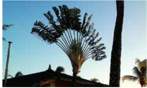
2. Eingang des Botanischen Gartens Pamplemousse mit dem »Baum des Reisenden« Ravenala ( Ravenala madagascariensis ), der mit Bananengewächsen verwandt ist.