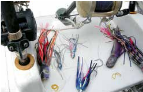
7. Die einsatzbereiten Köder (Jigs) mit den kräftigen Stahlhaken u. den Plastikstreifen (Skirts oder Rockerl).