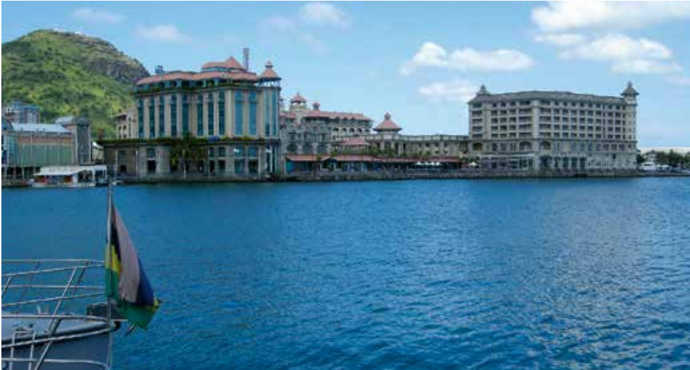
1. Ansicht des Hafens von Port Luis.

Wie entstand diese kleine Tropeninsel überhaupt, wie groß ist sie und wie hat sie sich zu so einer beliebten Urlaubsdestination entwickelt?