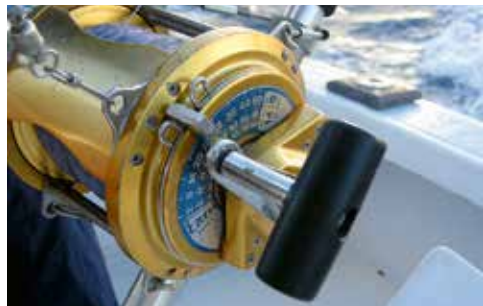
11. Die Toprolle Everol mit Schnurkapazität von 900m mit der Hebelbremse und der Skaleneinstellung für die Bremse.