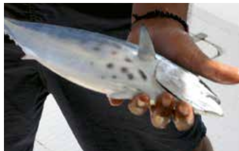
15. Eine der großen Makrelen, die auf die kleineren Jigs bissen.