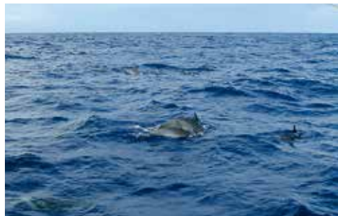
10. Erfreulicher Anblick der Delfine, die unser Boot begleiten.