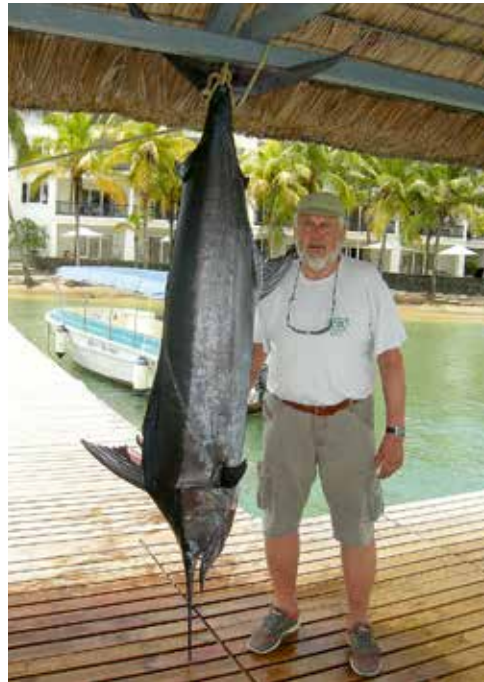
14. Der Blue Marlin mit einer Länge von 2,50 m am Gerüst.

Der Aufbau der Riffe erfolgt durch Korallen, meist Steinkorallen, die mit Algen eine Symbiose bilden und diese versorgen die Korallen mit Zucker und Sauerstoff. Die Korallen gehören zur Familie der Nesseltiere. Sie entziehen dem Meerwasser Kalk und scheiden diesen wieder aus. Die lebenden Korallen bilden nur eine kleine Oberflächenschicht, die jährlich nur 1 bis 2 cm wächst. Der Großteil der Riffe besteht aus den Skeletten der abgestorbenen Korallen und bildet sogenannte Korallenstöcke. Die Algen sind Einzeller, sie lassen die Riffe in den strahlendsten und leuchtenden Farben erblühen. Steigen die Wassertemperaturen der Meere bis gegen 30 °C oder darüber an, ob durch Klimawandel oder El Niño, so stoßen die Korallen die Algen ab, weil diese