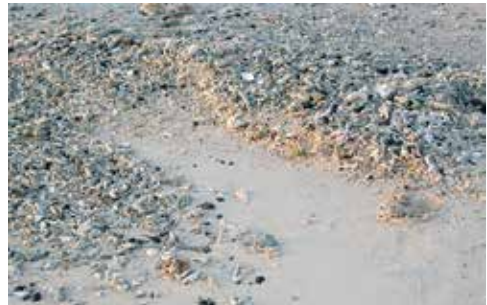
4. Überreste der zerstörten Korallenstöcke am Strand des Hotels Les Meridiens Ile Maurice.