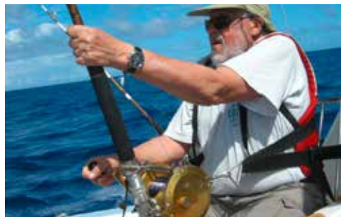
12. Der ermüdende und lange Drill des Blue Marlins.