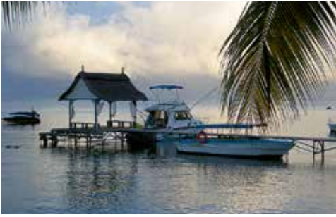
6. Die Popeye an ihrem Liegeplatz in der Turtle Bay.