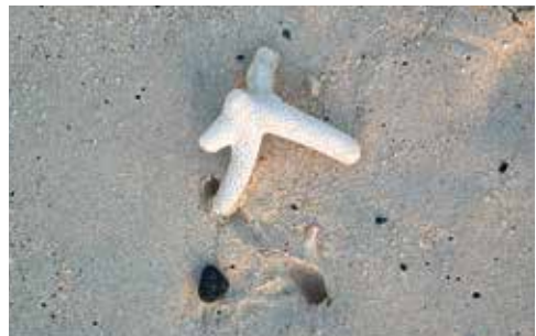
5. Angespültes Korallentierchen und die Abdrücke im Sand.