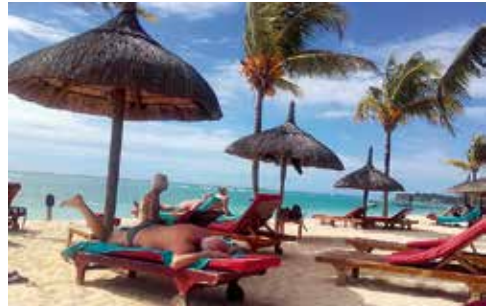
3. Liegen am Strand vor dem Hotel Le Meridien.