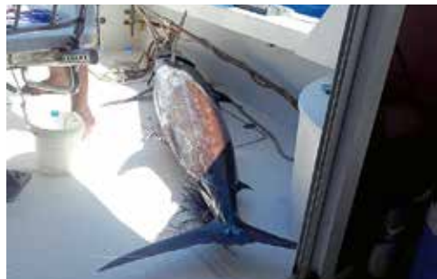
13. Der verendete Blue im Boot.