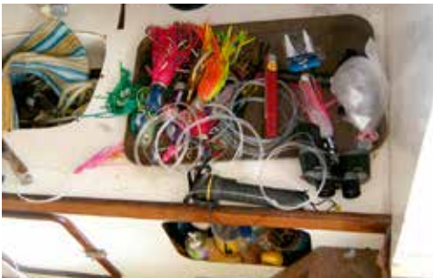
8. Das Vorratslager mit den fertigen Ködern (Jigs).