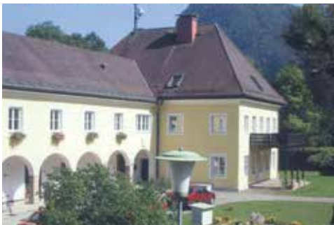
Bundesanstalt für Fischereiwirtschaft, heute das Institut für Gewässerökologie, Fischereiwirtschaft und Aquakultur.