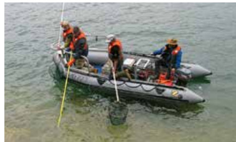
Elektrofischen am Mondsee

Die Sportvereine, die haben das Geld heute.