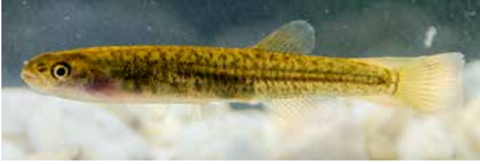
Abb. 13. Kap-Galaxias ( Galaxias sp.) aus dem Noetzie River; ca. 4,5 cm TL.

Wie mehrere molekularbiologische Studien erkennen ließen, besteht eine beachtliche genetische Divergenz zwischen den einzelnen Populationen der Kap-Galaxias. Fünf verschiedene Linien wurden festgestellt, die zwischen 7 % und 17 % voneinander divergieren. Das bedeutet die größte intraspezifische genetische Diversität, die bei Fischen jemals beobachtet wurde und spricht für die Präsenz von mindestens fünf kryptischen Arten innerhalb des bisherigen Taxons Galaxias zebratus (Wishart et al., 2006). Die äußeren Merkmale variieren zwischen den Populationsgruppen bei weitem nicht so stark wie die genetische Distanz es vermuten ließe. Nichtsdestotrotz lassen sich unterschiedliche Farbmuster erkennen, wie es die zwei abgebildeten Exemplare (Abb. 13 und 14) zeigen, deren Fundorte 440 km Luftlinie voneinander entfernt liegen. Weitere genetische und morphologische Studien sind erforderlich, um die taxonomische Einordnung der einzelnen Populationsgruppen zu gewährleisten. Es bleibt nur zu hoffen, dass die verbliebenen Populationen der Kap-Galaxias nicht durch Fraßdruck eingesetzter Fischarten oder den Verlust des Lebensraumes weiter dezimiert werden.