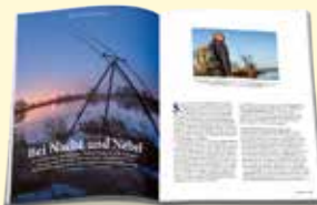
Ausrüstung & Technik