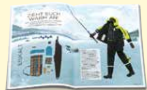
Genuss & Stil

Angeln Sie sich Ihr Abo (2 Ausgaben pro Jahr) zum Sonderpreis von nur € 9,90 statt € 11,60 auf