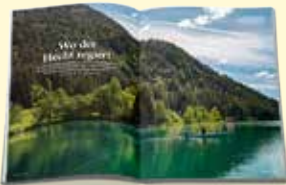
Wasser & Land

Werfen Sie einen Blick in die aktuelle Ausgabe unter fritzmagazin.com