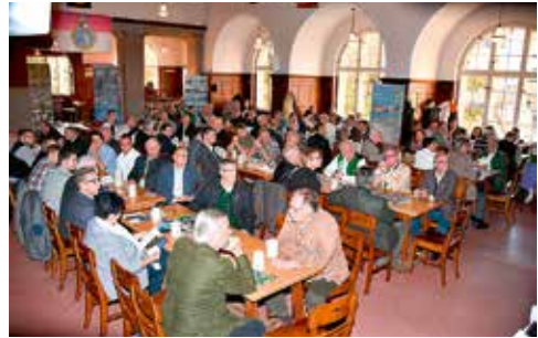
Zahlreiche Ehrengäste, Gäste und Delegierte nahmen am Landesfischertag 2018 im Augustiner Bräustübl in Mülln/Salzburg am 29. September 2018 teil.

Der Landesfischermeister berichtete von der bevorstehenden Novellierung des Salzburger Fischereigesetzes, den Problemen mit den Prädatoren, speziell dem Fischotter, der sich in Salzburg stark vermehrt hat und auch geschonte und gefährdete Fischarten auf seinem Speiseplan hat. Gerhard Langmaier lieferte Informationen zum aktuellen Fund des invasiven, landesfremden Marmorkrebses, der in Salzburg und auch erstmalig in Österreich im Freiland nachgewiesen wurde. Die