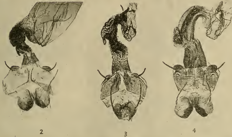
Armures génitales femelles ( \times 11 ) :

Cette armure génitale femelle est très différente de celle de Abrostola trigemina Wernerb. ( triplasia auct. nec L.) (fig. 4) et rappelle assez celle de A. clarissa Stgr. (Fig. 3) (1), espèce du Moyen-Orient. Elle se distingue bien de celle de cette dernière par le cervix bursae dont les parois sont moins chitinisées, et différemment, par les replis un peu plus grands du