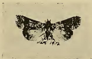
Fig. 1. Abrostola korbi n. sp., type unique ♀, Kazakewitsch (Ussuri)

♀ : Coloration générale et type de dessins comme chez la plupart des espèces du genre.