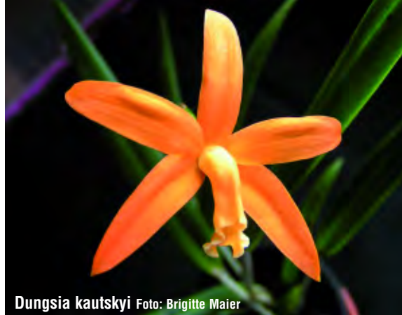
Dungsia kautskyi

Blüte erhält so meist eine etwas rundere Gesamterscheinung. Außerdem ist diese Art am deutlich kürzeren, breiteren und am Ende abgerundeten Mittellappen der Lippe deutlich von harpophylla abzugrenzen. Die auch in der Natur vorkommenden gemeinsamen Hybriden könnten aber die Bestimmung von Einzelpflanzen erschweren. Von Farbformen ist mir nichts bekannt, die Art wird aber sicher auch von verschiedenen Gelb- bis zu hellen Orangetönen variieren. Das gemeinsame Vorkommen mit Dungsia harpophylla lässt auf eine ähnliche Kultur schließen.