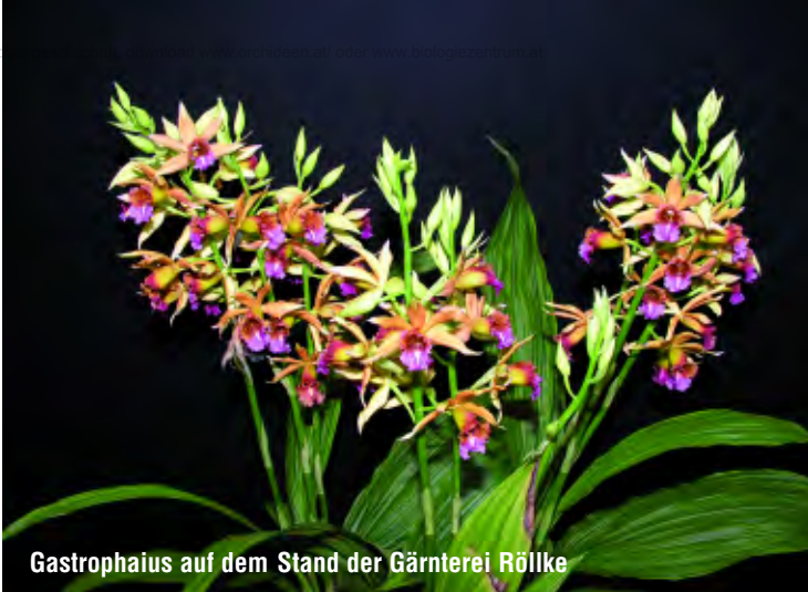
Gastrophaius auf dem Stand der Gärtnerei Röllke

Zum Glück war der Winter heuer so mild, dass die frisch gekauften Orchideen der über 18.000 Besucher auch den Heimweg unbeschadet überstanden. Das neue Konzept hat sicher viele Freunde gefunden, die hoffentlich auch nächstes Jahr wieder zu den Besuchern der dann bereits 6. Orchideenschau in Hirschstetten zählen werden. M