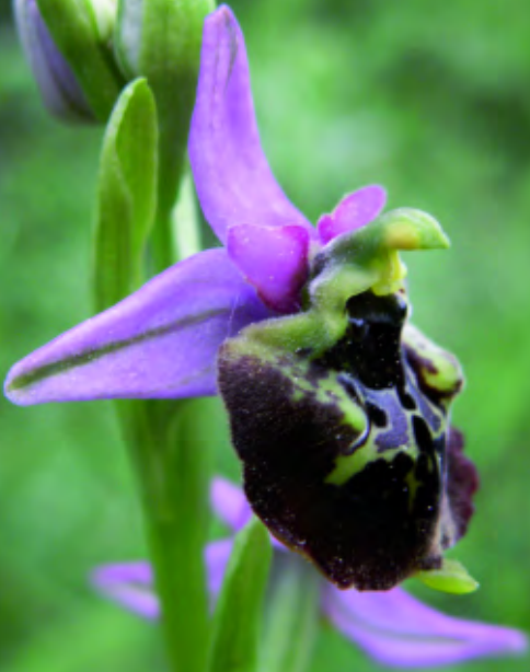
Hummelragwurz, rosa Form