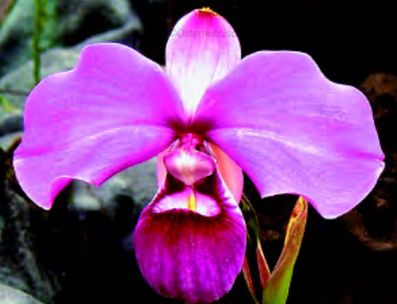
P. kovachii 'Memoria Grimesa Manrique'