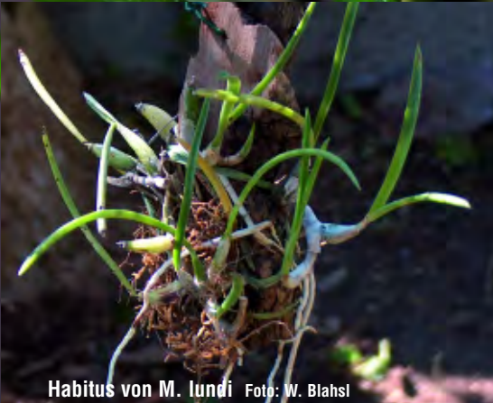
Habitus von M. lundii