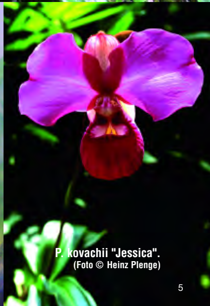
P. kovachii "Jessica".