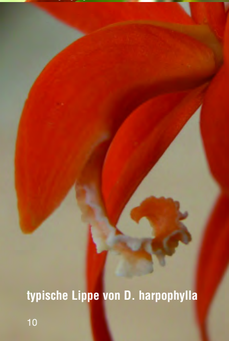
typische Lippe von D. harpophylla