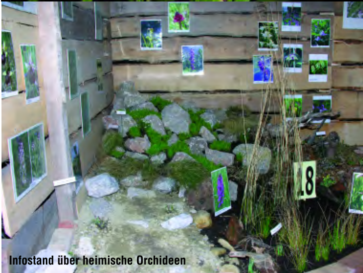
Infostand über heimische Orchideen