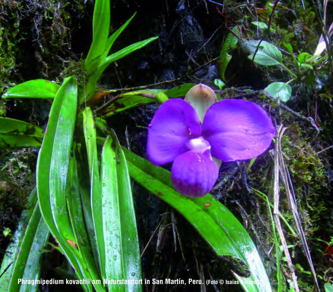
Phragmipedium kovachii am Naturstandort in San Martín, Peru.