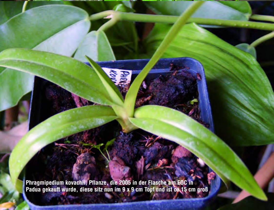
Phragmipedium kovachii , Pflanze, die 2005 in der Flasche am EOC in Padua gekauft wurde, diese sitzt nun im 9 x 9 cm Topf und ist ca 15 cm groß