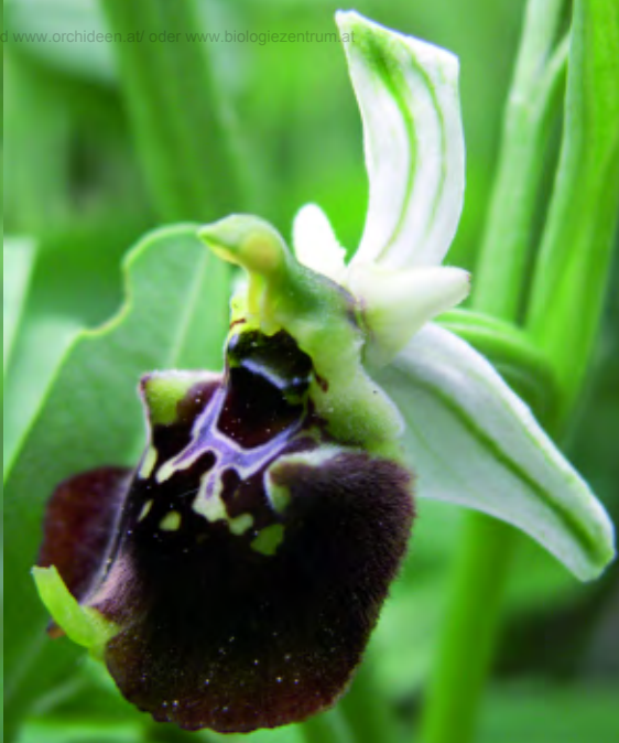
typische Lippe imitiert Bienenweibchen