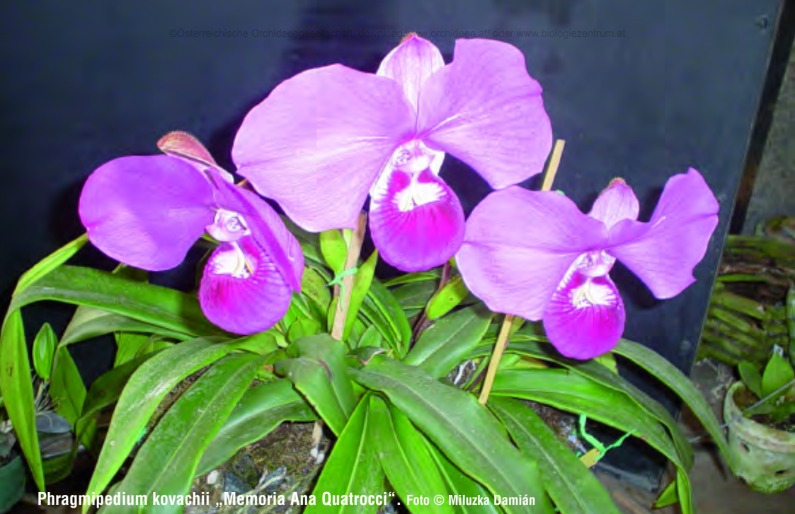
Phragmipedium kovachii „Memoria Ana Quatrocci“.