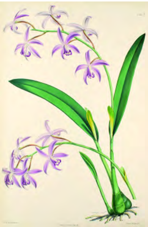
Sophronitis crispata (Laelia rupestris), Robert Warner, Select Orchidaceous Plants, 1865–1875, Tafel 6

Für die systematisch-taxonomische Forschung sind Herbarien nach wie vor von größter Wichtigkeit. Sie dienen als Vergleichssammlungen und sind wichtige Quellen für Revisionen,