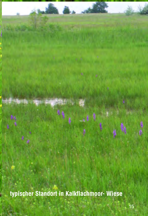
typischer Standort in Kalkflachmoor- Wiese