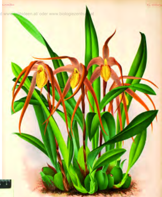
Maxillaria macrura aus Lindenia Iconographie des Orchidé, 1890 Tafel 248

Der Teil der modernen Referenzliteratur ist komplett und dadurch eine immens wertvolle Basis für die Orchideenforschung. Die Separatasammlung von etwa 5000 wissenschaftlichen Artikeln über Orchideen stammt aus verschiedenen Quellen und stellt eine außerordentlich reiche und komplette Sammlung von Orchideenliteratur dar. Beide