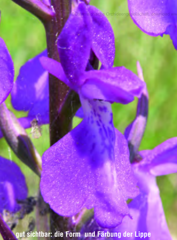
gut sichtbar: die Form und Färbung der Lippe