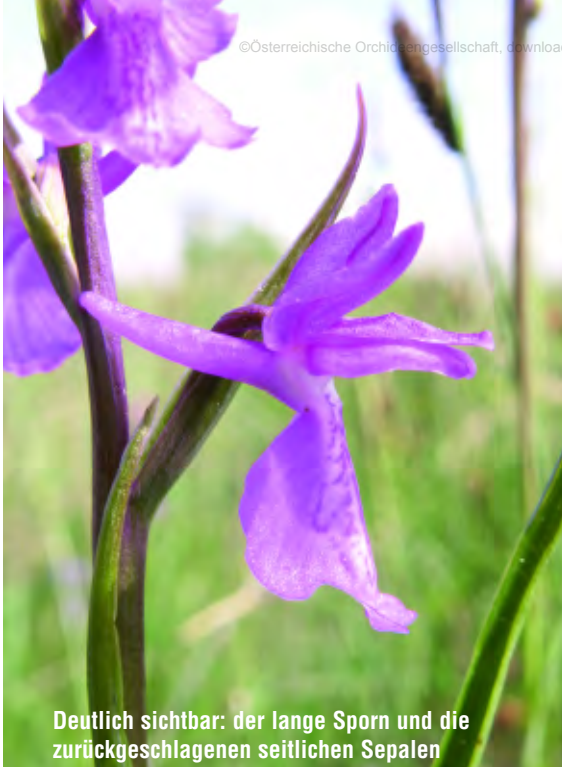
Deutlich sichtbar: der lange Sporn und die zurückgeschlagenen seitlichen Sepalen