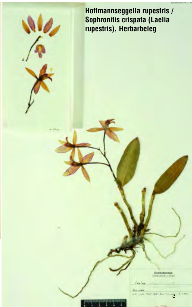
Hoffmannseggella rupestris / Sophronitis crispata (Laelia rupestris), Herbarbeleg