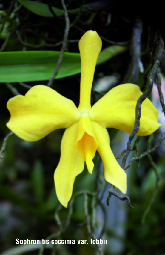
Sophronitis coccinia var. lobbii