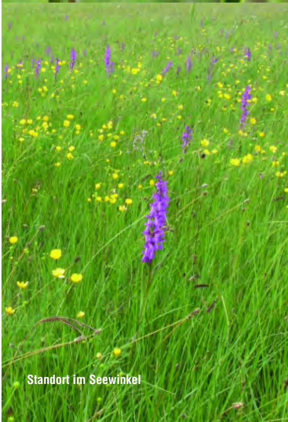
Standort im Seewinkel