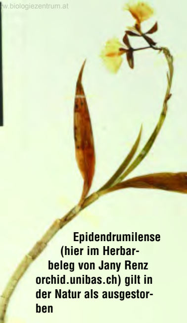
Epidendrumilense (hier im Herbarbeleg von Jany Renz orchid.unibas.ch) gilt in der Natur als ausgestorben

Frischimporte aus Asien oder Südamerika, die zwar offiziell als künstliche Nachzuchten gehandelt und auch mit Papieren ausgestattet wurden, in Wirklichkeit aber garantiert Naturentnahmen sind, die nur aus einem Grund aus dem Regenwald gerissen wurden: Um unsere Gier nach günstigen seltenen Pflanzen zu befriedigen. Und wenn Orchideen zu kommerziellen Zwecken gesammelt werden, beschränkt sich die Sammlung nicht auf die „vom Baum gefallene“ Pflanze am Wegesrand. Da wird alles gesammelt, was nicht weglauen kann.