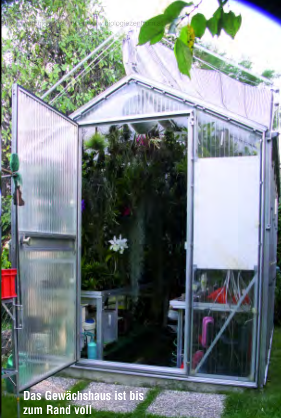
Das Gewächshaus ist bis zum Rand voll

te ich mich auf den Weg in den zehnten Bezirk, nach Wien-Favoriten, wo Herr Pratter in einer Kleingartensiedlung sein Glashaus stehen hat. Hier hatte ich die Gelegenheit, sein Gewächshaus zu besichtigen und ihm im Laufe eines angeregten Gesprächs konkrete Informationen über seinen Weg zu den und zum Erfolg mit den Orchideen zu entlocken. Und an diesen möchte ich Sie gerne teilhaben lassen.