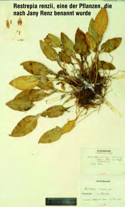
Restrepia renzii , eine der Pflanzen, die nach Jany Renz benannt wurde

Der Dachstock seines Wohnhauses enthielt sein privates Herbarium mit 20.000 Belegen, einschließlich sämtlicher Typen der von ihm neu beschriebenen Orchideentaxa sowie eine der weltweit umfangreichsten Bibliotheken mit Orchideenliteratur.