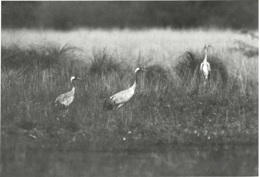
Abb. 2 Übersommerndes Kranich-Paar im Schwäbischen Donaumoos, aufgenommen im Spätsommer 2002.