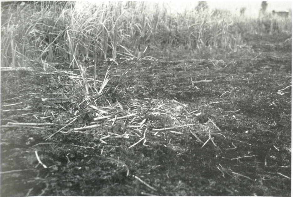
Abb. 3 Anhäufung von Nistmaterial im Hauptaufenthaltszentrum der Kraniche 2003, nach NOWALD interpretierbar als Beginn eines „Schlaf-“ oder „Verlobungsnestes“, angelegt am Rand einer im Frühsommer flach überstauten Stelle im Seggenried eines ehemaligen Torfstiches.

In den Jahren 2003 und 2004 wiederholten sich ähnliche Beobachtungen, wobei in diesen beiden Jahren die Tiere in den Sommermonaten jeweils einige Zeit nicht mehr beobachtet wurden. Sie kamen aber immer wieder ins Gebiet zurück, sodass wohl trotzdem von Übersommerung gesprochen werden kann, die Tiere wohl lediglich „größere Ausflüge“ in die Umgebung unternommen hatten. Im Winter 2003 wurde dann bei der Nachsuche eine Art angefangenes Nest gefunden, das nach Ansicht des anerkannten Kranich-Experten Günter Nowald eine Art „Schlaf-“ oder „Verlobungsnest“ darstellen könnte (Abb. 3; NOWALD pers. Mitt.). Das Jahr 2004 war im Schwäbischen Donaumoos durch eine früh einsetzende, extreme Trockenheit geprägt. Ob dies einen Bruterfolg verhinderte, oder die Vögel aus anderen Gründen keinen Brutversuch unternahmen oder dieser scheiterte, ist nicht bekannt. In diesem Jahr hatten sich im zeitigen Frühjahr wieder bis zu 4 Vögel, meist paarweise beieinander, aufgehalten. In den trockenen Sommermonaten waren sie dann länger als in den früheren Jahren abwesend, doch kamen wenigstens 2 Tiere (1 Paar?) immer wieder in das engere Gebiet zurück, bevor dann im Herbst der Zug einsetzte. Der Höhepunkt des ausklingenden Jahres 2004 war dann die mind. einwöchige Anwesenheit von bis zu 86 Tieren Ende November. Zuletzt wurden noch bis zum 20. Dezember 2 Tiere im Kerngebiet des Hauptaufenthaltsraumes beobachtet - Anlass zur Hoffnung auf einen Brutversuch in 2005?