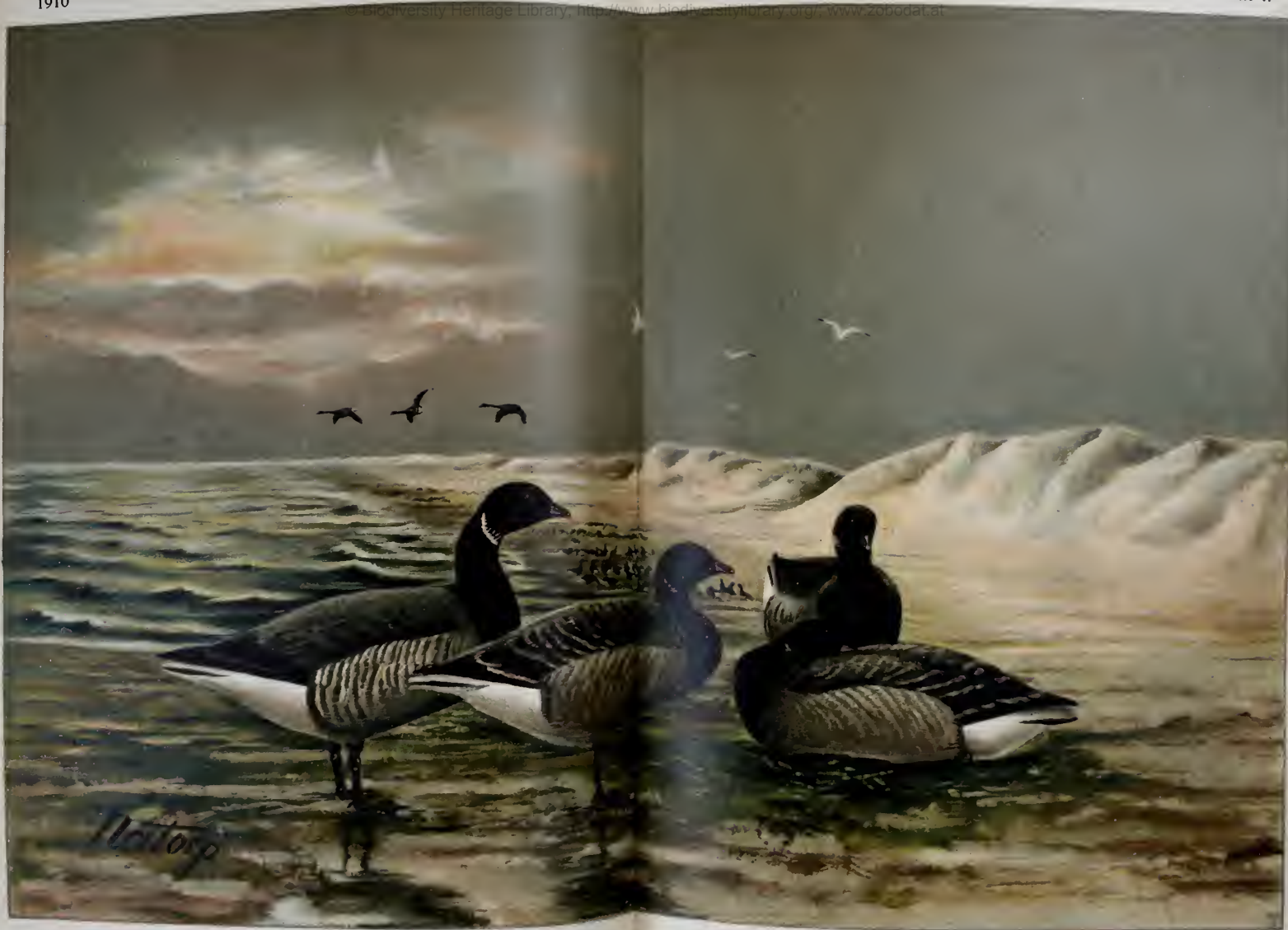
Ringelgans, Branta bernicla (L.)