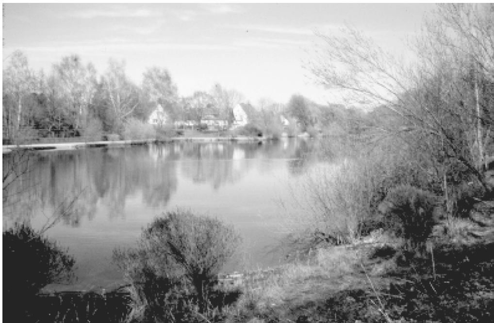
Abb. 5: RWRB Pappelsee

das von weitgehend gehölzbestandenen Böschungen und einem schmalen Grünstreifen eingerahmt wird. Der vegetationsbedingte Strukturreichtum ist nicht hoch, und die intensive Naherholungsnutzung führt zu starken Beeinträchtigungen.