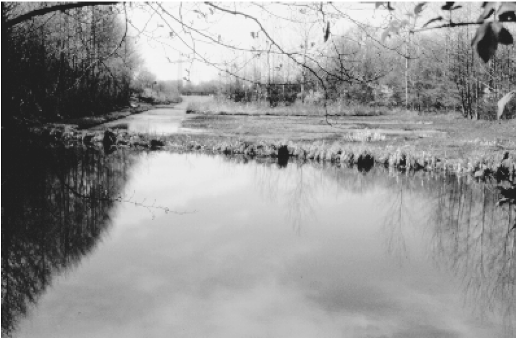
Abb. 6: RWRB Sackstraße