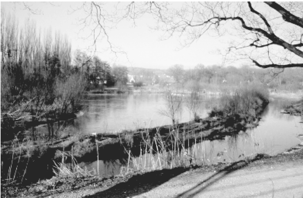
Abb. 4: RWRB Nettebecken