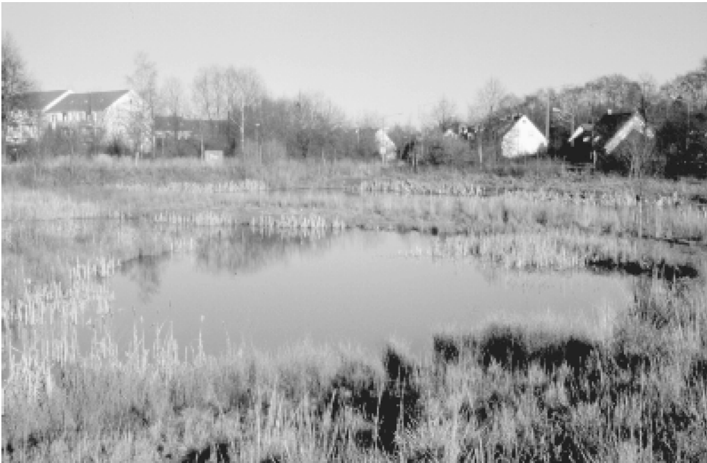
Abb. 3: RWRB Burenkamp