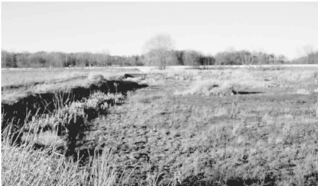
Abb. 2: RWRB Averdiekstraße.