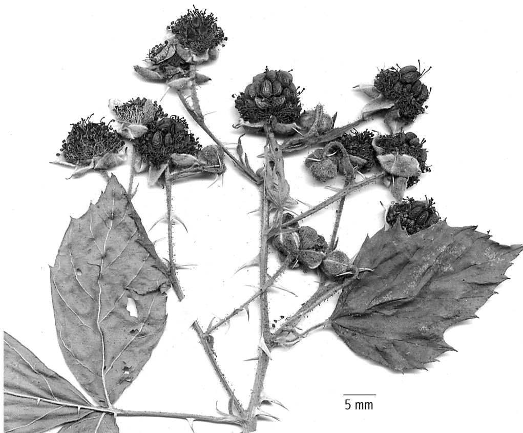
Abb. 2: Rubus ehrnsbergeri . – Oberer Teil des Blütenstands (Exemplar Weber 77.811.1, We)

Blätter 5-zählig [seltener 5-6-zählig], oberseits mit 50-100 (selten mit 15-50) Haaren pro cm 2 , unterseits grün, ± samtig weich behaart. Endblättchen lebend oft konvex, mäßig lang gestielt (Stielchenlänge 24-30 % der Spreitenlänge), aus breiter herzförmiger Basis (breit) eiförmig, oft leicht bis deutlich 1-2-lappig (seltener 2-3-zählig), mit etwas abgesetzter, 10-12 mm langer Spitze. Serratur mit scharf zugespitzten Zähnen fast gleichmäßig bis etwas periodisch und dann mit etwas längeren, geraden Hauptzähnen, bis etwa 2-3 mm tief. Untere Seitenblättchen ungestielt. Blattstiel viel länger als die unteren Blättchen, behaart und stieldrüsiger, mit 9-14 geneigten und fast geraden bis leicht