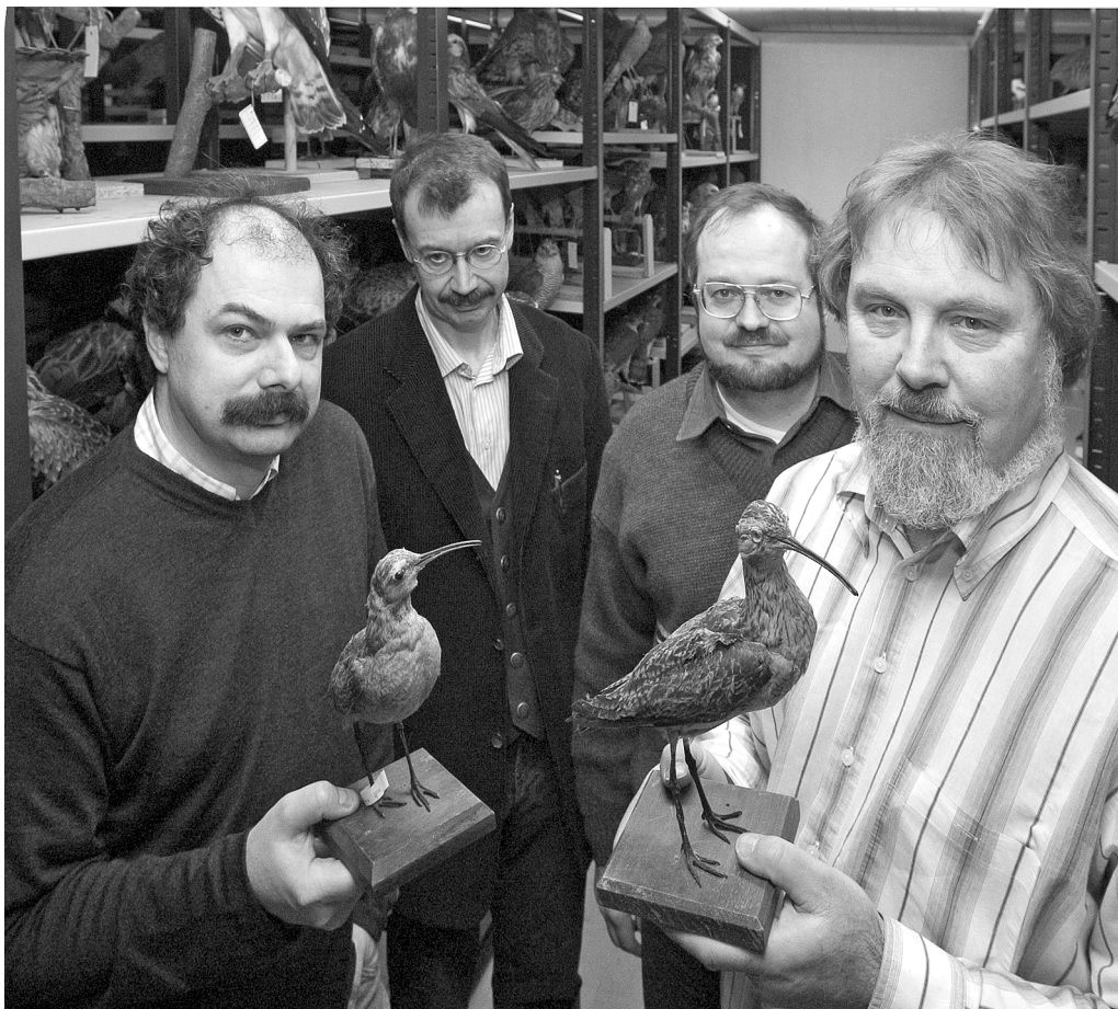
Abb. 1: Eskimobrachvogel, links Männchen, rechts Weibchen.