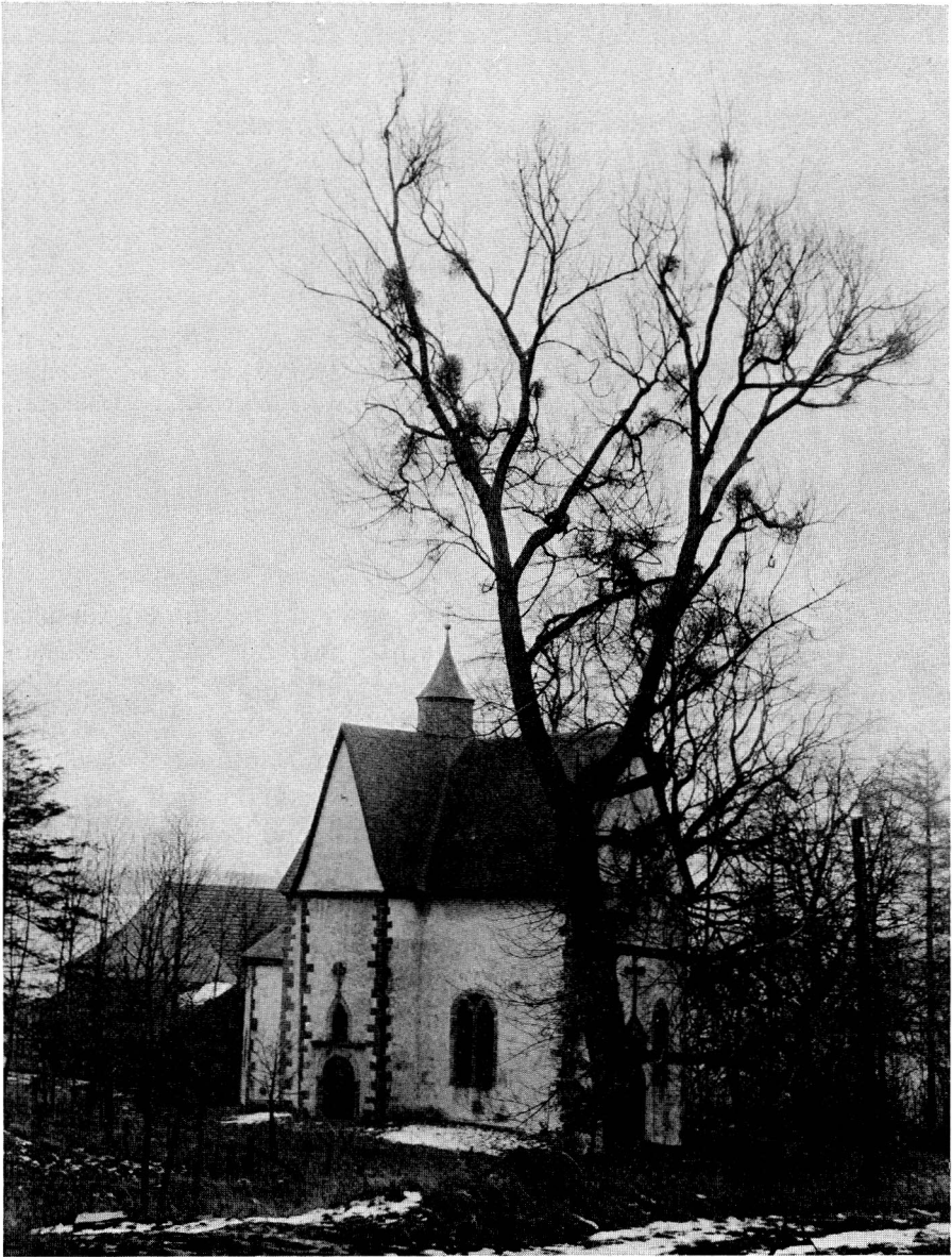
Abb. 1 Alte Schwarzpappelhybride vor der Kapelle am Kapellenberg in Büren mit Misteln