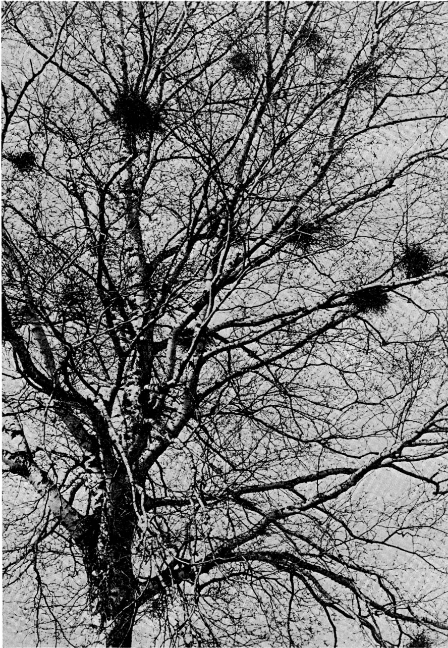
Abb. 2 Hexenbesen auf einer Birke bei Lippinghausen