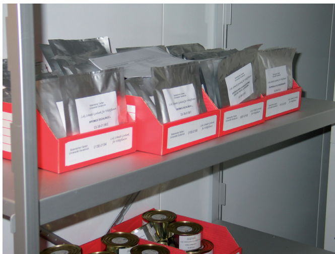
Abb. 2: Saatgutaufbewahrung in vakuumverschweißten Alu-Polyethylen Verbundbeuteln

Seit 2002 wurde damit begonnen, Wildpflanzensaatgut gezielt für die Loki Schmidt-Genbank zu sammeln. Im Jahr 2003 wurde die „Loki Schmidt-Genbank für Wildpflanzen“ als erste offizielle Genbank für Wildpflanzen in Deutschland in Anwesenheit von Frau Prof. Dr. h.c. Hannelore (Loki) Schmidt am Botanischen Garten der Universität Osnabrück eingeweiht.