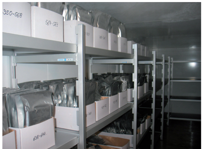
Abb. 1: Blick in die Tiefkühlräume der Loki Schmidt Genbank

Ein dezentrales Netzwerk regionaler Genbanken für heimische Wildpflanzen in Deutschland ist von uns schon frühzeitig vor-