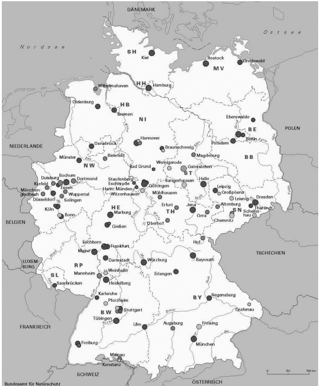
Abb. 6: Überblick über die Botanischen Gärten in Deutschland und vergleichbare Einrichtungen (Klingenstein et al. 2002a)