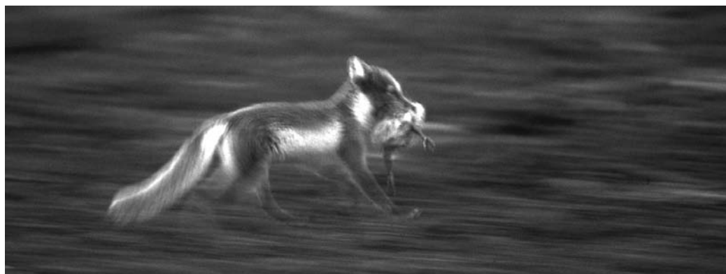
Abb. 6: Eisfuchse sind erfolgreiche Kükenjäger.

Besonders vor dem Hintergrund drohender Gefahr sind Gänse in ihrem Verhalten besonders anpassungsfähig. Verhaltensänderungen stehen immer in Zusammenhang mit konkreten Erfahrungen der Individuen. Diese sind nicht nur von der Prädatorenart abhängig, sondern maßgeblich auch von den Habitatbedingungen des Brutgebietes. So sind die Nonnengänse auf Svalbard allein durch das Fehlen höherer Vegetation aus Weiden oder Birken gezwungen, andere Strategien als ein Verbergen zu entwickeln. Je nach den äußeren Rahmenbedingungen können sie ihre Strategie anpassen und optimieren: während auf Svalbard die Ufernähe guten Schutz bietet, ist es auf Kolguyev entweder der Schutz der großen Gruppe oder der dichten Vegetation. Die Anwesenheit weiterer Fressfeinde mit anderen Jagdstrategien erfordert ebenfalls Anpassungen der Elternvögel. Die Kenntnis verschiedener Feinde und möglicher alternativer Verhaltensweisen ermöglicht die notwendige kurzfristige Verhaltensänderung. Dadurch erklärt sich, dass erfahrene Brutpaare