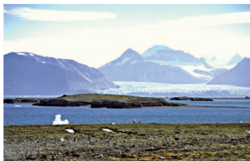
Abb. 2: Untersuchungsgebiet Kongsfjorden (Ny-Ålesund).

Ny-Ålesund ist die nördlichste menschliche Ansiedlung und liegt am Kongsfjorden (Svalbard / Spitzbergen, 78° 55'N, 11° 56'E). Es ist eine ehemalige Bergarbeitersiedlung, die heute ausschließlich für wissenschaftliche Zwecke durch Forschungsinstitute zahlreicher Staaten genutzt werden darf. Dem Dorf vorgelagert liegen mehrere kleine Inseln, die von Nonnengänsen als Koloniestandorte genutzt werden. Mit den Küken schwimmen die Nonnengänsen dann an das Festlandufer. Hier befinden sich mehrere kleine Seen, um die sich grasige und moosreiche Vegetation findet. Abseits der Seen wird das Gelände trockener, felsiger und die Vegetation ändert sich. Saxifragaceen dominieren hier.