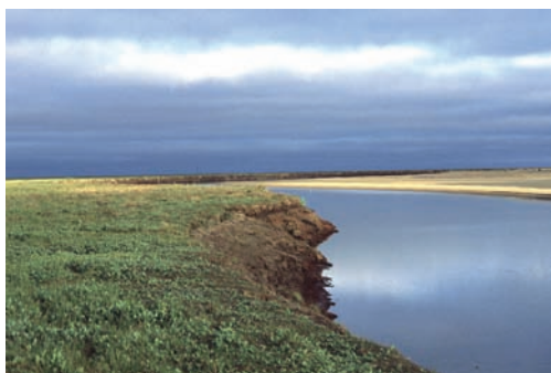
Abb. 3: Untersuchungsgebiet Kolguyev.

Der Permafrost findet sich etwa 75 cm unter der Oberfläche, an einigen Stellen kommt er sogar 38 cm unter der Vegetation vor. Bereits in der zweiten Hälfte des September fällt