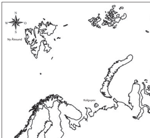
Abb. 1: Lage der Untersuchungsgebiete Ny-Ålesund, Svalbard und Kolguyev, Barentssee

Die Insel Kolguyev liegt abgeschieden und schwer erreichbar an der südöstlichen Schelfzone der Barentssee (69°N / 50°E). Sie ist 75 km in der Nord-Süd- und ca. 60 km in der West-Ost-Ausdehnung groß und liegt 70 km vor der Festlandküste. Die Gesamtgröße beträgt 5200 km 2 (Kruckenberg et al. 2008, Abb. 1). Die Insel ist umgeben von Sandbänken und wattenartigen Lagunen. Auf der Insel selbst können zwei Bereiche unterschieden werden: der nördliche Inselteil ist geprägt durch eine Moränenlandschaft mit Hügeln