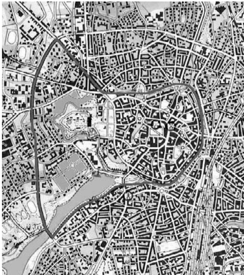
Abb. 1: Karte der Innenstadt von Münster. Die Begrenzung des Untersuchungsgebietes ist durch Rauten gekennzeichnet und verläuft im Westen entlang des „Rings“, führt dann über die Steinfurter Straße im Norden bzw. den Aasee im Süden zum Promenadenring um die Altstadt.

schlossene waldähnliche Fläche weist der Schlossgarten westlich des Schlosses dicht bewachsene Laubwaldpartien auf.