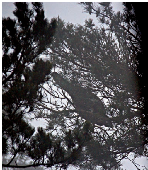
Abb. 3: Auerhahn auf einer Kiefer in einem der vier untersuchten Winternutzungszentren.

gruppen wurden ausgewählt und jeweils im Winterhalbjahr 2001/02 bis 2004/05 systematisch untersucht. Um herauszufinden, ob es Bevorzugungen einzelner Bäume gibt, wurden jeden Winter die genutzten Bäume mit Farbbändern markiert. So konnte die Wiedernutzungsrate ermittelt werden. Die Winternutzungszentren sind durch die unter den Bäumen in großen Mengen vorhandene Lösung gut zu finden. Oft verbringen die Vögel viele Tage auf einem bevorzugten Baum (Abb. 3).