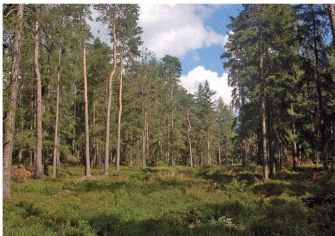
Abb. 4: Winternutzungszentrum an einer breiten Schneise.