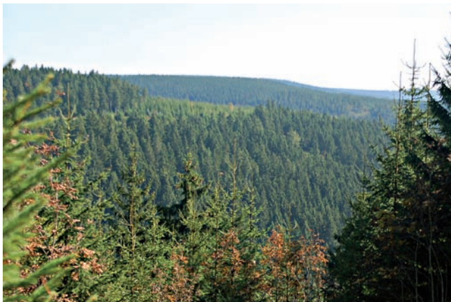
Abb. 2: Typische Landschaft im Thüringer Schiefergebirge.

erschlag nimmt von Norden mit 800 mm nach Süden auf 1000 bis 1200 mm zu. In den höchsten Lagen des Untersuchungsgebietes, um Neuhaus und Steinheid, fallen bis 1400 mm Niederschlag im Jahr (Hiekel et al. 2004). Die Jahresdurchschnittstemperatur beträgt im gesamten Gebiet 5 bis 6°C, das Januarmittel -3°C und das Julimittel 14–15°C. Die höchsten Niederschlagsraten werden in den Monaten Oktober bis Februar registriert.