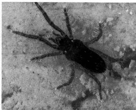
Abb. 3 Rhagidia halophila mit einem Kotballen im Colon, ca. 25x.