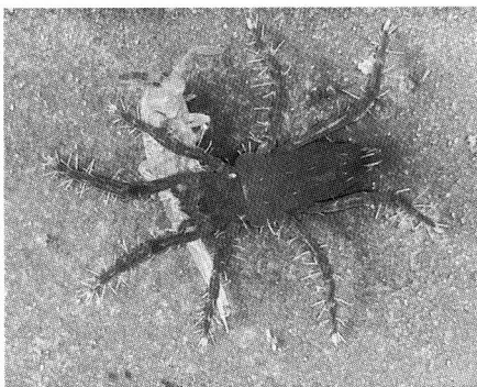
Abb. 1 Rhagidia halophila beim Fressen eines Springschwanzes, ca. 25x.

Die Bedeutung der Rhagidia -Organe auf dem 1. und 2. Beinpaar als Nahsinnesorgane bei der Nahrungsaufnahme ist ungeklärt. Da das 2. Beinpaar gar nicht mit der Nahrung in Berührung kommt, scheinen die Nahsinnesorgane hierfür nicht notwendig zu sein. Auch Rhagidien, denen beim Einfangen das erste Beinpaar abgerissen wurde, können ihre Beute ebenso sicher erkennen. Rhagidia longisensilla besitzt z. B. außerdem am 3. und 4. Beinpaar Rhagidia -Organe, die ebenfalls keine Bedeutung für das Erkennen der Beutetiere haben können.