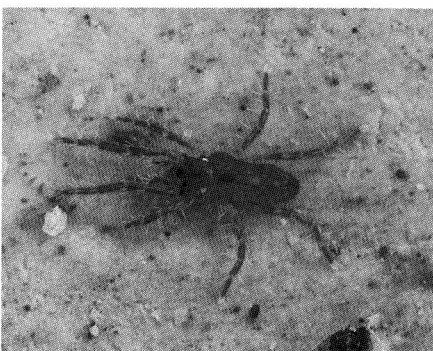
Abb. 5 Rhagidia halophila mit einem Kotballen im Colon und einem Kotballen mit angelagerten Exkreten im Postcolon, ca. 20x.

Hinterende gegen das Substrat. Dabei tritt der längliche Kotballen aus, umgeben von einem klaren Tröpfchen, das sofort vom Substrat aufgesaugt wird. Bei Rhagidia halophila kann der Kotballen eine Länge von 300 \mu\text{m} und einen Durchmesser von 50 \mu\text{m} erreichen. Bevor der Kotballen aus dem posterioren Exkretionsdarmabschnitt abgegeben wird, bildet sich im anterioren bereits ein neuer. Deshalb sind bei vielen Rhagidien im Exkretionsdarm zwei hintereinander liegende Ballen zu sehen (Abb. 5). Durch die Lebendbeobachtungen an einer Rhagidie während der Nahrungsverarbeitung kann man feststellen, daß eine Verbindung zwischen dem Ventrikel und dem Exkretionsdarm besteht. Das widerspricht den weit verbreiteten Darstellungen über den blindgeschlossenen Mitteldarm bei den Trombidiformes. Die Lage der beiden Kotballen im Exkretionsdarm macht deutlich, daß dieser in zwei Abschnitte geteilt ist. ALBERTI (1973) konnte bei den Bdelliden ebenfalls einen durchgehenden Darmtrakt feststellen. Der von ihm als Colon bezeichnete Darmabschnitt zwischen Ventrikel und Rectum ist nicht untergliedert.