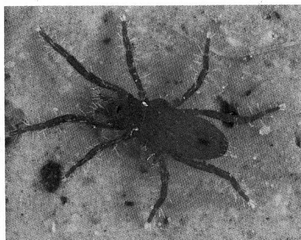
Abb. 4 Rhagidia halophila mit einem Kotballen im Postcolon, ca. 25x.