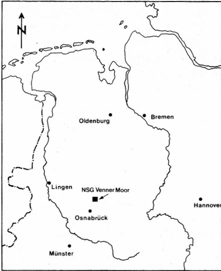
Abb. 1 Lage des Venner Moores in Nord-westdeutschland

Der Landkreis Osnabrück hat bisher eine Fläche von ca. 220 ha im Venner Moor als Naturschutzgebiet sichergestellt (22. 10. 76) und davon 170 ha für rund 600 000 DM angekauft. Der Erweiterungsplan sieht vor, die Schutzfläche des NSG auf 250–300 ha zu vergrößern (BEYER, mündl.).