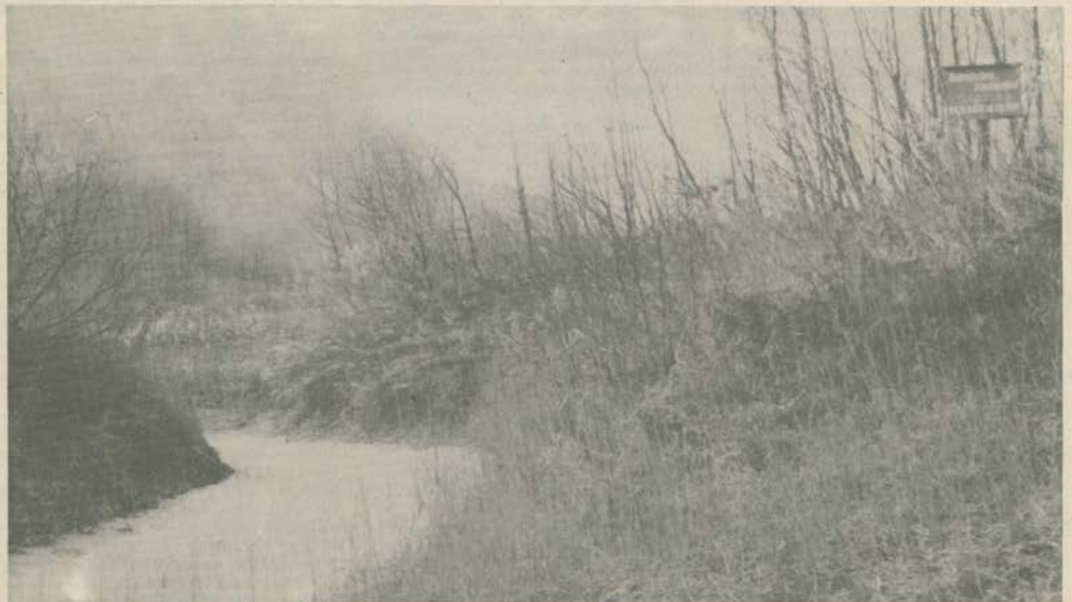
Gelände des Nörsacher Tümpels; Text auf der Tafel: „Biologisches Schutzgebiet, Feuchtbiotop, Bitte nicht betreten!“

Schwimmkäfer (Dytiscidae): Guignotus pusillus , Agabus congener , A. paludosus , A. sturmi , Platambus maculatus , Ilybius ater , Hydroporus discretus , H. erythrocephalus (1960 bis 1963 in alten Tümpeln), H. marginatus (18. 4. 70), H. palustris (häufigste Art der Gattung) u. a. recht regelmäßig anzutreffen auch der größte einheimische Schwimmkäfer: Gelbrand ( Dytiscus marginalis ), dessen Larve