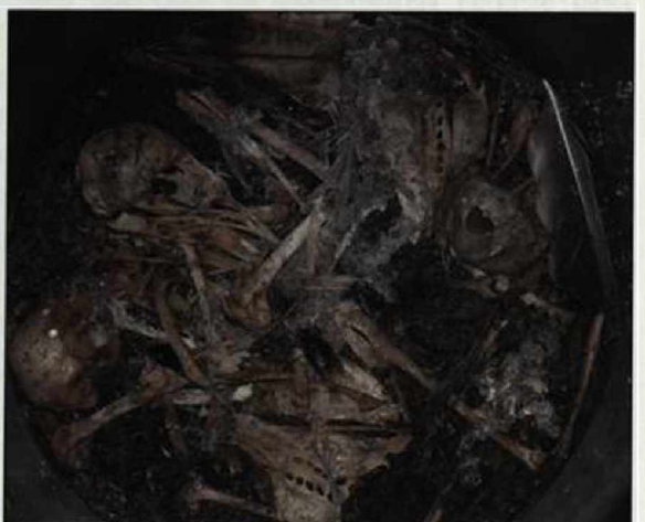
Abb. 8: Schädel und Knochen von drei toten Staren. Federn sind größtenteils nicht mehr vorhanden.

Fig. 7: Dead Starling. Cranium and sacrum are visible.