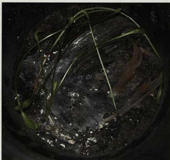
Abb. 2: Toter Rotschwanz, deutlich erkennbar an den Steuerfedern.

Fig. 1: Southern boundary of the paddock, Barnewitz, Havelland, October 2007.