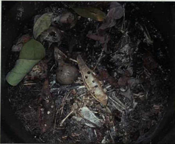
Abb. 5: Schädel von vier kleineren Singvögeln. An der rechten Bildseite ist eine Nacktschnecke erkennbar.

Fig. 5: Craniums of four small songbirds. A slug is distinguishable on the right side of the picture.