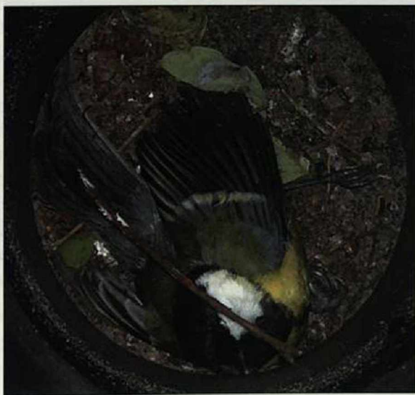
Abb. 4: Frisch tote Kohlmeise.

Fig. 3: Small dead songbird. The contours of the head, body and the left leg are visible.