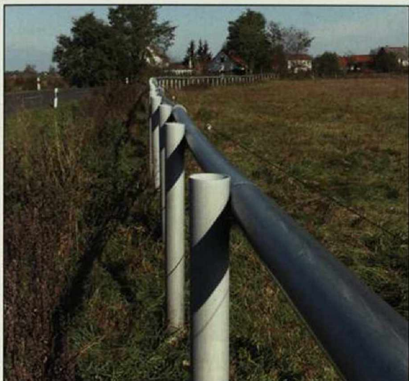
Abb. 1: Südseite der Pferdekoppel, Barnewitz, Havelland, Oktober 2007.

Fig. 1: Southern boundary of the paddock, Barnewitz, Havelland, October 2007.