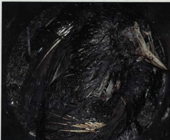
Abb. 7: Toter Star. Schädel und Beckenknochen sind sichtbar.

Fig. 6: Dead Starling. The cranium of another bird is clearly distinguishable.