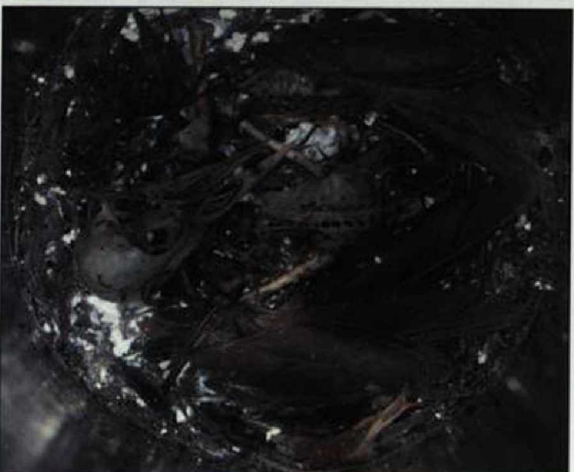
Abb. 9: Schädel und Knochen eines Stares mit deutlichem Bewuchs von einem Schimmelpilz.

Fig. 8: Craniums and bones of three dead starlings. Feathers are to a great extent no longer present.