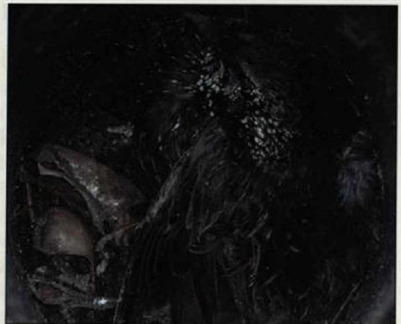
Abb. 6: Toter Star. Der Schädel eines weiteren starengroßen Vogels ist deutlich zu erkennen.

Fig. 5: Craniums of four small songbirds. A slug is distinguishable on the right side of the picture.