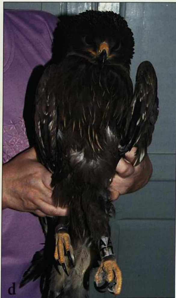
Schreiadler „AT“ aus dem Projekt Jungvogelmanagement, der auf Malta abgeschossen und auf den Namen „Sigmar“ getauft wurde. a) bei der Aufzucht, b) im Horst, c) fliegend und d) nach dem Abschuss auf Malta.