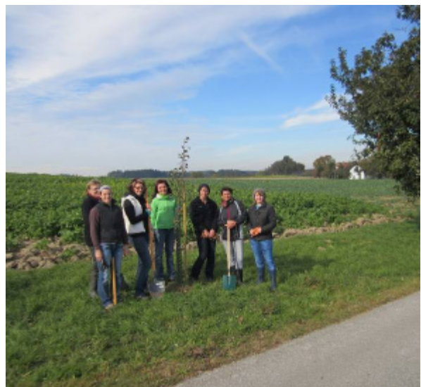
Die dm-Mitarbeiterinnen beim Pflanzen eines Apfelbaumes.

Hier wurden auch in den darauf folgenden Tagen die gesammelten Früchte gepresst, der Saft in Bag-in-Box-Behälter abgefüllt und als „Österreichische Naturpark-Spezialität“ vermarktet.